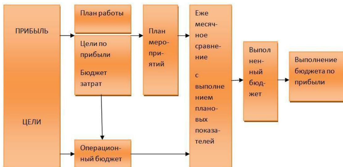
Рис. 1.2. Взаимосвязь между планом работы и бюджетным контролем

мероприятия, с целью улучшить будущее выполнение плана. Разработка мероприятий проводится по результатам контроля за работой, проводимой постоянно в течение года. Управление прибыльностью наиболее эффективно проводится посредством контроля за бюджетом и правильным выбором показателей по измерению и управлению результатами. Общая схема планирования и бюджетирования отделов запчастей приведена на рис. 1.2.