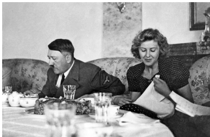
Гитлер и Ева Браун