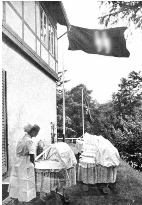
Родильный дом Лебенсборн

истинных арийцев. Также Лебенсборн включал в себя сеть детских домов, куда свозили отобранных пленных младенцев.