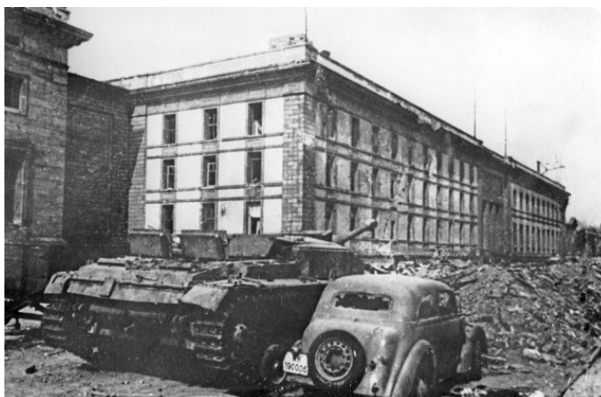
Бункер Гитлева в Берлине

Хойзерман вспоминает, что в здании рейхсканцелярии у профессора Блажки был маленький кабинет. И там должны оставаться стоматологические карты Гитлера. Нужные документы оказались на месте.