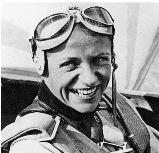
Ханна Райч – немецкая летчица-испытательница

Затем внешний осмотр показал, что у Гитлера нет одного яичка, как будто бы во время Первой мировой войны он был ранен и, соответственно, как мужчина был не совсем полноценен.