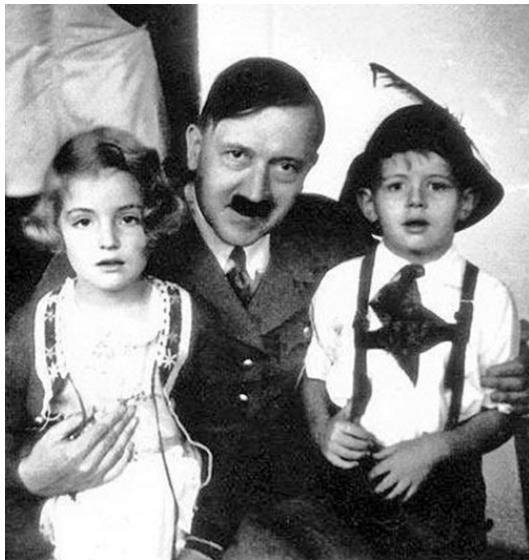
Гитлер с Эмми и Эддой Геринг

Существует теория, что Гесс с доктором Карлом Клаубергом пошли дальше. Якобы они начали опыты по искусственному оплодотворению женщин семенем Гитлера.