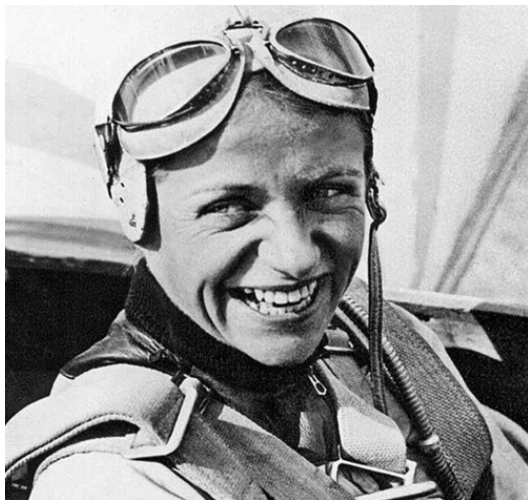
Ханна Райч – немецкая летчица-испытательница

Затем внешний осмотр показал, что у Гитлера нет одного яичка, как будто бы во время Первой мировой войны он был ранен и, соответственно, как мужчина был не совсем полноценен.