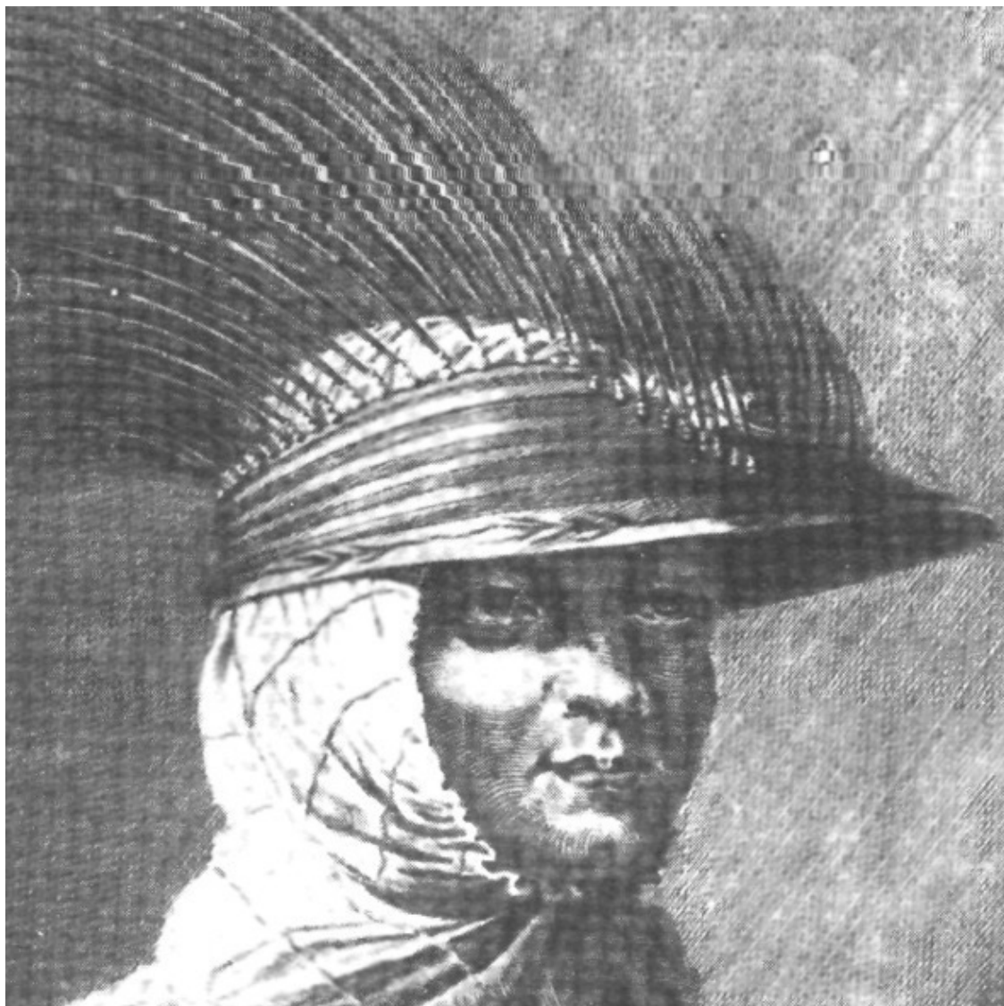
Алеут, старинные рисунки мореплавателей, из книги Репина Л. Б., Своязь ярость бурь, 2-е изд., М., «Детская литература», 1988, с. 234