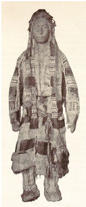
Самодийское зимнее платье. Фото около 1906 года.