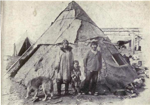
Эскимосская семья в 1915 году летнее жилище