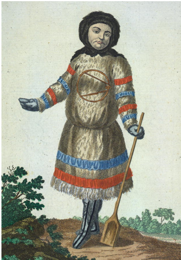
Самодийка. Конец 18 века. (Википедия)