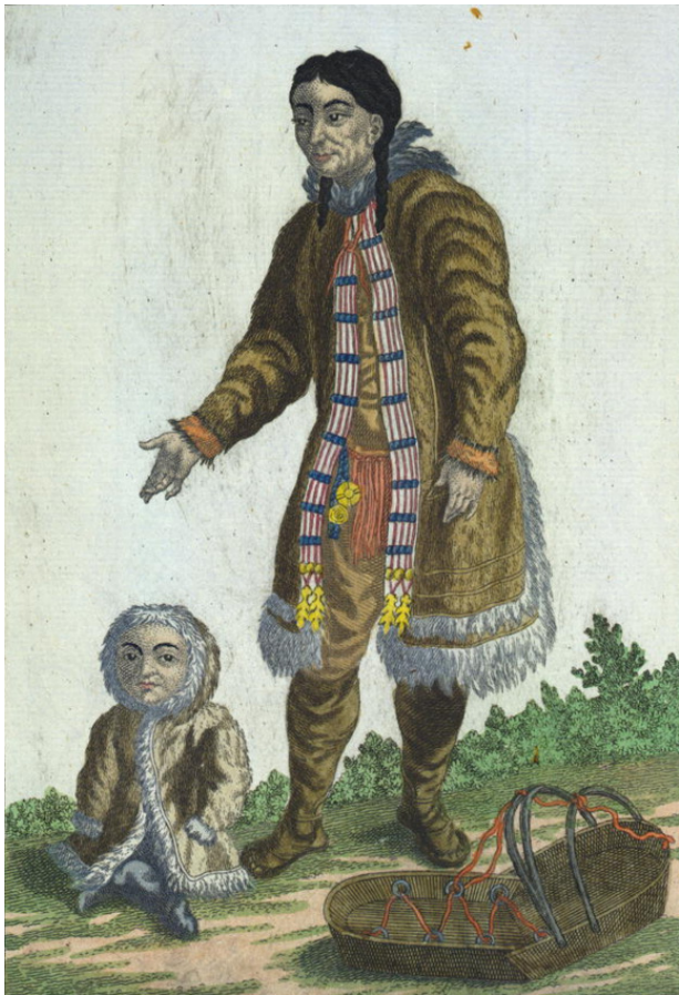
Самодийка в летнем платье. Конец 18 века.