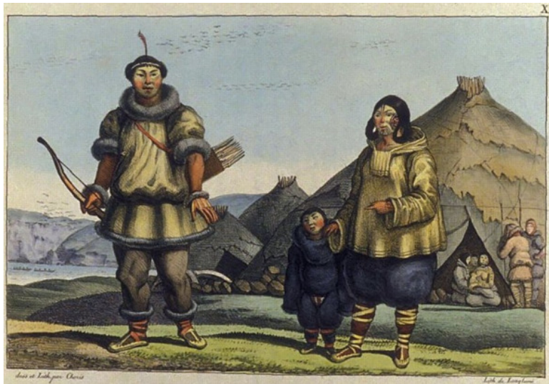
Чукотская семья перед своим домом. Август 1816, южнее Чукотского мыса, побережье Берингова моря. Рисунок Louis Choris (Википедия)