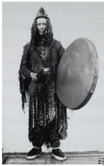
Юкагирский шаман, 1902 г.