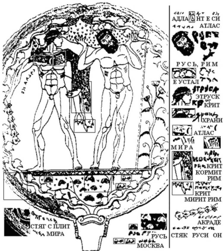
Рис. 2. Мое чтение надписей на одном из этруских зеркал

Чтение явной надписи будет, как обычно, справа налево. Правое слово АДЛА не дописано, недостающие буквы Н и Т