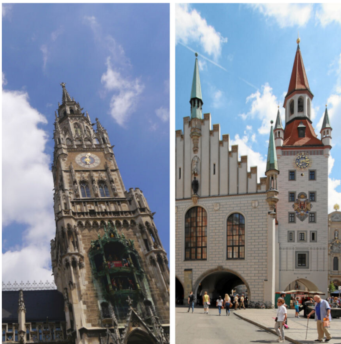
Новая (слева) и Старая Ратуши

Любимая мюнхенская шутка: на Мариенплац стоят две Ратуши – какая из них Старая, а какая Новая?