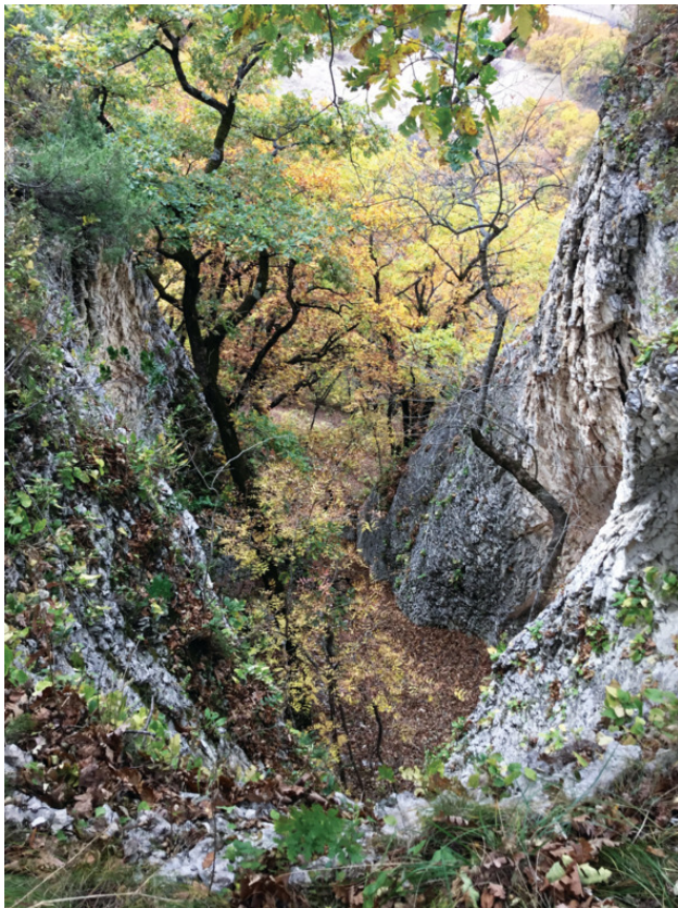
Ущелье в окрестностях станции Каладжинской