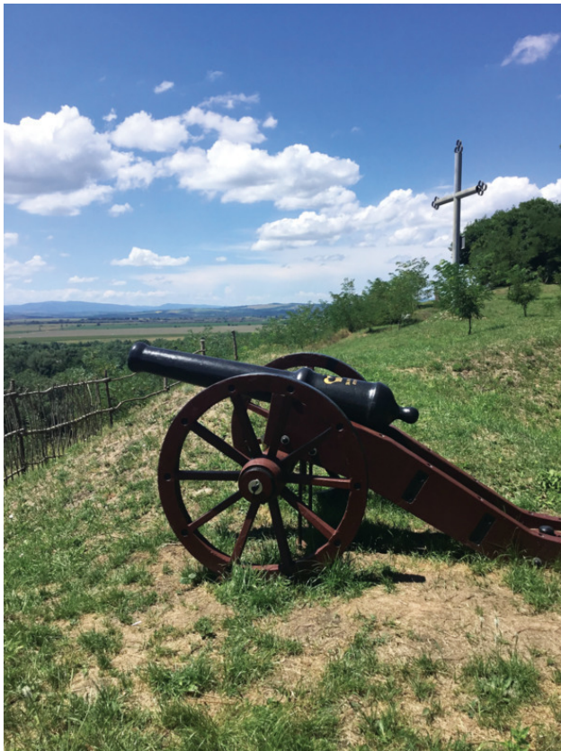
Каладжинский укрепленный пост