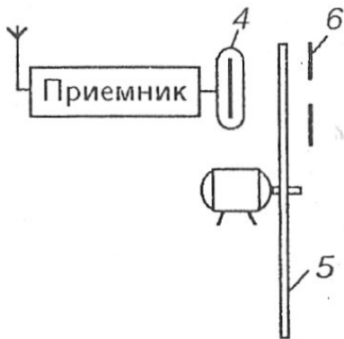
Рис. 3. Приемная часть системы Нипкова

Благодаря тому, что диски на передаче и приеме идентичны и вращаются синхронно, световой поток, проходящий через отверстия приемного диска в каждый момент времени, соответствует яркости элементов передаваемого объекта. При высокой скорости вращения дисков (12,5 оборота в секунду) совокупность движущихся светящихся точек воспринимается как слитное изображение.