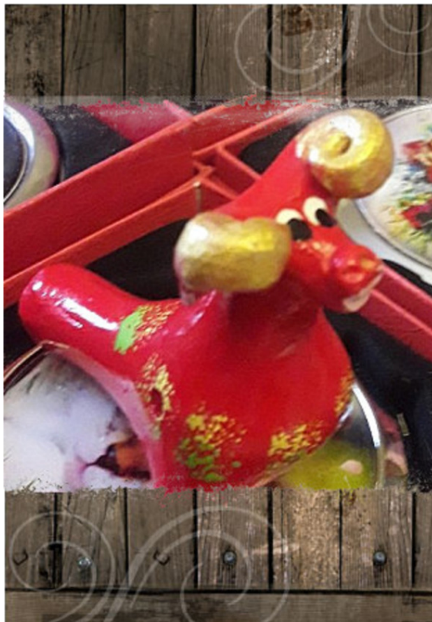
Огненный барашек с золотыми рогами.