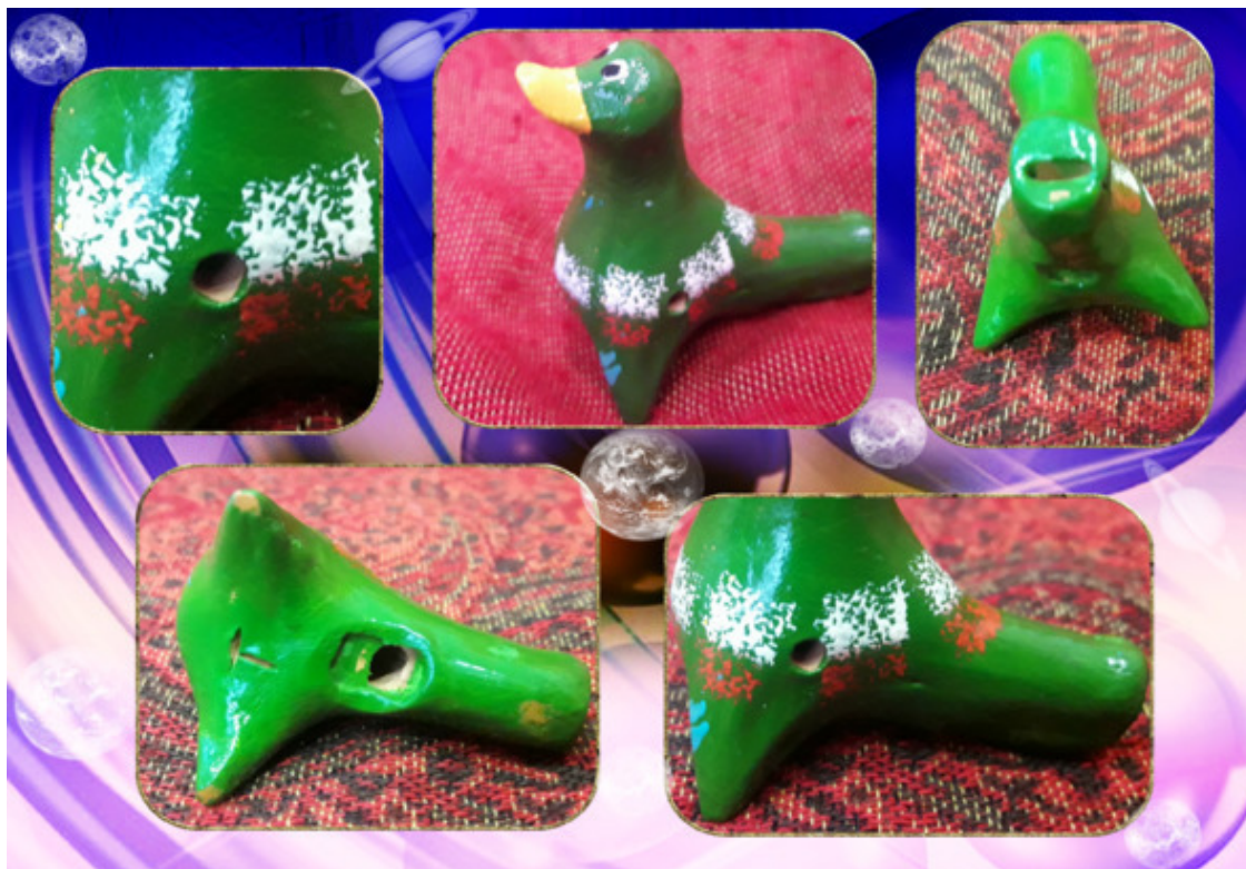
Устройство жбанниковской игрушки

Зря видимо говорят если свистеть дома, то денег не будет. Умельцы из д. Жбанниково считали, что тот, кто свистит в их дудку будет одарен различными благами. Теперь, когда есть в моем доме есть чудо-дудочка, можно свистеть сколько душе угодно!