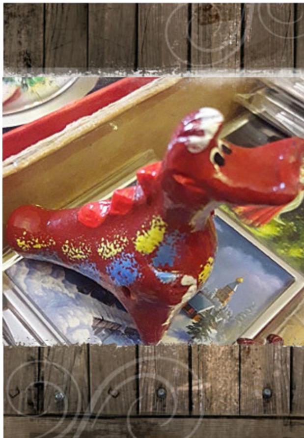
Свистулька- корова, приносящая здоровье в семью.