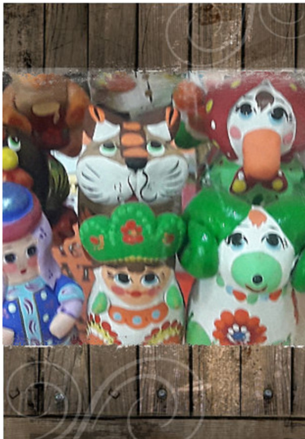
Разнообразие цвета и форм современной жбанниковской игрушки