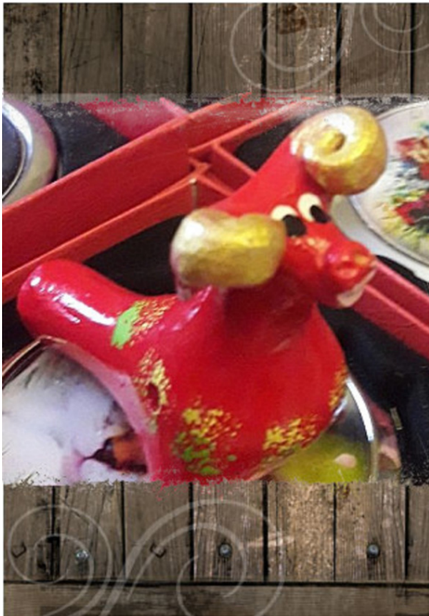
Огненный барашек с золотыми рогами.