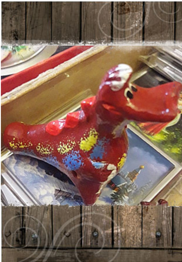
Свистулька- корова, приносящая здоровье в семью.