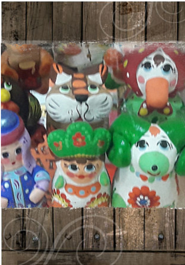
Разнообразие цвета и форм современной жбанниковской игрушки