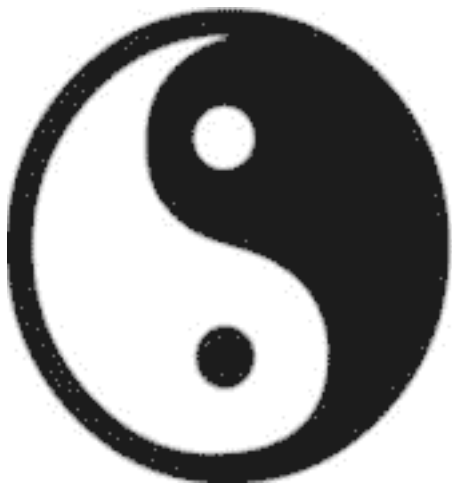
Диаграмма Тай-цзи, изображающая неразрывное единство Ян и Инь

В отличие от 4 стихий, на которые делились знаки Зодиака (земля, огонь, вода, воздух), китайские священные животные делились на 5 стихий – (металл, вода, огонь, дерево, земля).