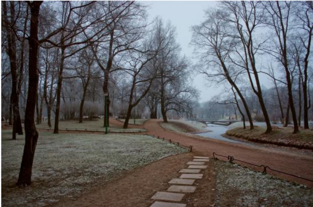
Ноябрь в Таврическом саду

Вновь дождь льёт в ночи. Во всех дворах шуршит, шумит, стучит. Вновь сон пропал. Туман под утро пал. Весь город спал.