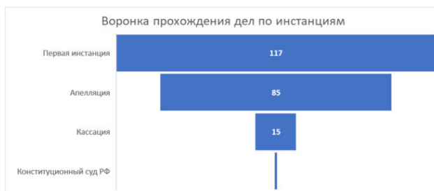
Диаграмма 2. Воронка прохождения дел по инстанциям

Более половины всех рассмотренных дел приходится на первую инстанцию, основная масса решений принята мировыми судьями.