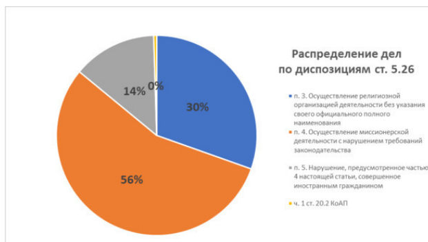
Диаграмма 3. Распределение дел по диспозициям ст. 5.26

Большая часть процессов касается пункта 4 ст. 5.26 КоАП – осуществление миссионерской деятельности с нарушением требований законодательства – 56% всех дел.