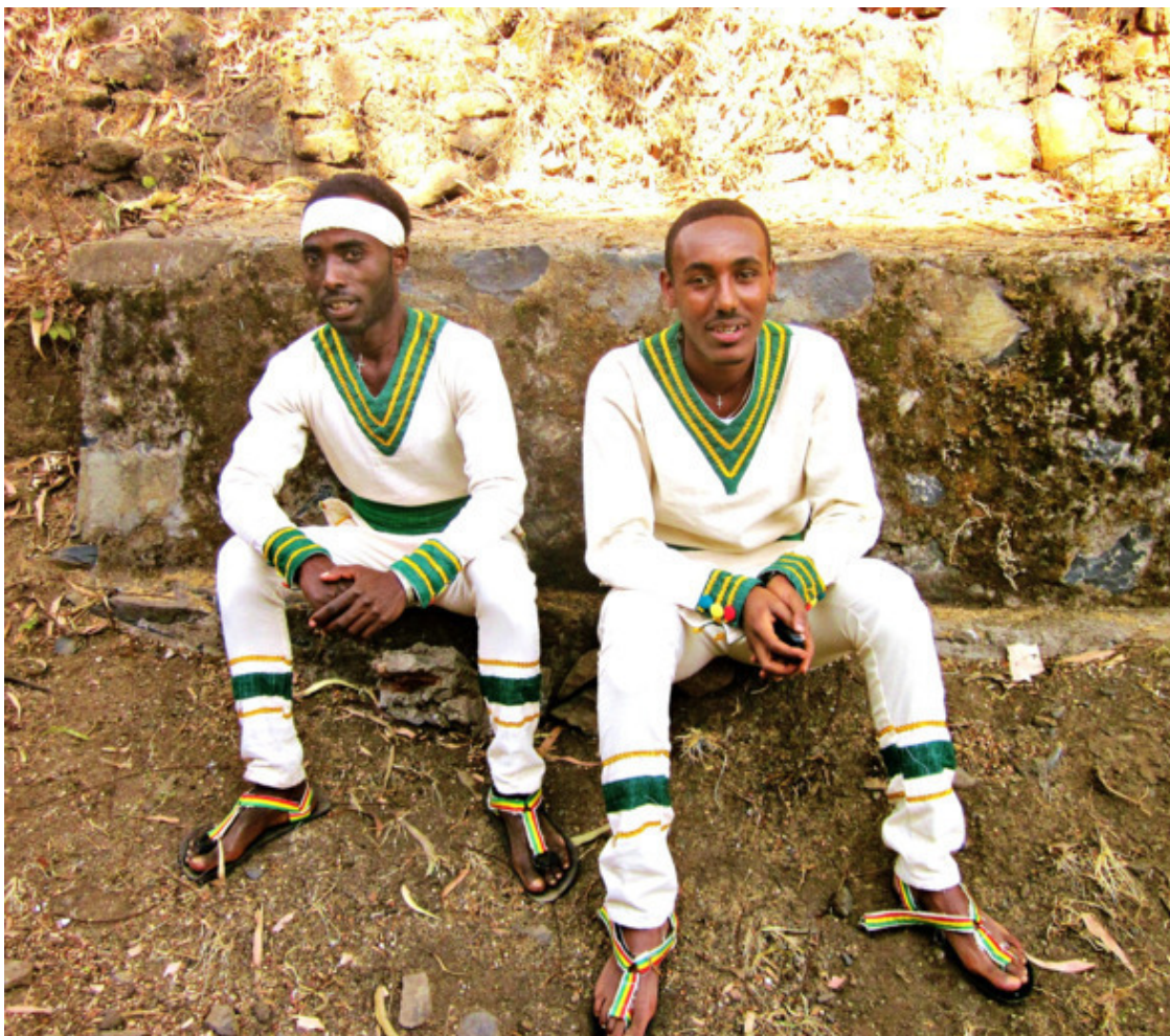
Традиционная одежда в Эфиопии

При первом взгляде на страну в глаза бросается внешность эфиопов. Не то, во что они одеты – в грязное или чистое – это в Африке не принципиально, а то, что лица у них благородные, красивые и даже одухотворённые. Тонкие черты лица притягивали взгляд, прекрасные глаза, глубокие и блестящие, вызывали восторг. Резкое отличие от остальных народов Африки налицо. Нет в их облике «широконосости» и «пучеглазости», скорее присущ европейский тип лица.