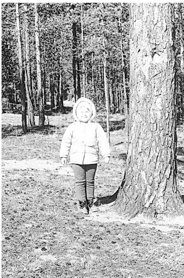
Кроме молодой сосновой поросли встречалось немало степенных, покрытых толстой корой, древесных старожилков.