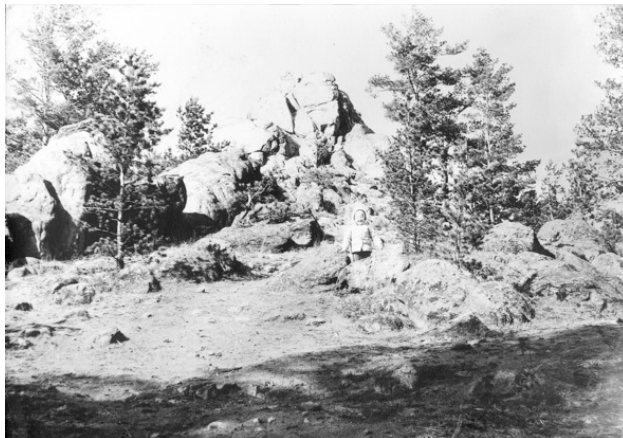
На фоне одного из скалистых нагромождений.