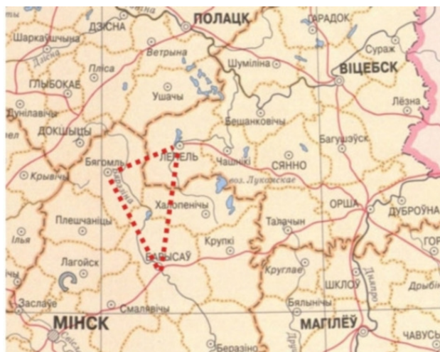
Северо-восточная часть Минской области на довоенной карте

События, ставшие предметом нашего изучения, разворачивались с середины лета 1942 по май 1943 года в небольшом по площади уголке Беларуси на северо-востоке Минской области. Его границы приблизительно ограничиваются треугольником Борисов – Бегомль – Лепель. Западная сторона этого треугольника проходит по реке Березине (точнее, лежит чуть западнее реки), две другие ограничены дорогами: шоссе Бегомль – Лепель (северная сторона) и большаком Лепель – Борисов (восточная) 8 .