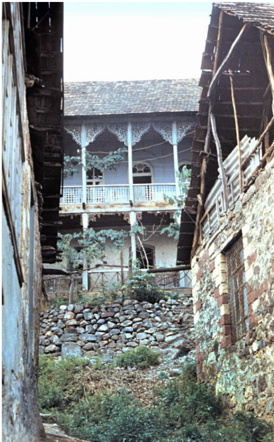
Дом священника Терунц-тон.