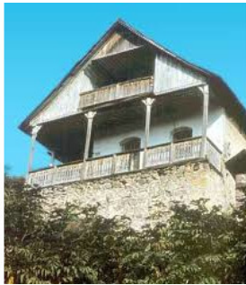
Дом семьи Епископосян.

Сам дом был какой-то пожилой, из «раньшего времени», как говаривал старина Паниковский, но, несмотря на относительную ветхость, выглядел элегантно и как-то удивительно натурально – словно благородный представитель обедневшего рода в поношенной одежде со следами бывшего благополучия, случайно затесавшийся в толпу напыщенных нуворишей. Первое ощущение досады сменилось симпатией к его неброскому очарованию антикварной старины, которую бронзовой чеканке придаёт патина.