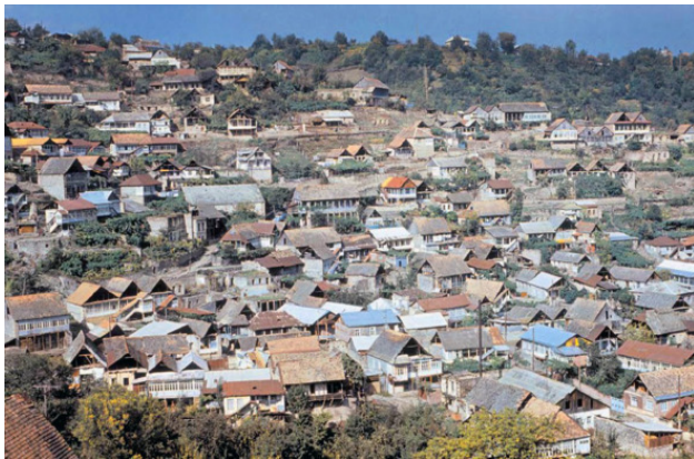
Панорама Геташена до войны.