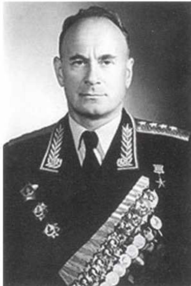
Председатель Правления Государственного банка СССР – ПОПОВ Василий Федорович.