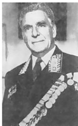
Министр совхозов СССР – КОЗЛОВ Алексей Иванович.