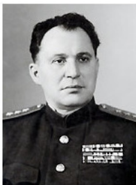
Министр сельского хозяйства СССР – БЕНЕДИКТОВ Иван Александрович.