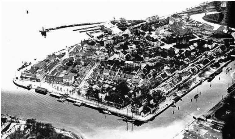
Город Балтийск на старом фото.

Но куда как важнее официальных были неофициальные и мало кому доступные сведения, тем не менее хорошо известные человеку, решившему порыбачить на вечерней зорьке.