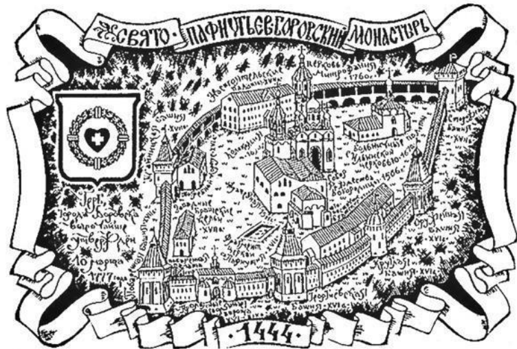
Черников. Схема Боровско-Пафнутьевского монастыря.