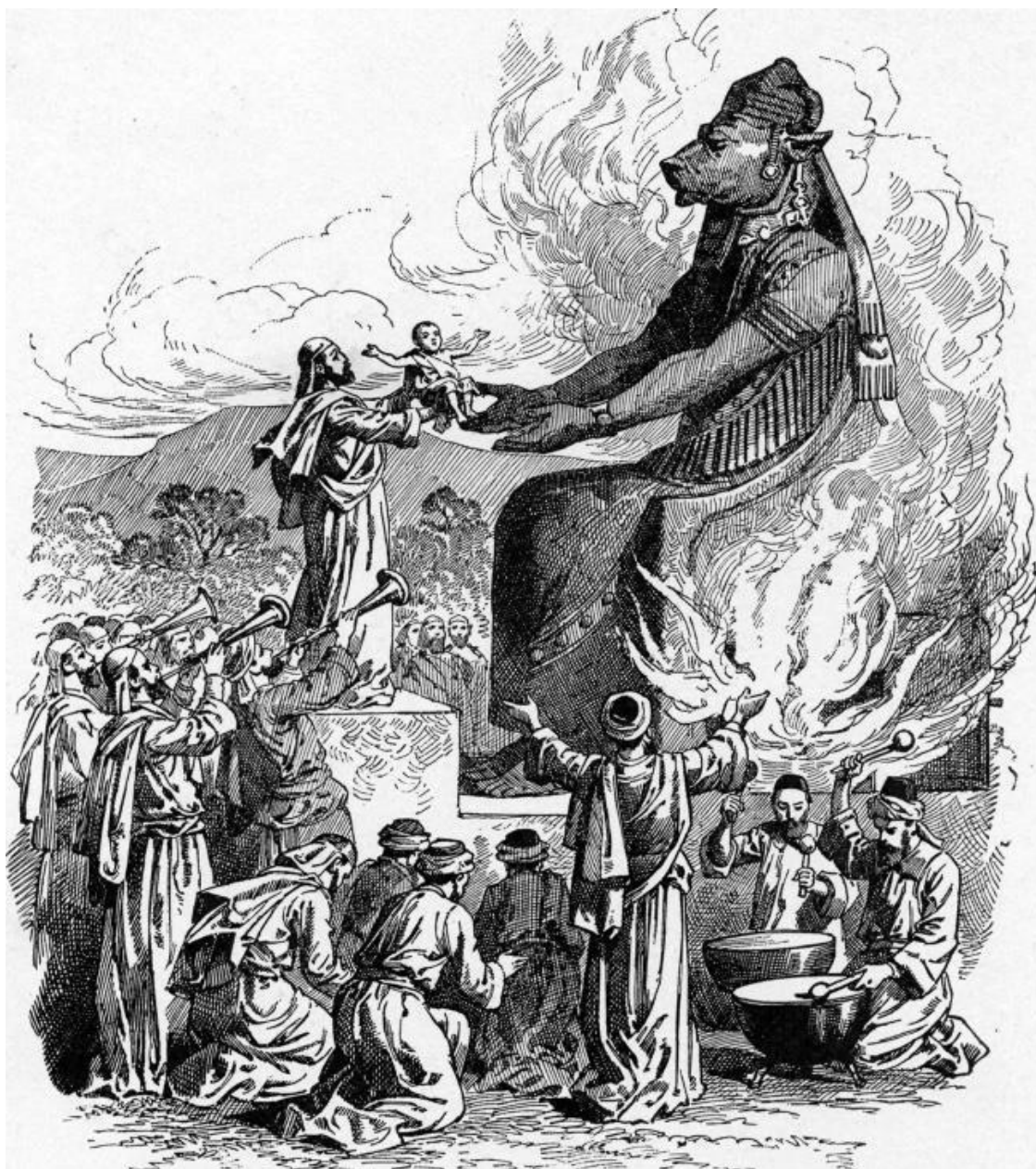
Принесение жертвы Ваалу (Молоху)

Матери младенцев были обязаны не только присутствовать на страшном торжестве, но и воздерживаться от слез и рыданий, потому что иначе они не только лишились бы почета и всенародной чести, но могли даже навлечь гнев оскорбленного божества на весь народ. Тут же, на месте жертвоприношения, находился помост, сцена, где громко стучали в барабаны, чтобы заглушить жуткие крики погибающих в огне детей. Трудно представить себе, каких таких благ могли ожидать родители, приносившие в жертву кровожадному идолу своего ребенка, желавшие подобным образом заручиться поддержкой Молоха.