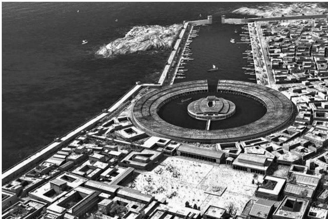
Порт Карфагена в начале мировой истории Финикийского государства

В русском языке словом «Тунис» обозначаются одновременно и страна, и столица, что создает некоторую путаницу. Зато в английском и французском языках слово «Tunis» обозначает только город, а страна называется «Tunisia». Доподлинно не известно, откуда произошло название страны. Возможно, оно произошло от корня «тнс», обозначающего «лагерь». Вторая версия позволяет считать, что название произошло от имени богини Тунит, которой поклонялись в Карфагене.