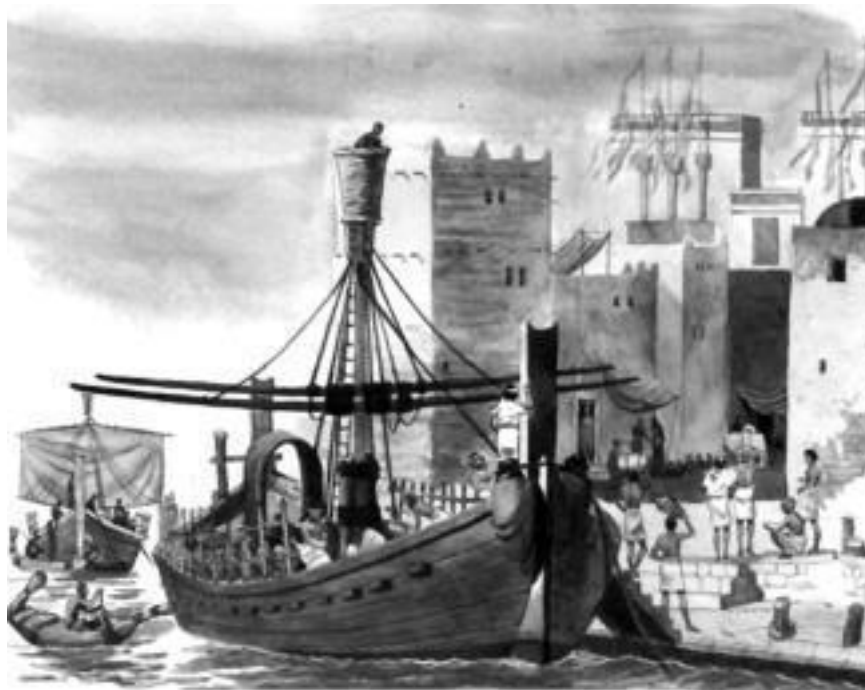
Финикийцы обогащались за счет своих колоний

Самая успешная колония, затмившая метрополию по богатству, находилась именно тут, на территории Туниса, столицей которой являлся Карфаген (Картаж). За 500 лет он стал политическим центром всех финикийских колоний в западной части Средиземноморья. Карфаген подчинил себе часть Сицилии, Сардинию, Корсику, часть Испании. Он стал крупнейшей морской державой с боевым флотом численностью более 300 кораблей.