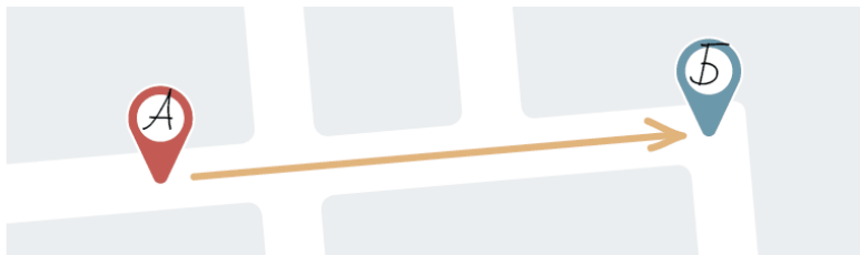
Рис. 1. Стратегия – это путь

Ясное понимание этого пути и есть стратегия.