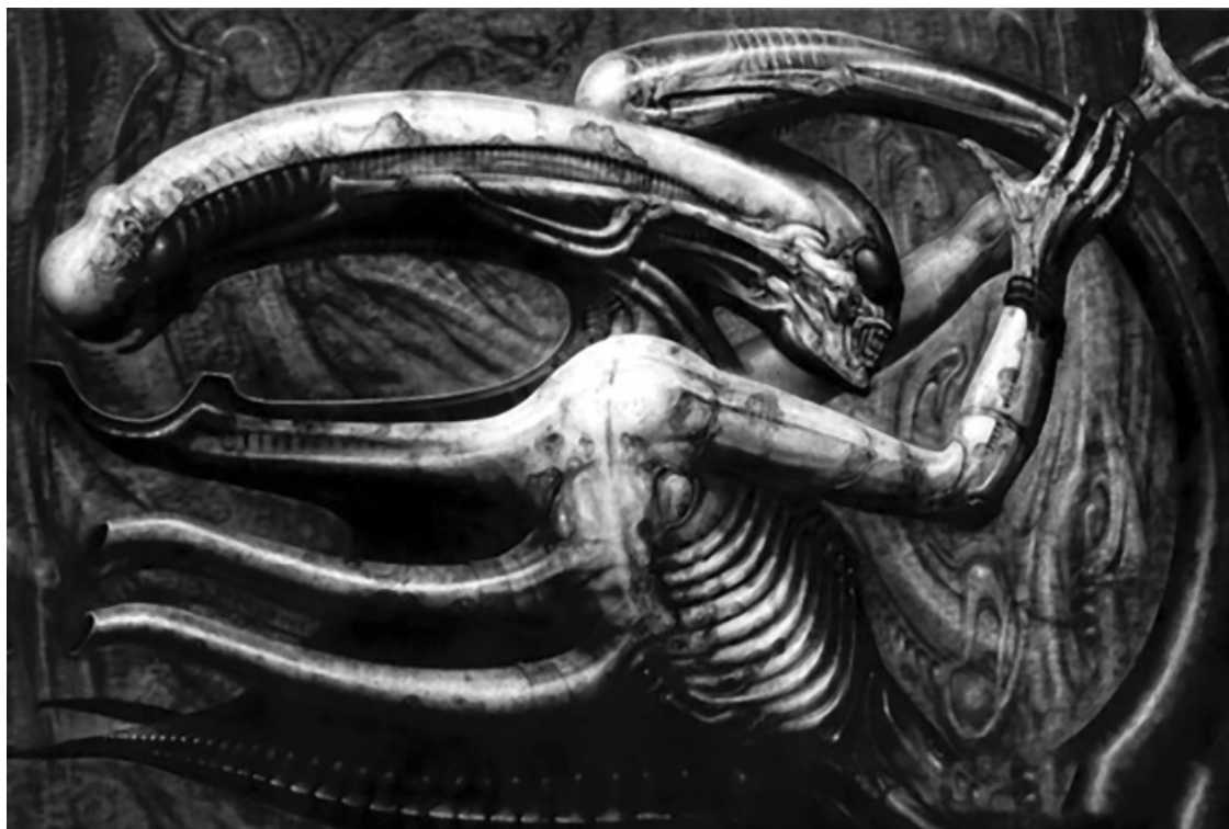
Ганс Рудольф Гигер. Necronom IV

Приехав в 1794 году в Финистер, Камбри отмечает: «Как здесь полагают, в полночь мертвецы поднимают веки. Никто не осмелится в округе мести пол ночью. Считается, что этим выметают из дома счастье, что ночью усопшие ходят по дому и что метлой их можно задеть и прогнать». Бретань, с точки зрения изучения места привидений в прошлой цивилизации, представляет большой интерес. «Не успели вбить последний гвоздь в крышку гроба умершего, как его уже видели стоящим около изгороди своего дома», – пишет Браз в «Легенде о смерти» и далее уточняет: «Усопший сохраняет свою материальную форму, внешность, характер, а также повседневную одежду. Раньше в этой провинции считалось, что днем земля принадлежит живым, а ночью мертвым. Кроме того, в Бретани верили, что усопшие составляют особое сообщество, носившее имя “Анаон”, где множественность означает коллективное единство. Его члены пребывают на кладбище, но под покровом ночи они возвращаются на место своего земного обитания. Именно поэтому нельзя подметать пол ночью. Души умерших собираются три раза в год: под Новый год, вечером на Святого Иоанна и вечером праздника всех Святых – в эти дни можно видеть, как процессии привидений направляются к месту сбора. Особая роль отводилась “Анку” – последнему умершему в этом году человеку, который весь следующий год был “жнецом” и с косою смерти за плечами собирал свой жуткий урожай, увозя его на скрипящей повозке».