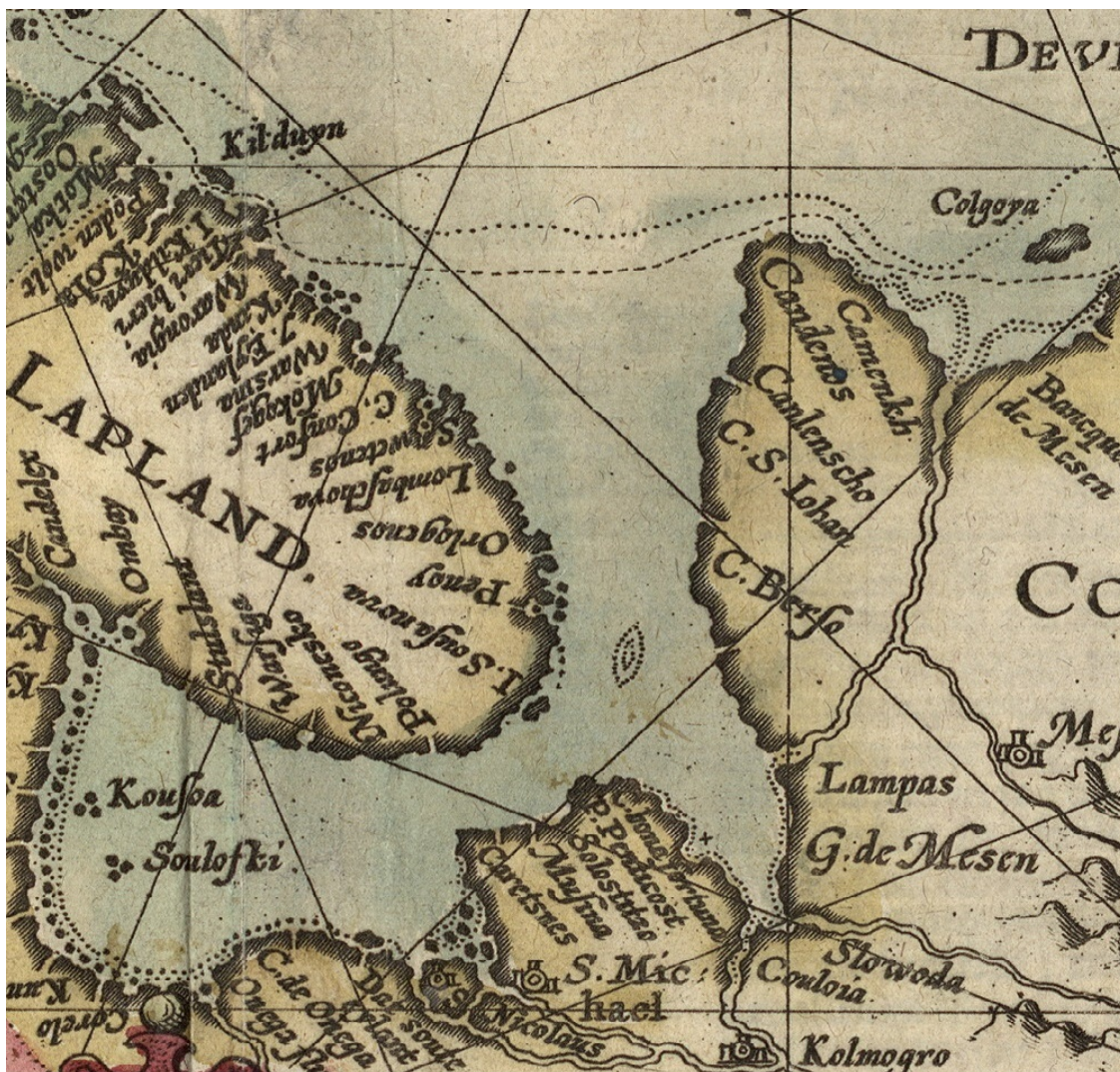
Канин на карте Баренца. 1598 год

Вильгельм Баренц (1550 – 1597 гг.) – голландский мореплаватель и исследователь. Руководитель трёх арктических экспедиций, целью которых был поиск северного морского пути в Ост-Индию. Трагически погиб во время последней из них в районе Новой Земли.