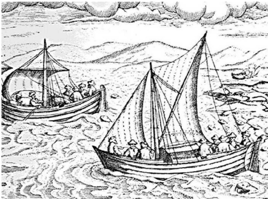
На карбасах по морю

Доподлинно известно, что в двенадцатом веке были уже поселения русских на южном берегу Белого моря и им были знакомы его западные и северные берега. Северные мореходы, плавая на построенных в поморских деревнях карбасах, за рыбой и морским зверем по Белому и Баренцеву морям, вольно или невольно сталкивались с Канинским побережьем. Так постепенно происходило познание поморами этой удивительной земли, знакомство с её постоянными обитателями.