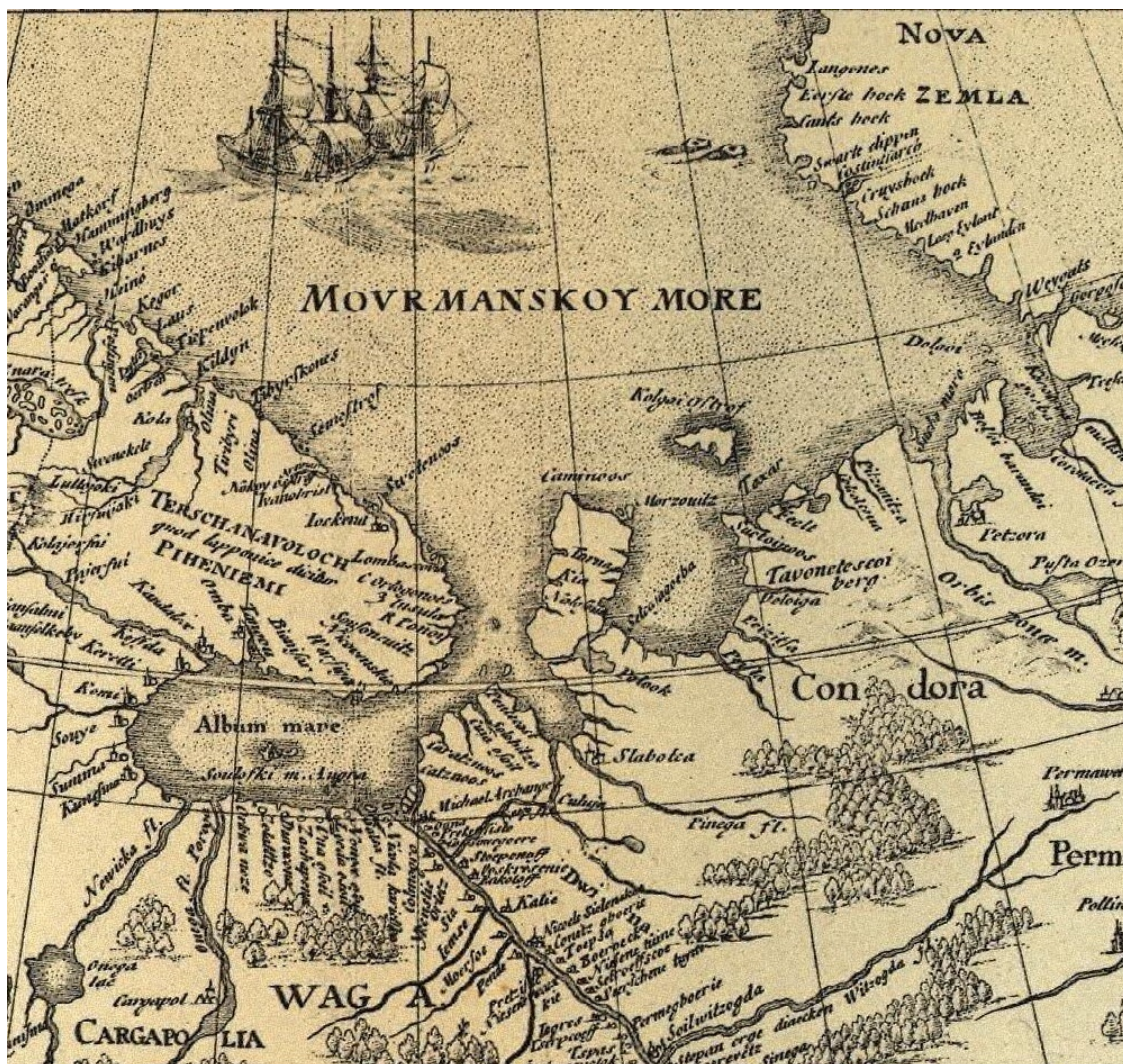
Канин на карте Гесселя Герарда. 1612 год

Гессель Герард (Герритс). Голландский гравер, картограф и издатель. Несмотря на сильную конкуренцию, он, по мнению некоторых историков, несомненно, главный голландский картограф начала 17-го века.