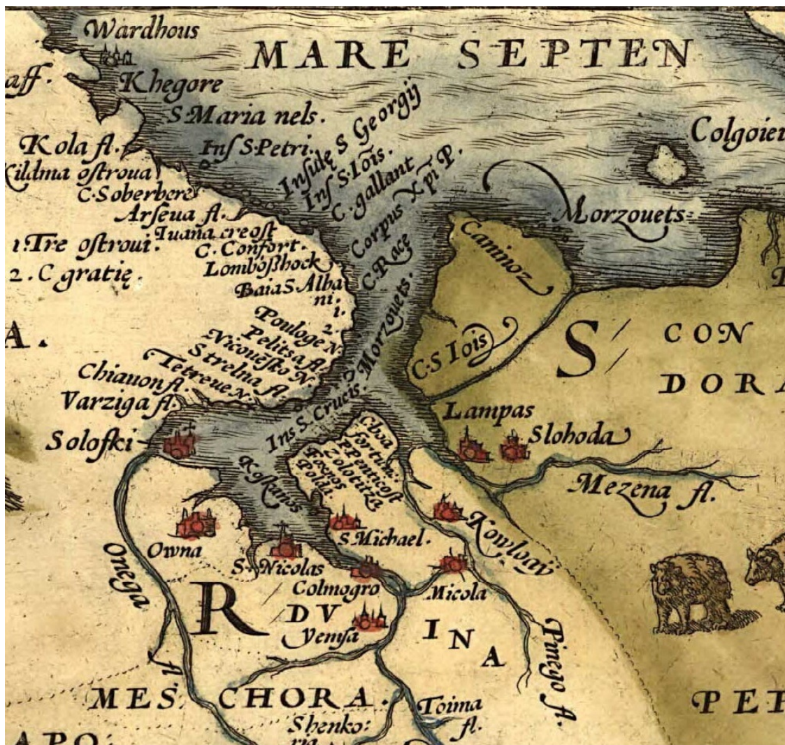
Канин на карте Энтони Дженкинсона. 1562 год

Энтони Дженкинсон (1529 – 1610 гг.) – английский дипломат и путешественник, первый полномочный посол Англии в России. В 1562 году появилась его карта России, где впервые изображен и Канин.