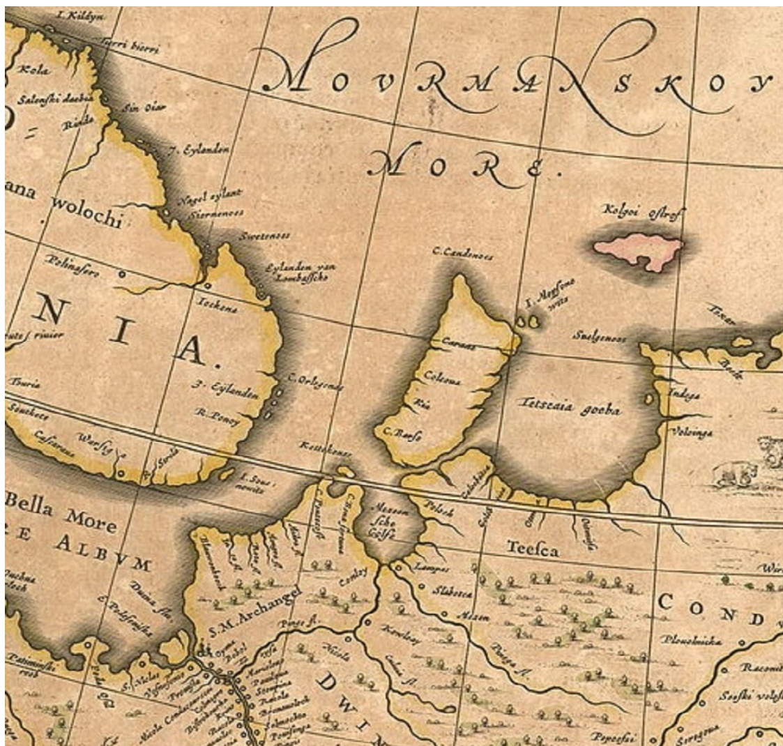
Канин на карте начала XVII века

Иоганн ван Кёлен (1654 – 1715 гг.) – голландский картограф XVII века, опубликовал известный навигационный атлас Zee-Atlas (морской атлас) и справочник Zee-Fakkel (морской факел).