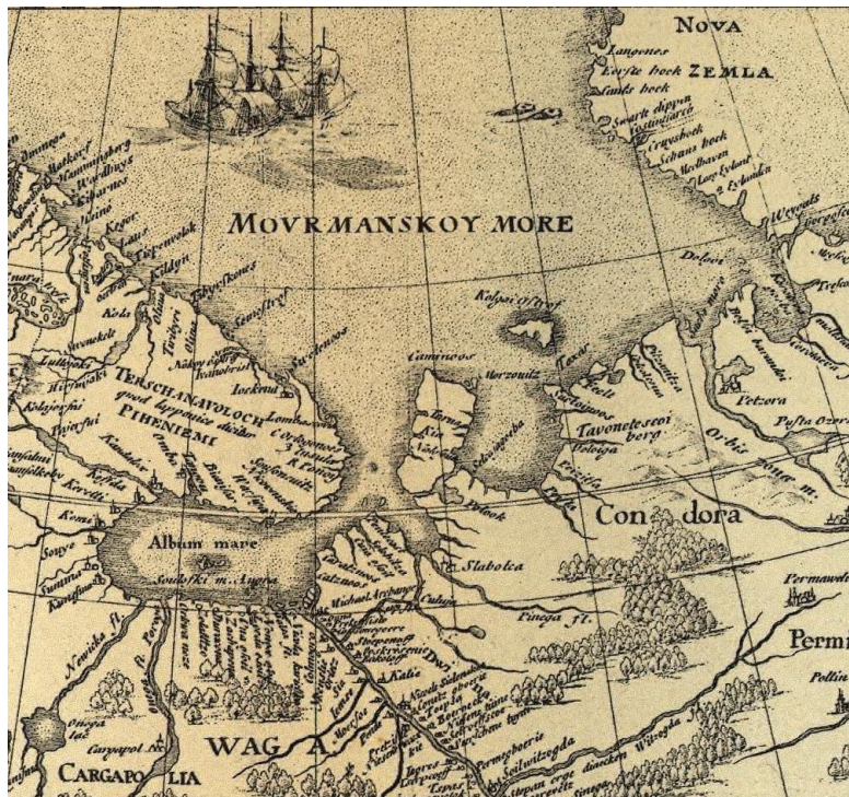
Канин на карте Гесселя Герарда.1612 год

Карта голландца же Гесселя Герарда (известного также под именем Герритса), выпущенная в двух очень скоро последовавших друг за другом изданиях в 1613 и 1614 г. Основой этой последней карты служил один из более поздних вариантов карты Большого Чертежа, известный как „карта царевича Федора Борисовича Годунова”. Печаталась она загра-