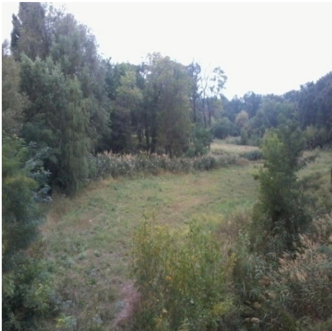
Москатова, 27 Дубки летом

С другой стороны, от правой половины Дзержинского по улице Сергея Лазо, вплоть до улицы Московской, выстроены в конце Советской власти многоэтажные дома от 5 до 14 этажей. Квартыры здесь среднегабаритные, хорошего качества, единственный нюанс – в 14-этажках на кухнях стоят электроплиты. Цены на эти квартиры более высокие, чем цены на квартиры в «хрущевках». Между Сергея Лазо и Дзержинского остался достаточно большой участок «частного сектора». Частные дома тут тоже самые разные – абсолютных развалюх уже нет, район всегда был достаточно престижным, и, как и во всем городе – двух-трехэтажные особняки соседствуют с простыми «таганрогскими» домами построек 50-90-х годов (саман, обложенный кирпичом). Начали появляться в этом районе и современные малоэтажные «элитные» дома со своими закрытыми «двориками» и охраняемой территорией. Кстати об условном районировании. Многие считают улицу Сергея Лазо и частный сектор, примыкающий к ней, относящимися к району « Нового вокзала ». Мне представляется это абсолютно не критичным, потому что расстояния отсюда и до « Нового вокзала » и до Дзержинского практически одинаковы.