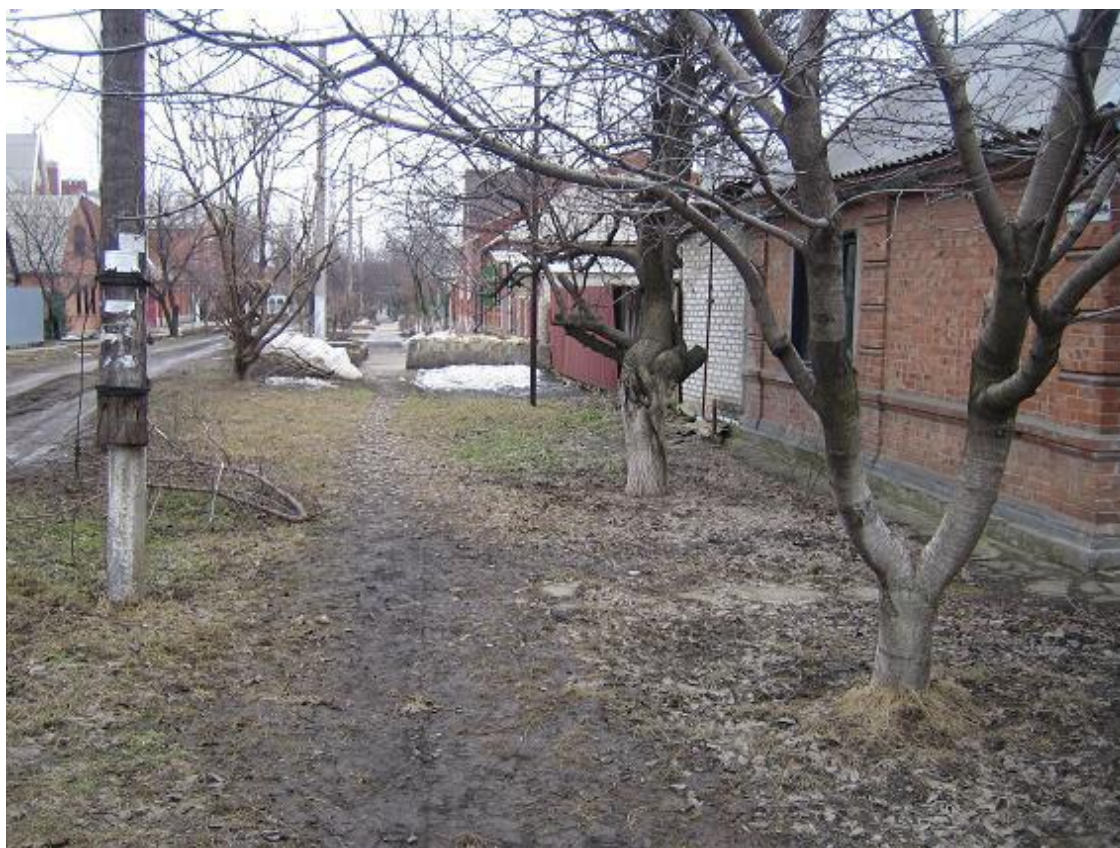
Артиллерийские переулки. Вид сверху Там же. Типичный переулок

Единственный негативный нюанс, о котором, я считаю, необходимо упомянуть – это наличие рядом противотуберкулезного диспансера.