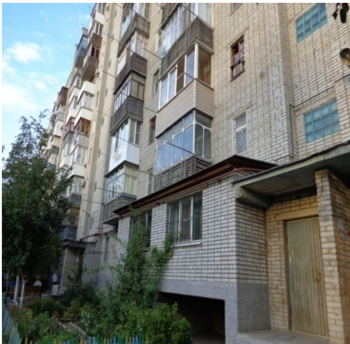
П.Тольятти. Типовая хрущевка Морозова, 27

Вернемся к «Новому вокзалу» и будем двигаться по левой стороне Дзержинского до ее пересечения сначала с улицей Толбухина, а затем и до пересечения с улицами Пальмиро Тольятти и Морозова, также захватывая в свое поле зрения участок от Дзержинского до улицы Зои Космодемьянской. С этой стороны многоэтажных новостроек вы тоже практически не встретите, за исключением не так давно построенных кирпичной (достаточно неплохой) многоэтажки на улице Зои Космодемьянской и домов на Тольятти, 3. Непосредственно на Дзержинского здесь выходят 3-х, 4-х и 5-этажные «хрущевки» более ранних лет постройки, чем по правой стороне улицы. Есть здесь и квартиры в домах «сталинского» типа. Между левой стороной Дзержинского и улицей Зои Космодемьянской (улицы Комитетская, Ивана Голубца, Кирова, Черняховского, Толбухина) «спрятался» еще один уголок старого «частного сектора» с преобладанием обыкновенных таганрогских одноэтажных домов, и по той же Зои Космодемьянской, вдоль трамвайной линии, также стоят уже много лет пятиэтажные кирпичные «хрущевки» вплоть до Толбухина, а на ней непосредственно выстроен новый жилой дом. Чем здесь хорошо? С одной стороны – достаточно тихо и спокойно (получается как бы «внутренний райончик», закрытый от загруженных автодорог), с другой – все рядом (и вокзал, и рынок, и школы).