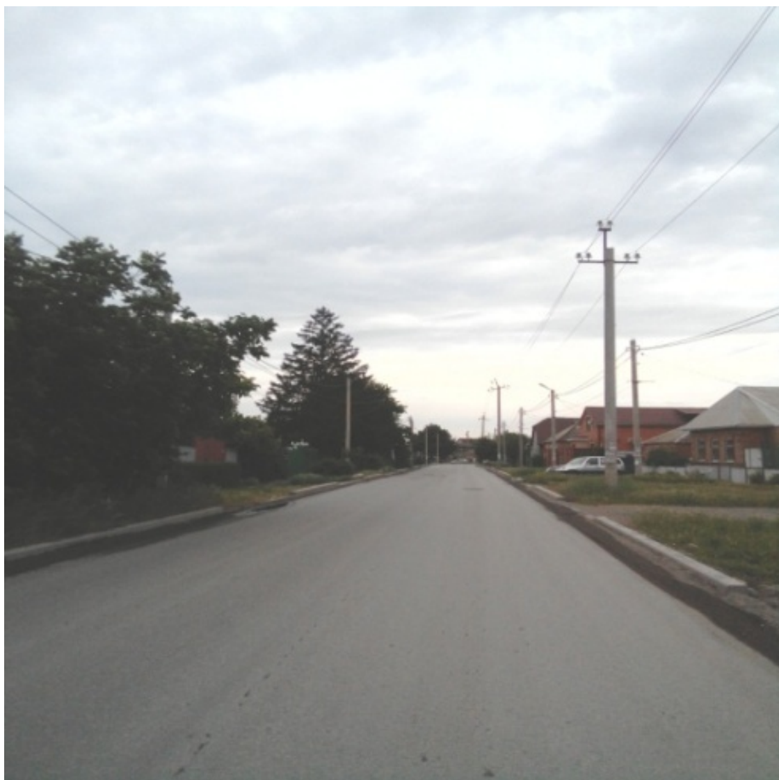
Один из частных домов в Михайловке Михайловка. Улица Михайловская

С одной стороны «Михайловка» ограничена железной дорогой, с другой – морем, и по улице Сигиды переходит в дачные участки. И вот тут очень важно учесть при покупке, что Вы покупаете – дом в самой Михайловке (которая нынче – часть Таганрога) или дачу, в которой нет, как минимум, городской прописки.