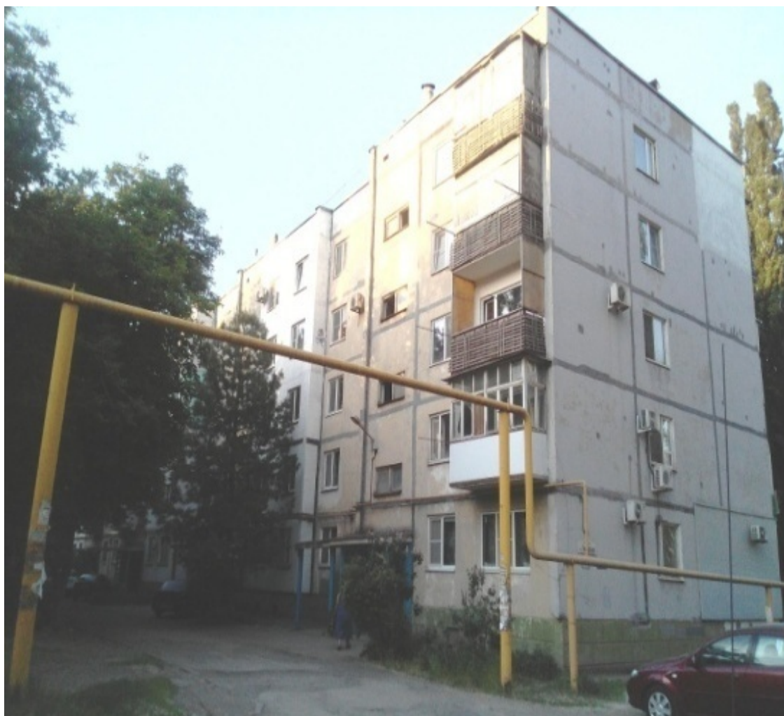
Парковый, 8 Заводская, 8-2

В «правой половине» описываемого в этом разделе «микрорайончика» находятся Артиллерийские переулки с 14-го по 19-ый, улицы 1-ая и 2-ая Школьные, Киевская и Московская.