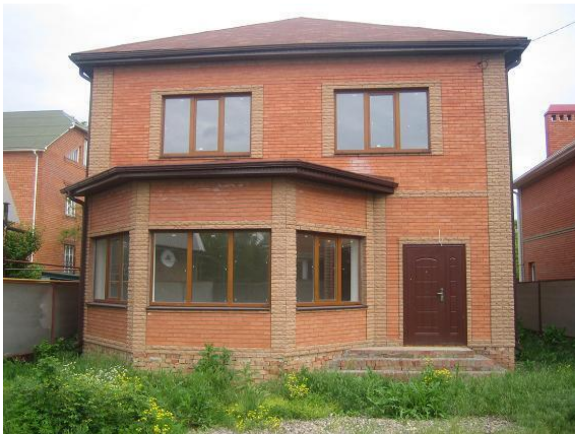
«Свежая» панелька на Каркасном Один из новых частных домов на Артиллерийских переулках

Из «старых» застроек (то есть советских времен) здесь можно увидеть как пятиэтажные панельные дома, так и кирпичные девятиэтажки. Абсолютно новые дома в этом месте можно пересчитать «на пальцах». Это 9-ти этажные панельные дома застройщика «КПД» и 14-ти этажный монолитный дом по адресу ул.Ленина, 229б. Также можно упомянуть 9-этажный кирпичный элитный дом на Ленина, 199.