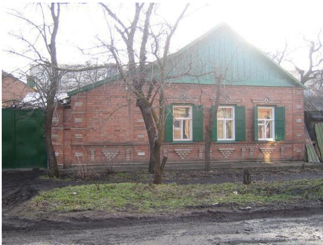
Улица Ленина. Старые жакты А на Колодезной тот же стандарт

По левой стороне улицы Ленина, начиная практически от Дзержинского (а если быть абсолютно точным, то от переулка Вокзального) также идет частный сектор. Он располагается между улицами Ленина и Фрунзе, идущими параллельно друг другу, и тянется вплоть до переулка Ленинского (практически до остановки электричек «завод «Красный Котельщик»). Здесь есть кое-где располагающиеся точно двухэтажные «жактовские» дома и на улице Фрунзе – достаточно «свежие» несколько кирпичных многоэтажек, считающихся достаточно «элитными». С этой стороны улицы Ленина находятся улица Максима Горького, переулки Вокзальный, Крымский, Кавалерийский, Казачий, Бульварный, Ленинский и улица Тельмана.