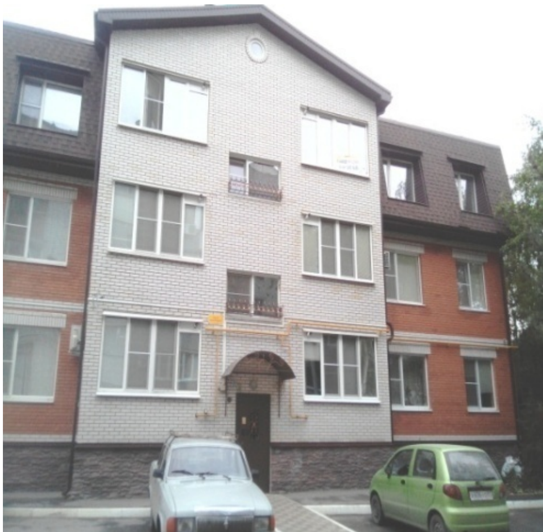
Ул. Софьи Перовской. Частные дома. Михайловская, 124. Новостройка

А я жил в Таганроге, в городе, на Шаумяна. Было, конечно, очень интересно, когда пацаны из моего класса становились на учет в военкомате Неклиновского района, а я ездил на улицу Свердлова (ныне Александровскую) и призывался в Советскую армию из горвоенкомата. Долгое время Таганрог плавно перетекал в «Михайловку» , хотя это были два различных поселения, однако естественный ход событий в 90-е годы XX столетия превратил ее в один из районов самого города.