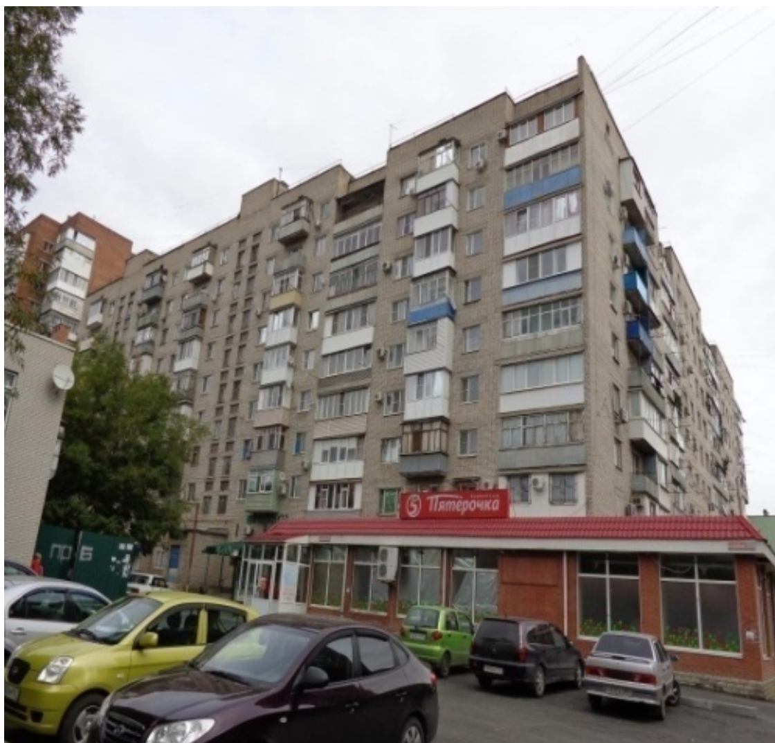
Лазо, 7-2 Лазо со стороны «Березки»

Причем мы будем рассматривать отдельно правые и левые стороны этой улицы, а правую сторону разделим еще на две части – до роши « Дубки » и после нее. Возьмем сначала участок, ограниченный улицами Воскова, Московской, рошей « Дубки » и правой стороной улицы Дзержинского. Непосредственно по этой стороне улицы, вдоль дороги, вплоть до роши « Дубки » расположены пятиэтажные «хрущевки». Это достаточно качественные дома, неаварийные, без трещин и особых проблем. В цокольных помещениях и первых этажах этих домов, тех этажах, которые выходят непосредственно на Дзержинского, расположены разнообразные магазины, офисы, банки, стоматологическая поликлиника. Такие же «хрущевки» выстроились перпендикулярно Дзержинского перед рошей « Дубки ». Достаточно спокойные (на сегодняшний день) и чистые дворы, рядом две средние школы, магазины, инфраструктура развита весьма высоко. Дома, которые находятся непосредственно на границе « Дубков » имеют как свои плюсы, так и минусы. Плюсы – практически всегда чистый воздух, тишина, по утрам летом можно даже услышать соловья. Минусы – оставшаяся в памяти многих таганрожцев старшего поколения достаточно криминогенная обстановка « Дубков » советских времен (хотя нынче особых страшилок я о « Дубках » не слышал).