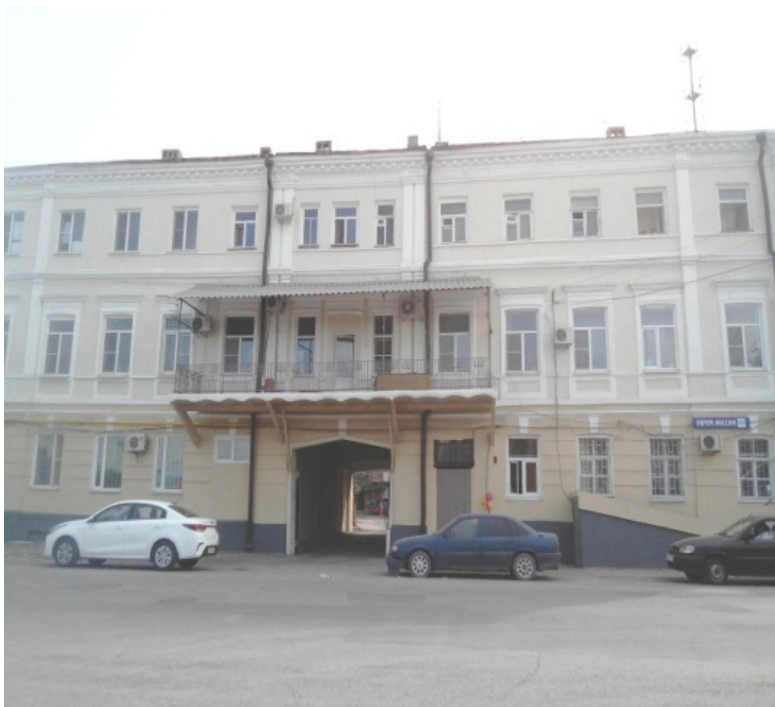
Вечером у «Старого вокзала» У «Старого вокзала» Улица Октябрьская

Внизу район «Старого Вокзала» разумно ограничить улицей Ленина, справа улицей Максима Горького, слева переулком Смирновским и вверху – улицей Октябрьской. Что здесь находится? Во-первых, это сам «Старый Вокзал» , то есть пригородный железнодорожный вокзал (отсюда отправляются электрички в Ростов-на-Дону и Успенскую) и междугородный автовокзал, с которого, помимо междугородных автобусов, каждые 10-15 минут отправляются маршрутки Таганрог-Ростов-на-Дону. Также отсюда ходят автобусы на достаточно дальние от Таганрога деревни и села – например в Матвеев Курган, Куйбышево. Напротив «Старого Вокзала» расположен вещевой рынок «Радуга», на улице Октябрьской – таганрогский головной офис большого банка. Тут проходит пересечение практически всех маршрутов таганрогского трамвая (это маршруты №№ 1, 2, 3, 4, 5, 7, 8, 9, 1/3). Здесь же кафе, ресторанчики, магазины, аптеки.