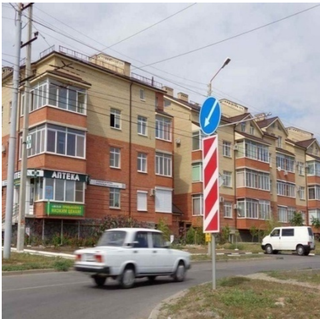
Торгово-развлекательный центр «Арбуз» ПМК. Бакинская, 64-2.

(Входят также в микрорайон « ПМК » улицы Лизы Чайкиной (часть), Инициативная (часть), Нижняя линия (часть), 1-й, 2-й, 3-й и 4-й Линейный проезды (часть), проезд Спасский и 3-я линия (часть), переулки 2-й и 3-й Новые.)