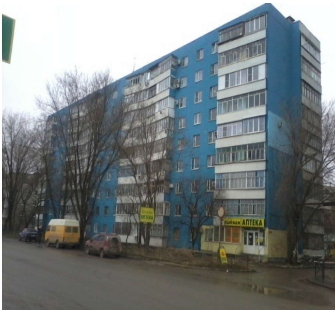
Сквер у Нового вокзала Москатова, 25

Естественно, что вокруг транспортного узла должна быть развитая инфраструктура. Так оно и есть. С «Нового вокзала» вы можете добраться в любую точку Таганрога на нескольких видах общественного транспорта. Наибольшей популярностью, конечно, пользуются маршрутные такси (в просторечии «маршрутки»). Также здесь находятся конечные остановки нескольких троллейбусных и трамвайных маршрутов, а также автобусов большой вместимости. Для любителей комфорта – стоянка обыкновенных такси. При выходе из вокзала Вы увидите перед собой стоянку для автомашин, а за ней Привокзальную площадь.