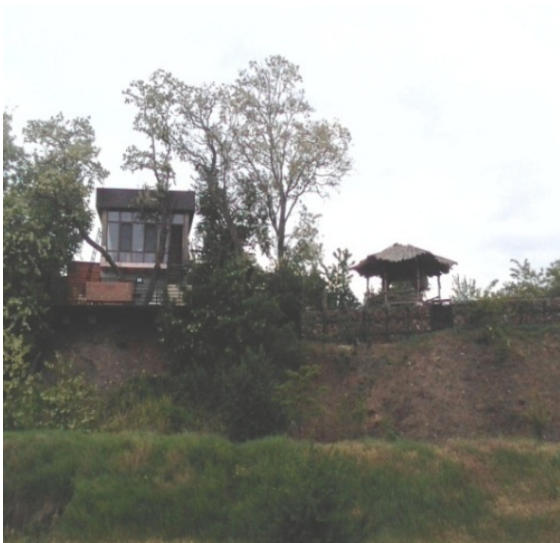
Бабушкина, 54-г. Семиэтажка 1992 г.п. Новые дома. Вид с моря

Он так и назывался – пляж «Новые дома» . Находился он в ведении Таганрогского металлургического завода и на нем всегда поддерживался порядок, был очень хороший песчаный выход в море, детская игровая площадка, волейбольная площадка. Был даже свой медпункт и что-то типа дежурного пункта милиции. К сожалению, сейчас это место заросло камышом, однако летом в частном секторе ежегодно сдаются очень много помещений для отдыхающих, а в районе «Тополька» и гостиницы «Приазовье» создана очень хорошая, современная набережная с неплохим пляжем. Из инфраструктуры можно упомянуть магазинчики, среднюю школу и детский сад. Здесь ходят маршрутки от «Нового вокзала» до «Центрального рынка» и от «Нового вокзала» до «Михайловки» .