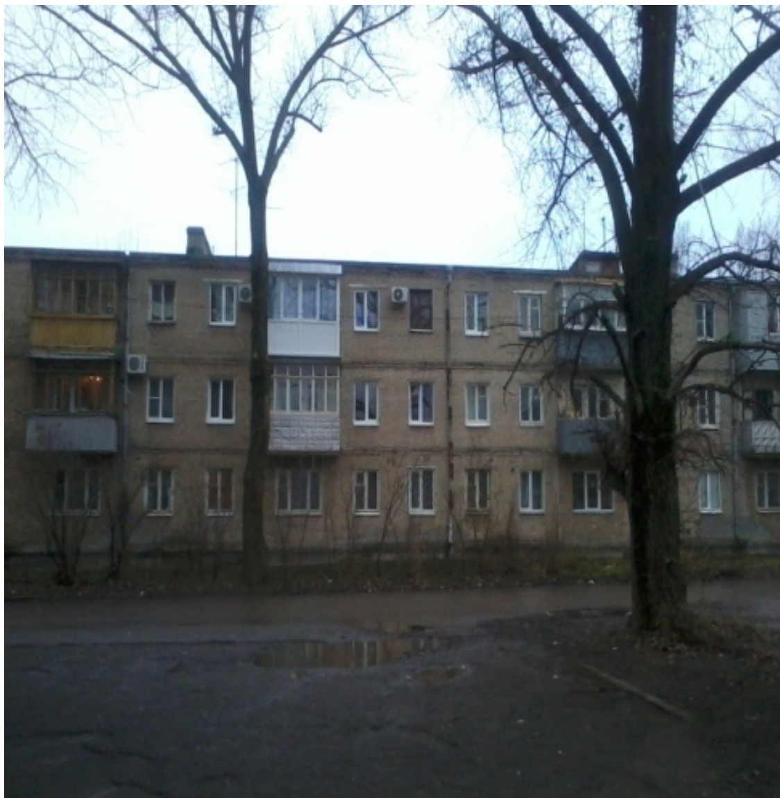
Шаумяна, 8 Шаумяна, 9

Заехав с Лизы Чайкиной на мост, справа мы увидим «Новый вокзал» (или, как пишут в справочниках РЖД – ж/д станцию «Таганрог-1») и множество многоэтажек вокруг него. Вдоль железной дороги в этом месте со стороны ул.Инициативной расположена небольшая лесополоса. Слева же от Бакинского моста мы увидим старый разрушенный мост, а за ним – бывший «Стахановский» городок. Вот о нем мы сейчас и поговорим. Начинается он единственным по настоящему «спальным» районом Таганрога. Этот «райончик» состоит из двух основных улиц – Урицкого и Шаумяна. На них расположены 3-4-5 этажные «хрущевки», построенные во времена развитого социализма, «выросшая» на излете этого социализма 16-ти этажка и парочка совсем новых малоэтажных многоквартирных домов на месте бывшего футбольного поля. Особой популярностью квартиры в этом «райончике» почему-то не пользуются, хотя до «Нового вокзала» идти 10 минут прогулочным шагом, есть здесь продуктовые магазины, детский сад, средняя школа №31.