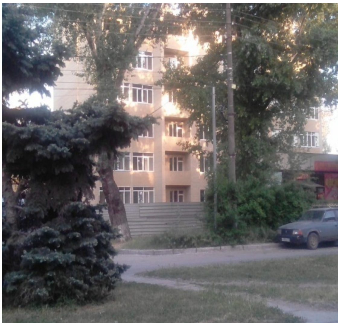
Улица Осипенко. «Хрущевки» С другой стороны-точечная застройка

Условные границы этого микрорайона можно провести по улицам Железнодорожной, Заводской, улице Осипенко, переулку Парковому, обратно по «Дзержинке» до улицы Выгонной и от Выгонной по Мало-Почтовой улицы снова до улицы Железнодорожной. Дома по правой руке (если ехать от «Нового вокзала») – это двухэтажные дома послевоенной постройки.