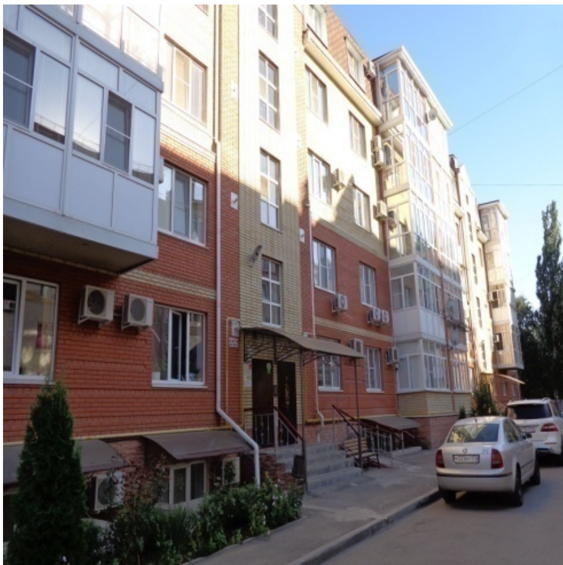
Зои Космодемьянской, 24 Тольятти, 3б. Новостройка

В этом «микрорайончике» (по Дзержинского, от Пальмиро Тольятти до переулка 14-го Артиллерийского) многоэтажные дома строились уже на «излете» Советской власти, поэтому здесь достаточно как 5-этажных «хрущевок», так и более «свежих» 9-этажек. На Дзержинского выходят дома, в первых этажах которых расположились самые разнообразные магазины и прочие заведения. Здесь и мебельный магазин, и аптеки, и одежда, и обувь, и компьютерный магазин, парикмахерские и так далее. Напротив этих магазинов – средняя школа. Это левая (от Дзержинского) сторона этого микрорайончика. Плюсы этой стороны (до Морозова) – есть все, что надо для современной жизни. Минусы? Для меня лично – слишком много «больших» домов (многоэтажек) на квадратный километр земли. Справа от улицы Дзержинского, начиная от Морозова и до переулка 14-го Артиллерийского расположен «частный сектор» (по правой стороне «Дзержинки» он тянется и дальше, вплоть до « Старого вокзала », но об этом чуть позже). Вправо от «Дзержинки» этот «частный сектор» тянется вплоть до завода «Красный Котельщик», еще одного градообразующего завода нашего города. Неплохое место, единственно здесь не очень популярны дома расположенные слишком близко к заводу «Красный котельщик» (ближе к улице Московской).