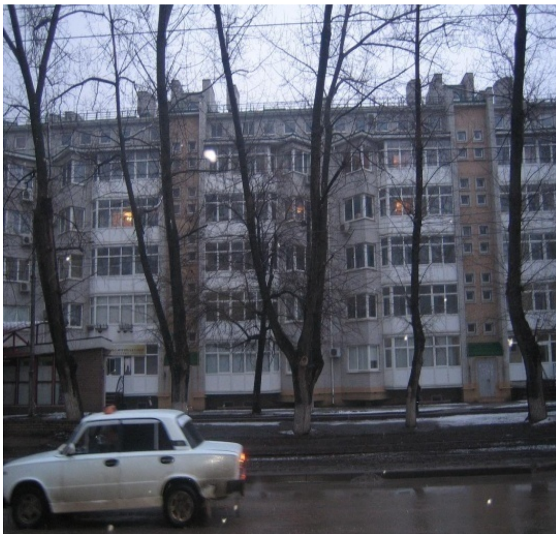
Дзержинского, 142-6. Вид со двора Он же, со стороны Дзержинского

В этом микрорайоне есть несомненные плюсы, привлекающие внимание многих покупателей жилья в Таганроге. Одна из самых развитых инфраструктур в городе. Дворец культуры, бассейн, теннисные корты, детские сады, школа, транспорт в любую точку города (весь ассортимент таганрогского транспорта – трамвай, троллейбус, автобусы, маршрутки). Доехать в центр города 5-10 минут, до «Нового вокзала» те же 5-10 минут (если не закрыт ж/д переезд металлургического завода), до микрорайонов «Русское поле» и «Простоквашино» – 15-20 минут. Минусы микрорайона – наверное, только в нижних этажах домов, выходящих непосредственно на улицу Дзержинского – выхлопные газы автомобилей, движущихся непрерывно с раннего утра до позднего вечера экологию не улучшают. Цены на жилье в данном микрорайоне в целом немного выше средних по Таганрогу.