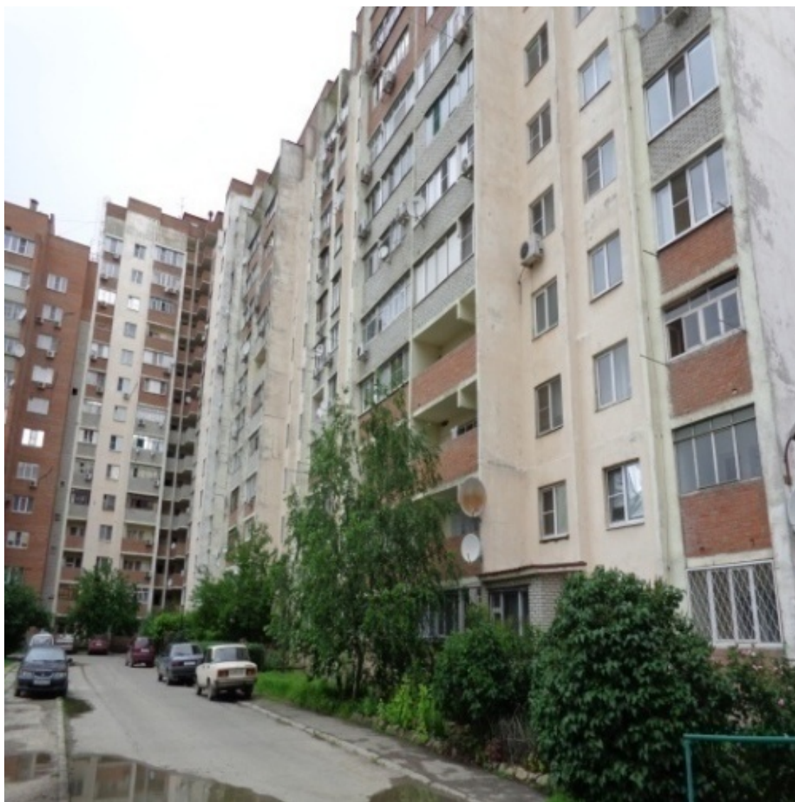
Фрунзе, 79-5 Высотки на 1-й Котельной

С тех пор и «прилипло» это название к этому микрорайону). По правой стороне улицы Ленина (по направлению от «Старого Вокзала» ) расположены трамвайные пути (маршруты №№3, 1/3), а сразу за ними располагается частный сектор вплоть до Дворца культуры "Фестивальный" (бывший ДК завода "Красный котельщик") и Дворца спорта того же завода.