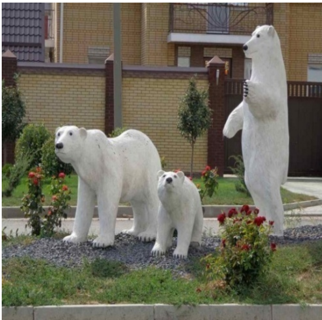
ПМК. Жилой комплекс «Три медведя» Там же.

Хотя на сегодняшний день для всего Таганрога проблемы общественного транспорта практически не существует – из любой точки города в любую можно добраться за 30-40 минут (максимум) на маршрутном такси (то есть «маршрутке») или за 15-20 минут на своем автомобиле или обыкновенном такси.