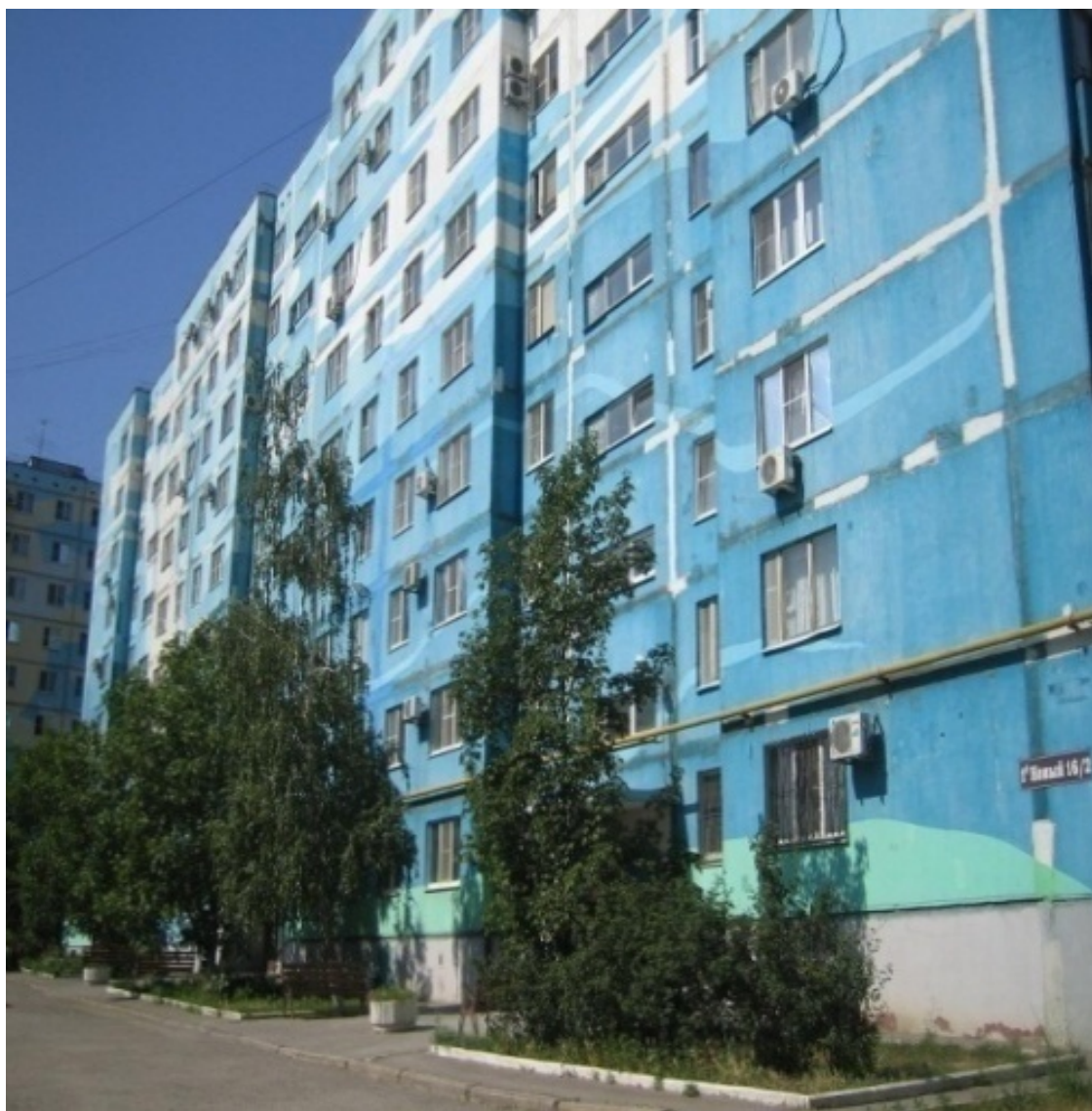
Вид на коттеджный городок. ПМК ПМК. Старые панельки. 1-й Новый, 16-2

То же самое относится к поликлиникам и развлекательным центрам (хотя эти, конечно, появятся быстрее прочего). Возникает закономерный вопрос – а есть ли смысл в покупке жилья здесь? Думаю, да, но далеко не для всех. Например, для тех, кто работает в Ростове-на-Дону и все равно каждый день на своей машине ездит туда и обратно – это сокращение времени поездки в среднем на 20-30 минут.