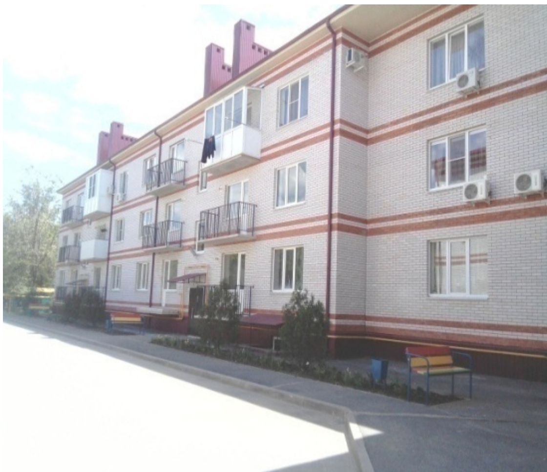
Улица Шаумяна, 20