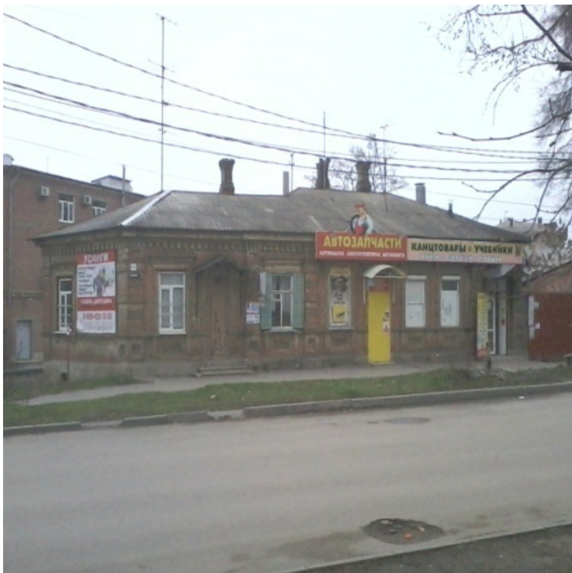
Улица Фрунзе у «Старого» вокзала. Жакты под коммерцию

Помимо уже упомянутых улиц, сюда относятся еще переулок Вокзальный и Площадь Восстания.