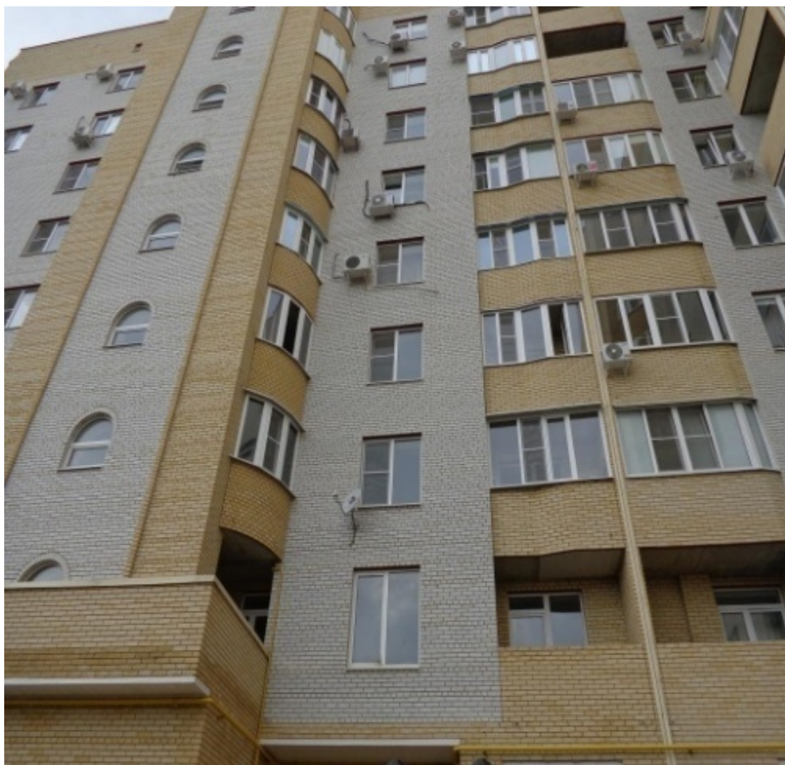
15-й Новый (Очистная). Новостройки Маршала Жукова, 223-а

Правда, со всеми удобствами, городской водой и городской канализацией, но 90% жилья здесь – это частные одноэтажные дома. При всем том, на сегодняшний день здесь есть и школы, и магазины – от маленьких ларечков и киосков до больших (например, «Магнита»), небольшие кафе и сауны. Ближе к «Новому вокзалу» расположены учебные корпуса и общежития Педагогического института. Здесь хорошо жить тем, кто любит тишину и покой. Маршрутки ходят как бы вокруг «Северного» и по его центральным улицам, но добраться пешком от любой его точки до ближайшей остановки можно максимум за 10 минут в любое время года. Поездка отсюда в центр Таганрога на общественном транспорте в час пик займет у Вас порядка получаса. Суммарно посчитайте сами. Единственный микрорайончик здесь, не особо любимый горожанами в плане покупки жилья, это – Марцево. На рекламных площадках «Северный» позиционируется как «СЖМ» (Северный жилой массив).