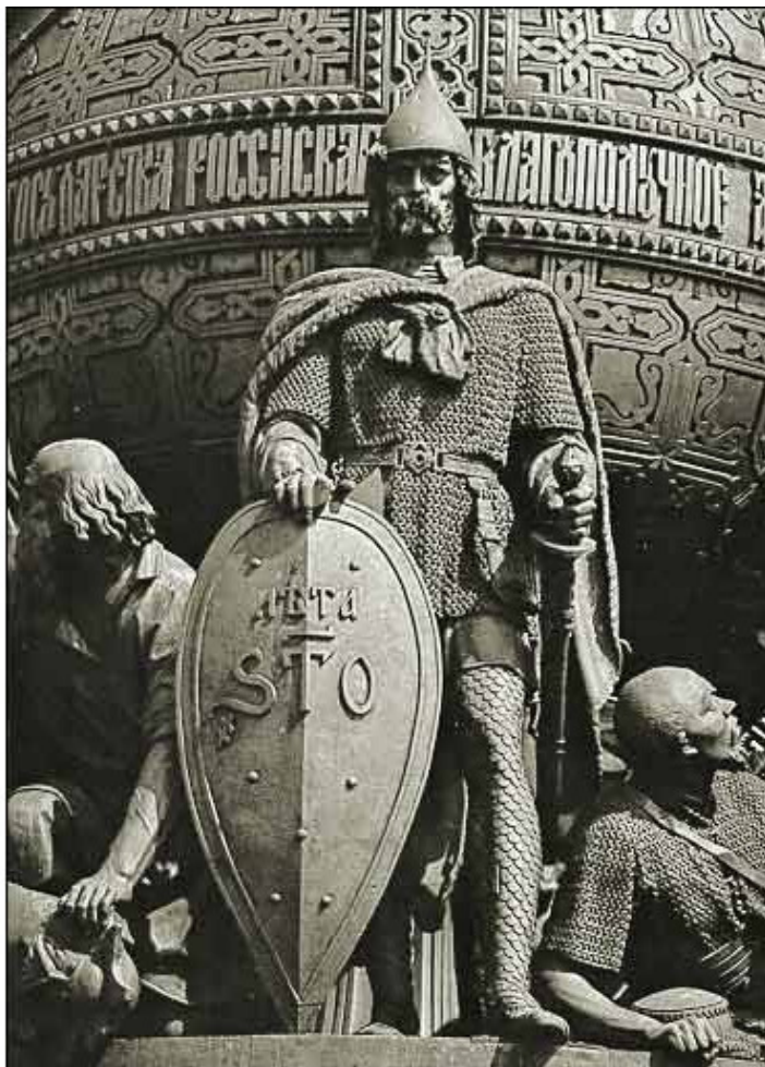
Памятник «Тысячелетие России». Новгород. 1862

По преданию, славяно-финские племена в начале 9 века подчинялись варягам и платили «дань легкую». Когда надоело им быть данниками, прогнали они варягов за море.