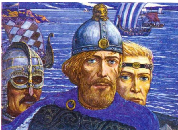
Рюрик с братьями. Худ. Глазунов

После ухода варягов начались раздоры, да и соседи их стали теснить. Тогда-то и вспомнили о выгодном правлении варягов. Убежденные советом новгородского старшины Гостомысла, славяне позвали к себе норвежских воителей.