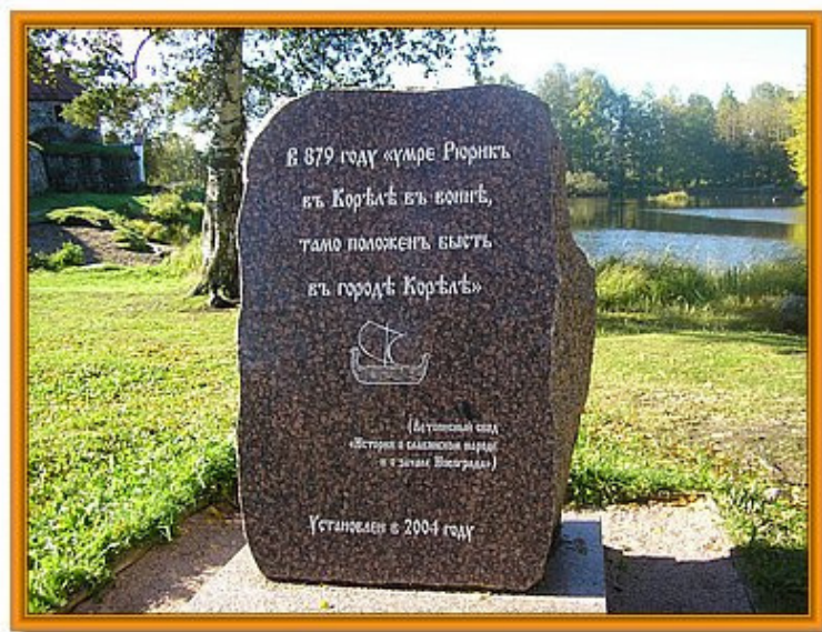
Памятный знак в Приозерске

Точное место смерти Рюрика неизвестно. В некоторых свидетельствах утверждается, что Рюрик умер в Кореле (Кегсгольм, Приозёрск). Имеются и другие версии.