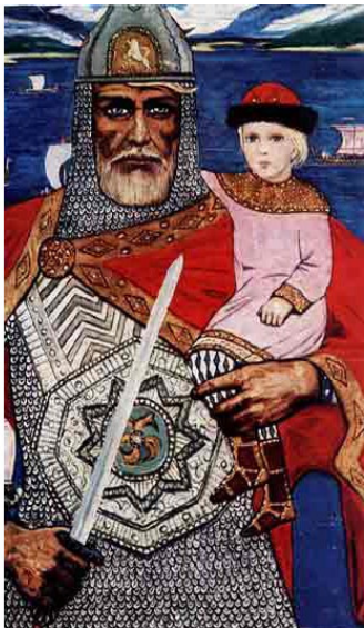
Олег и Игорь. Худ. Глазунов

879. После смерти Рюрика всю власть в Новгород принял Олег.