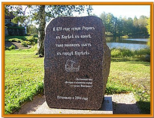
Памятный знак в Приозерске

Точное место смерти Рюрика неизвестно. В некоторых свидетельствах утверждается, что Рюрик умер в Кореле (Кегсгольм, Приозёрск). Имеются и другие версии.