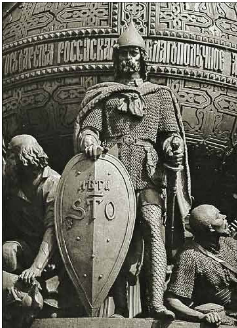
Памятник «Тысячелетие России». Новгород. 1862

По преданию, славяно-финские племена в начале 9 века подчинялись варягам и платили «дань легкую». Когда надоело им быть данниками, прогнали они варягов за море.