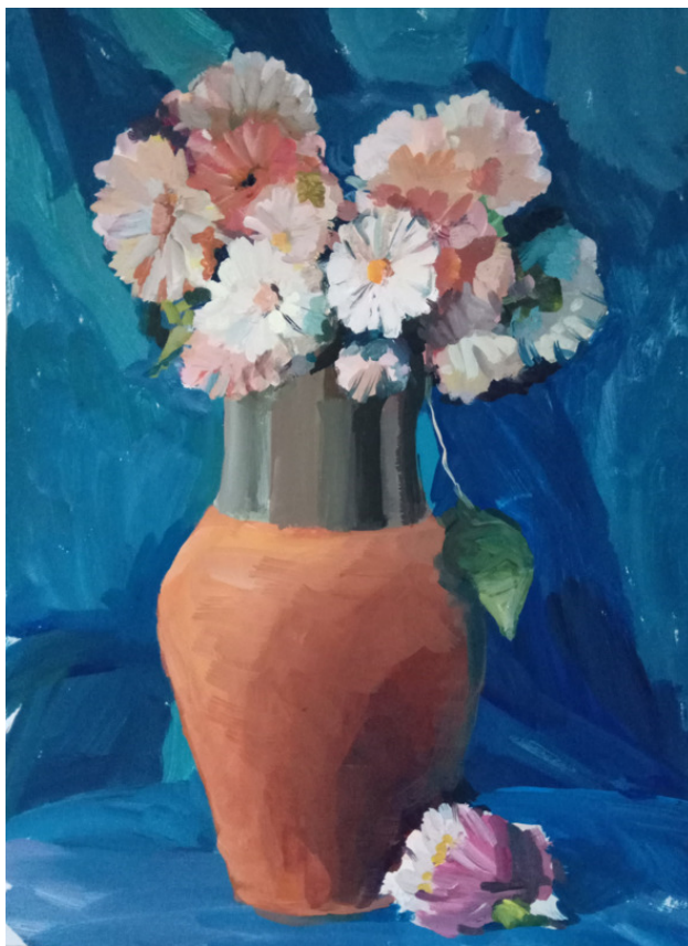
Рисунки Екатерины Годовых