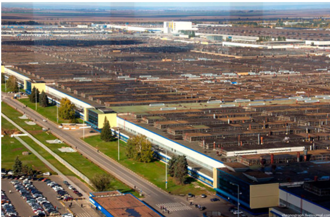
Волжский автомобильный завод

Во всех отраслях народного хозяйства за счет строительства новых, расширения и реконструкции действующих предприятий был осуществлен ввод в действие производственных мощностей.