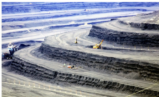
Угольный разрез «Богатырь» в Казахстане

В нефтеперерабатывающей и нефтехимической промышленности вступил в строй Белорусский шинный комбинат; введены новые мощности на Кременчугском, Ново-Ишимбайском, Ново-Горьковском, Ангарском и Киришском нефтеперерабатывающих заводах и Омском нефтеперерабатывающем комбинате, Днепропетровском, Московском, Красноярском и Омском шинных заводах, Балаковском и Курском заводах резинотехнических изделий; увеличились мощности по производству резиновой обуви.