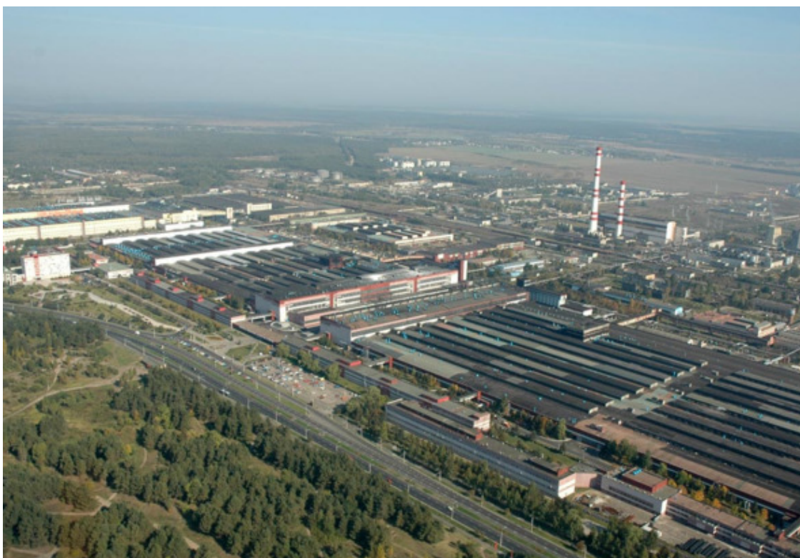
Белорусский шинный комбинат

мощностью по 250 тысяч киловатт каждая. Поставлена под промышленную нагрузку крупнейшая экспериментальная парогазовая установка мощностью 200 тысяч киловатт на Невинномысской ГРЭС в Ставропольском крае.