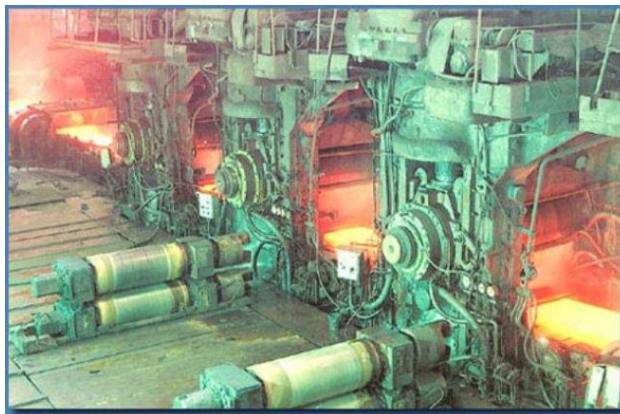
Прокатный стан на Череповецком металлургическом заводе

в год на Новолипецком металлургическом заводе, широкополосный стан «2000» на Череповецком металлургическом заводе, седьмая коксовая батарея мощностью один миллион тонн кокса в год на Западно-Сибирском металлургическом заводе, мощности по добыче и обогащению руды на Лебединском, Новокриворожском,