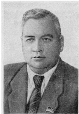
Е. Е. Алексеевский

Министром мелиорации и водного хозяйства СССР – тов. Алексеевского Евгения Евгеньевича;