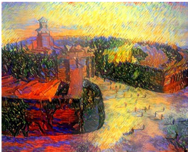
«Таинственный город Аркаим». Импровизация.