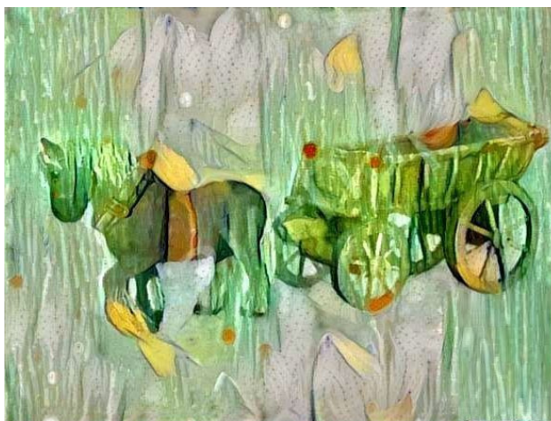
«Усталая лошадка» Импровизация В. Бессоновой

Задолго до тех событий, которые произойдут в этой книге, в солнечной Италии родился мальчик. Это был необычный мальчик, и появился он не в простой семье, а в семье волшебников. Младенец показался на свет в дорожной повозке, в которую была впряжена усталая лошадка. Если бы животинка не так устала, может быть, она и успела доскакать до специального дома, где появляются новорождённые детки. Но она еле волочила ноги и не успела. Мальчишка появился ровно в середине пути от деревушки под названием Ривейра, где жили родственники мамы малыша, и деревни под названием Баджора, где проживали родственники папы.