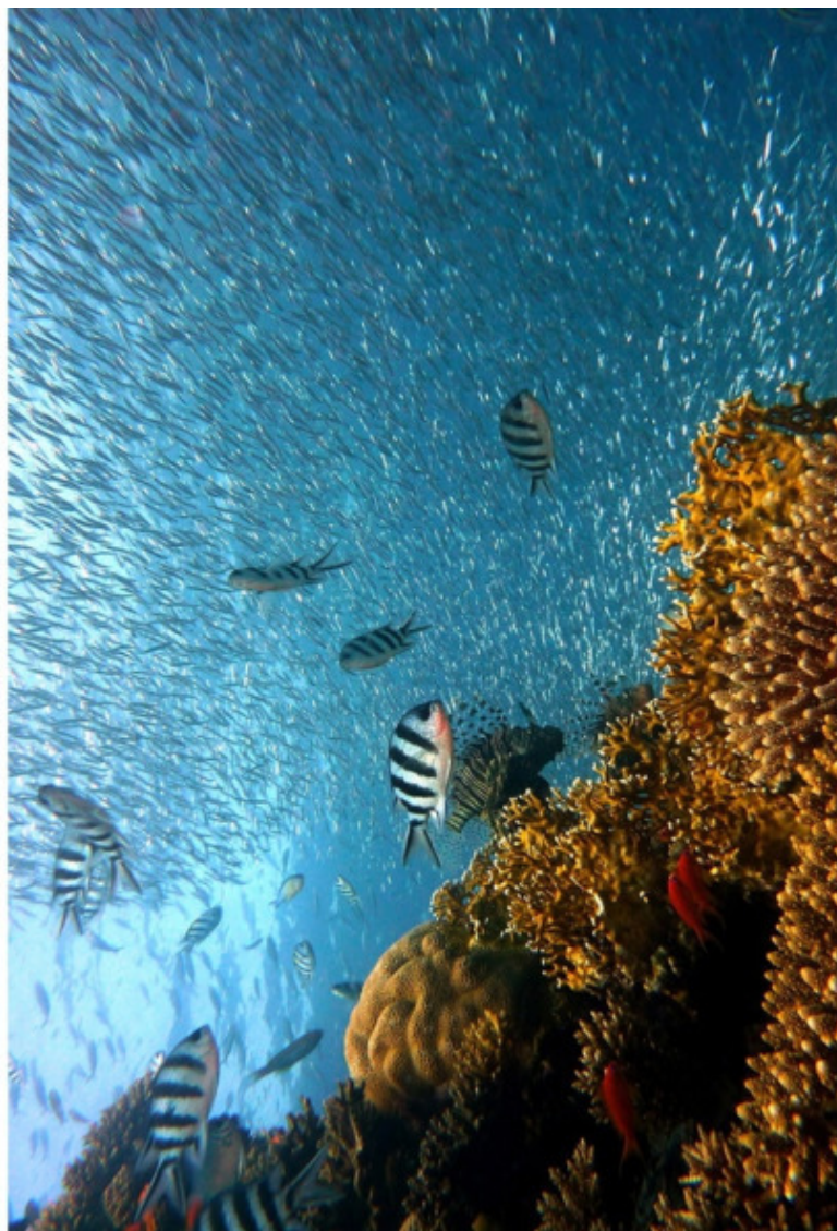
На пятый день, Бог создал всяких рыбок