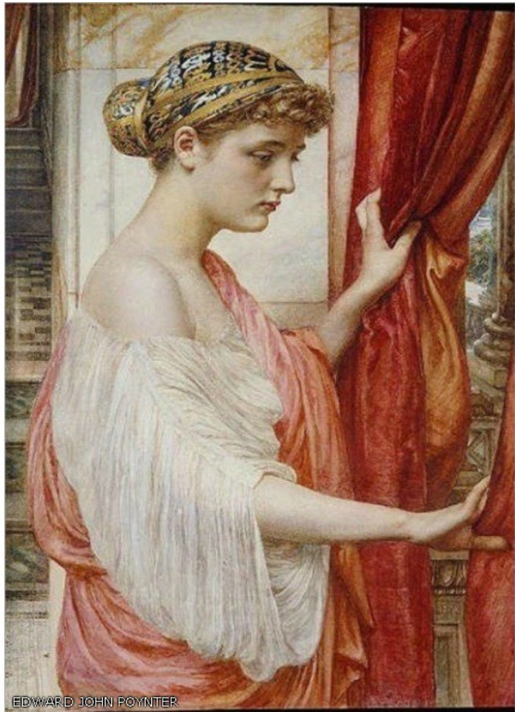
EDWARD JOHN POYNTER