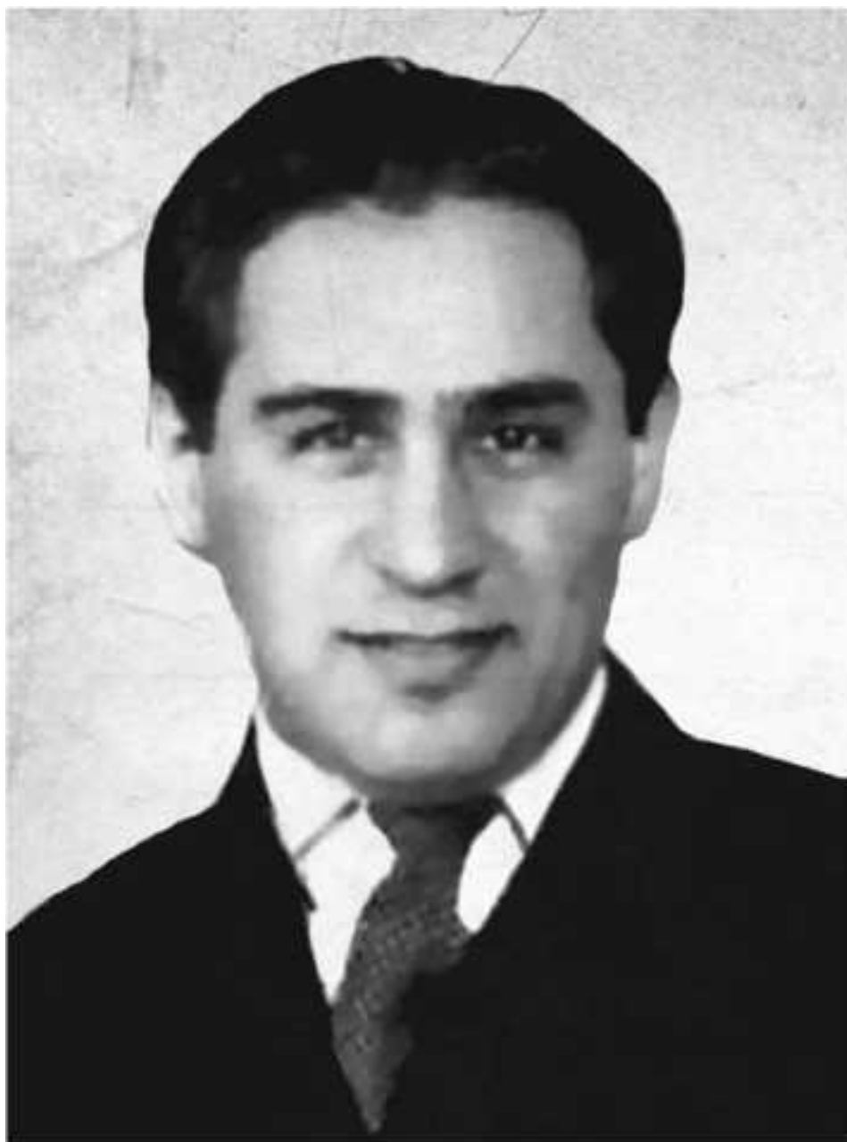
Павел Судоплатов Весна 1938 года

Во время дружеского ужина в честь Зарубина и меня на квартире Слуцкого мне пришлось выпить – второй раз в жизни – стопку водки. Впервые это случилось в Одессе, когда мне было пятнадцать лет. Хотя я и был физически здоровым человеком, врачи определили, что мне противопоказаны алкогольные напитки крепостью выше двенадцати градусов. Однако Слуцкий и Шпигельглас приказали принять «норму» за боевой орден, и на следующий день я лежал пластом. Реакция организма была ужасной: нестерпимая головная боль и рвота.