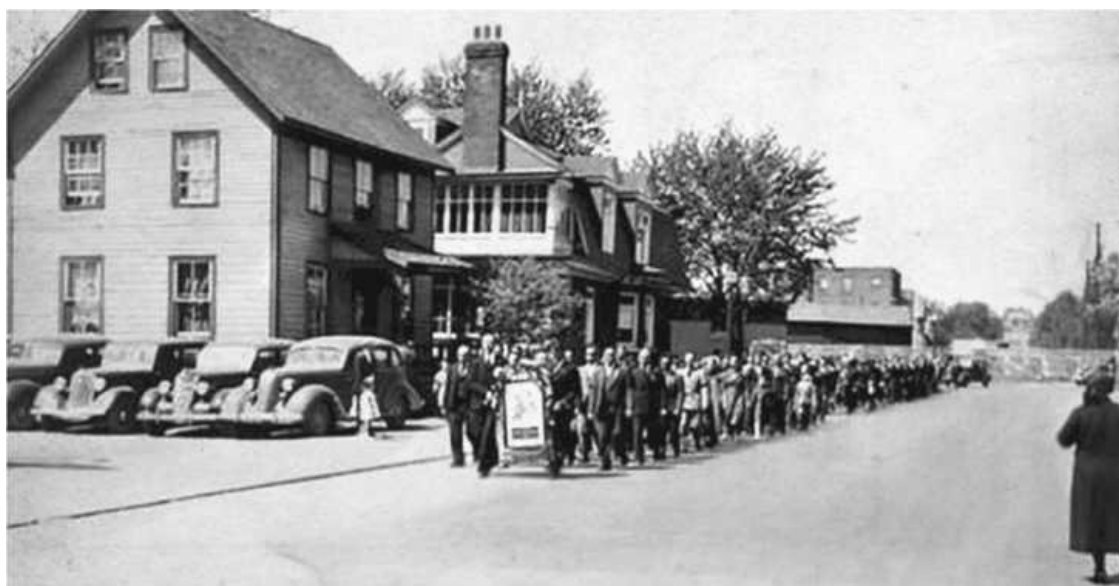
Траурная процессия украинцев по причине гибели Евгения Коновальца. Содбур (Канада), 29 мая 1938 года