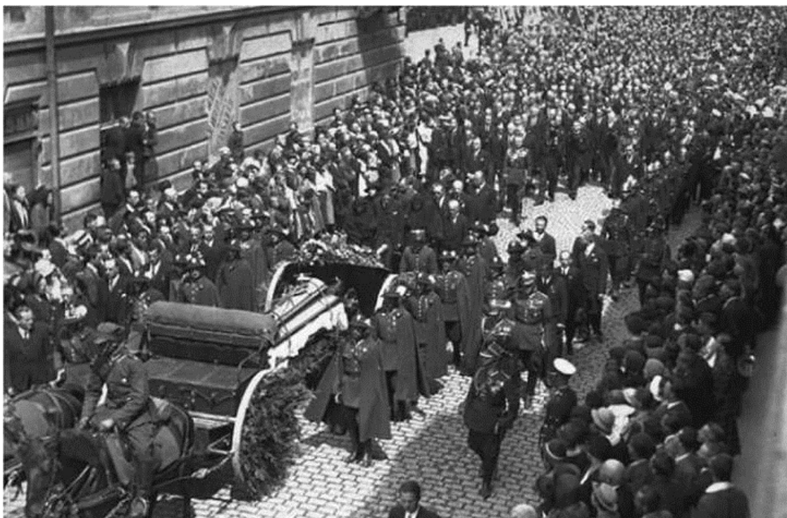
Похороны Бронислава Перацкого в Варшав

Особенно тревожили террористические связи этой организации, в частности, договоренность с хорватскими националистами и участие в убийстве югославского короля Александра и министра иностранных дел Франции Луи Барту. Для меня было открытием, что все эти террористы финансируются абвером – разведывательной и контрразведывательной службой вермахта. Полной неожиданностью явилась для меня и новость, что убийство польского министра генерала Перацкого в 1934 году украинским террористом Мацейко было проведено вопреки приказу Коновальца, и стоял за этим Бандера, соперничавший с последним за власть. Бандера стремился к контролю над организацией, играя на естественной неприязни украинцев к Перацкому, который нес ответственность за репрессии против украинского меньшинства в Польше. Коновалец рассказал мне, что к этому времени между Польшей и Германией был подписан договор о дружбе, так что немцев никоим образом не устраивали любые враждебные акции по отношению к полякам. Они были так взбешены, что выдали Бандеру, скрывавшегося в Германии. Убийца генерала, Мацейко, сумел скрыться.