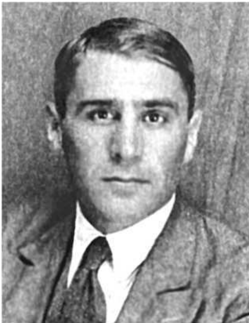
Павел Судоплатов. Фотография с загранпаспорта-прикрытия. Финляндия. 1935 год