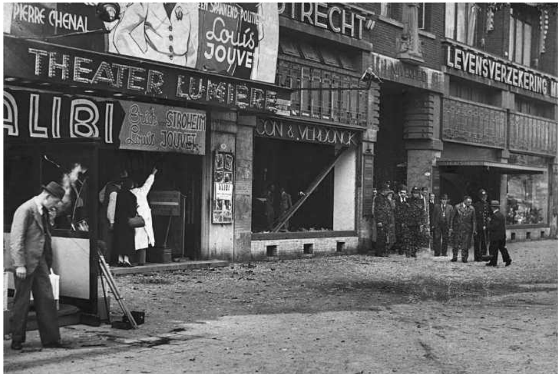
Разгромленная взрывом улица Колсингель, где произошло убийство