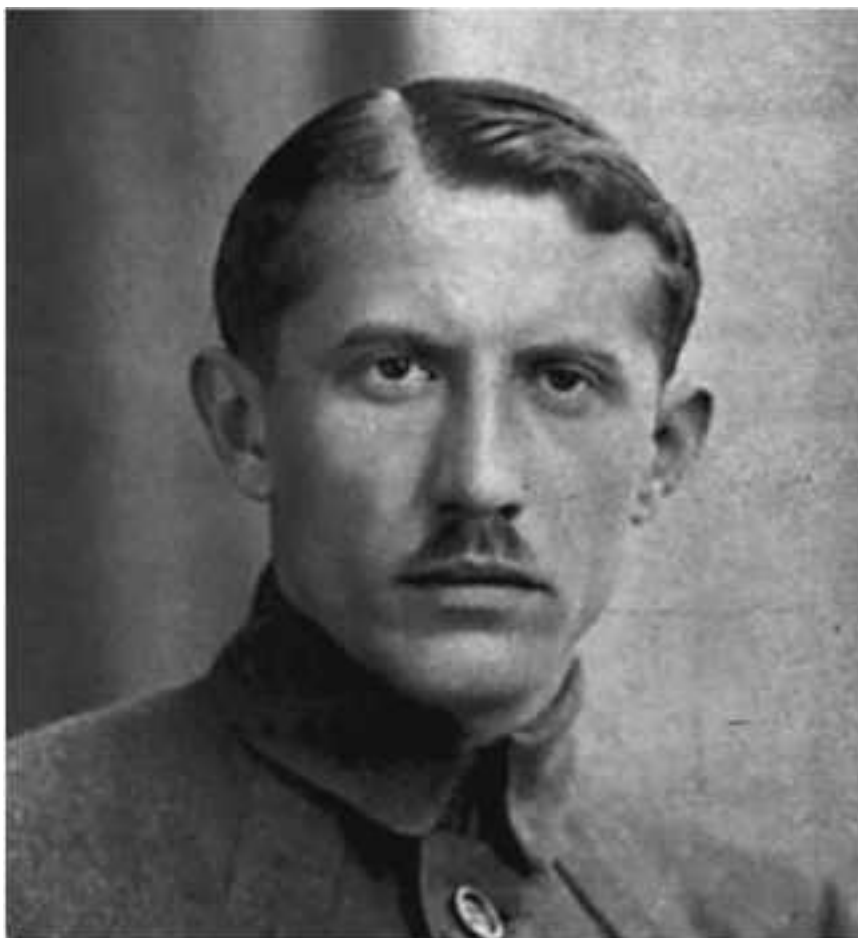
Евгений Михайлович Коновалец (1891 (1892?) – 1938) – видный деятель украинского националистического движения 1920 – 1938 годов