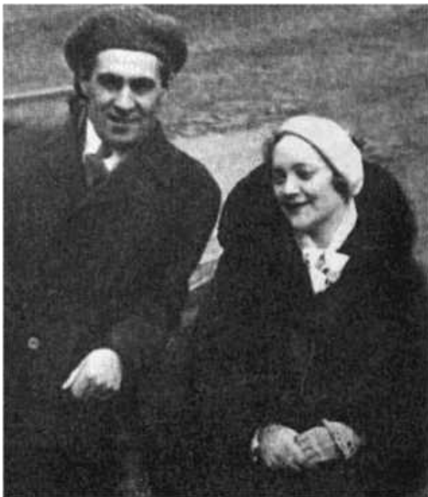
Павел Судоплатов с женой. 1935 год