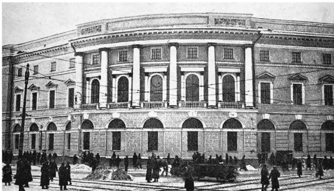
Государственная публичная библиотека им. Салтыкова-Щедрина. Ленинград. Начало тридцатых годов