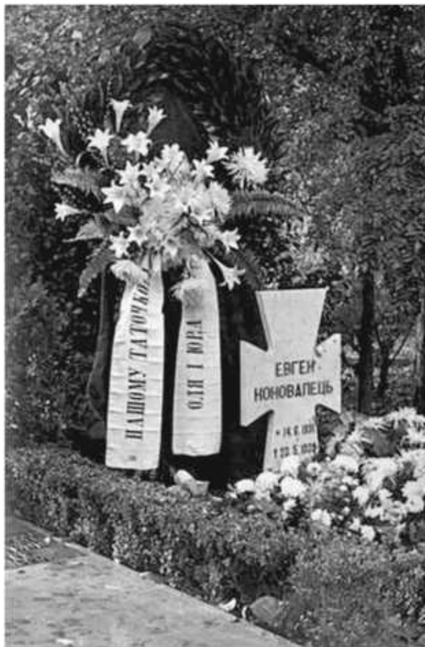
Временный памятник на могиле Евгения Коновальца на кладбище Кросвейк. Роттердам

Уходя, я положил коробку на столик рядом с ним. Мы пожали друг другу руки, и я вышел, сдерживая свое инстинктивное желание тут же броситься бежать.