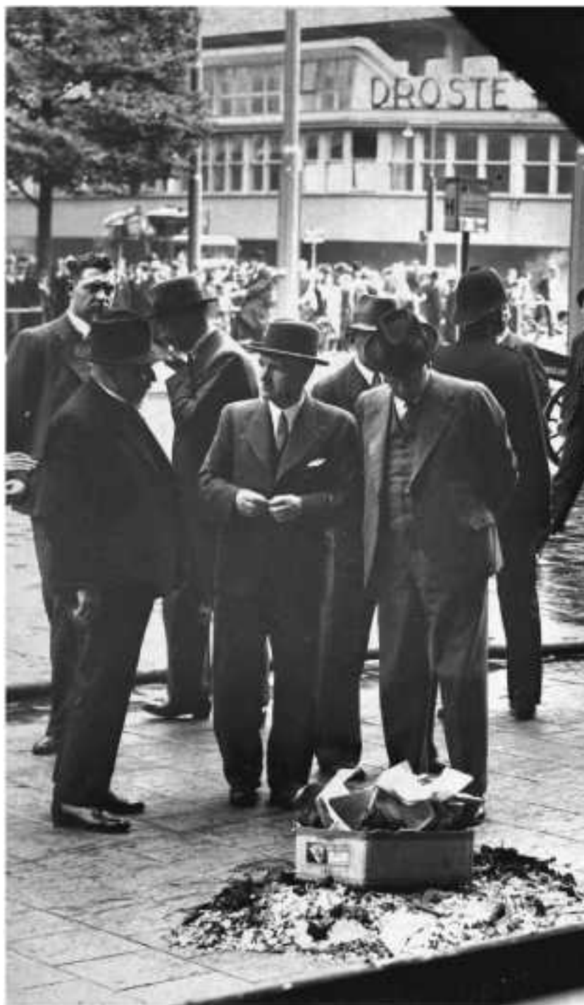
Остатки «адской машины», с помощью которой убили Евгения Коновальца