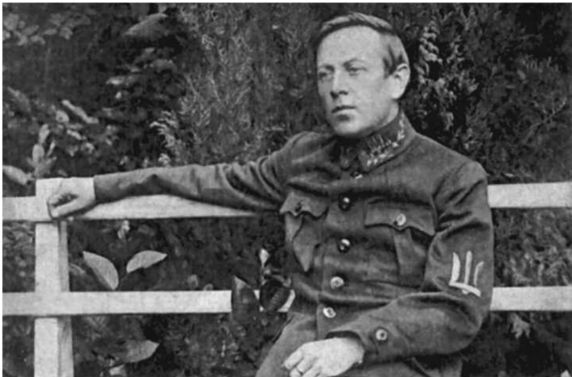
Симон Васильевич Петлюра (1879 – 1926) – украинский военный и политический деятель, глава Директории Украинской Народной Республики в 1919–1920 годах

В Особом отделе, понесшем тяжелые потери, срочно потребовался телефонист и шифровальщик. Так я был послан на работу в органы безопасности. Это и было началом моей службы в ВЧК-КГБ.