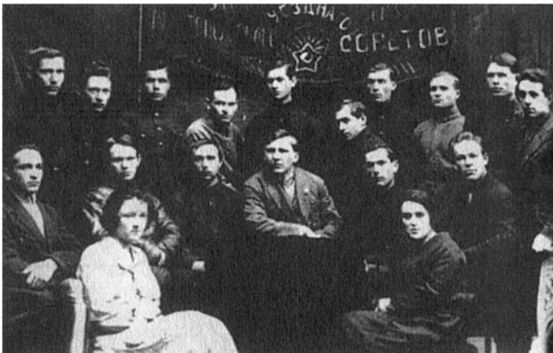
Сотрудники окружного отдела ГПУ города Мелитополя. В верхнем ряду – Павел Судоплатов. 1925 год