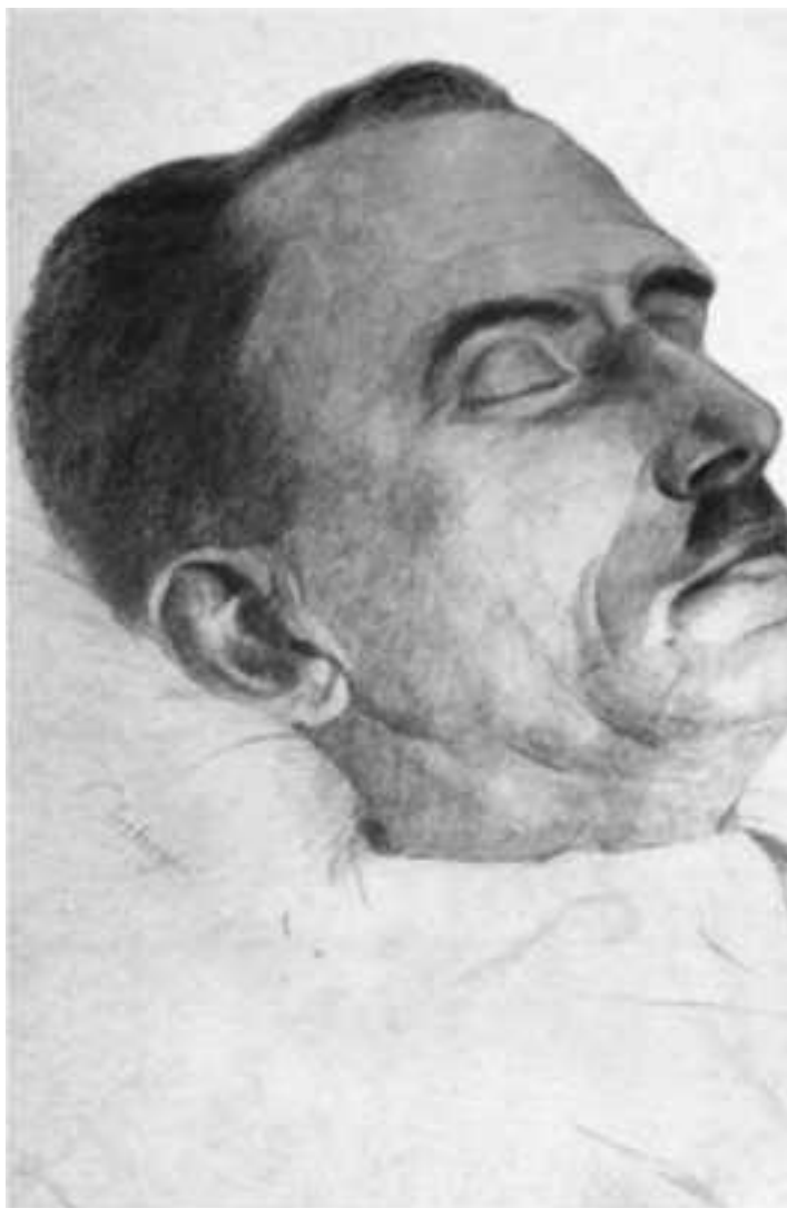
Посмертный портрет Евгения Коновальда. Автор К. Зибергер

23 мая 1938 года после прошедшего дождя погода была теплой и солнечной. Время без десяти двенадцать. Прогуливаясь по переулку возле ресторана «Атланта», я увидел сидящего за столиком у окна Коновальца, ожидавшего моего прихода. На сей раз он был один. Я вошел в ресторан, подсел к нему, и после непродолжительного разговора мы условились снова встретиться в центре Роттердама в 17.00. Я вручил ему подарок, коробку шоколадных конфет, и сказал, что мне сейчас надо возвращаться на судно.