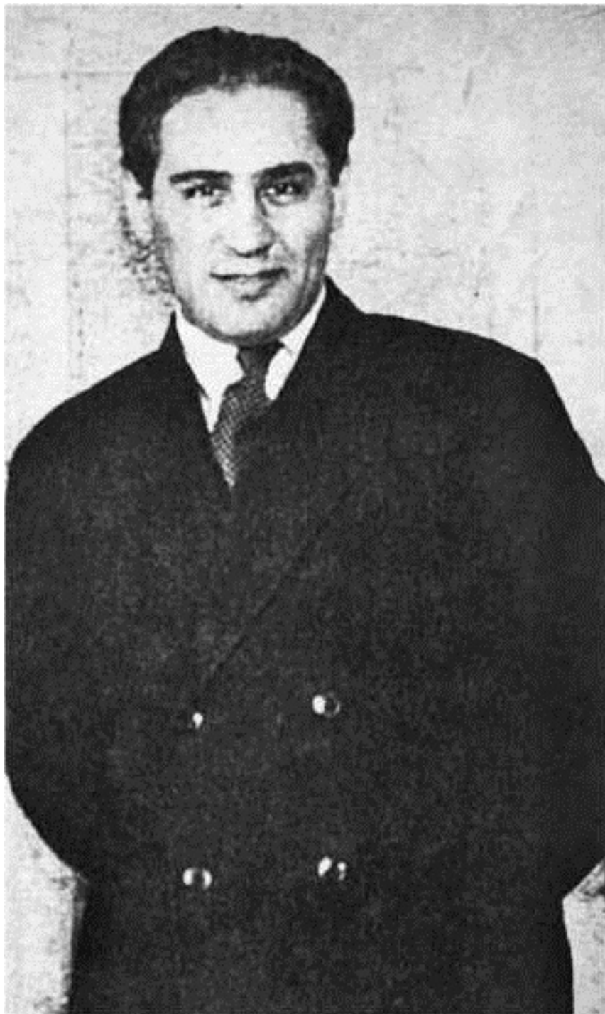
Павел Судоплатов в Берлине. 1935 год