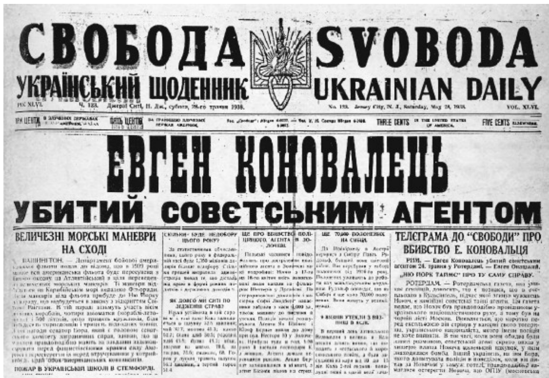
Публикация в издававшейся в США газете украинских эмигрантов о смерти Коновальца. 28 мая 1938 года