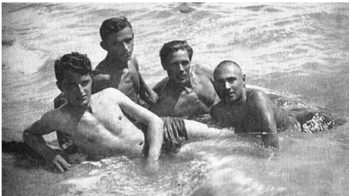
Будущие руководители советской разведки: Сергей Савченко (крайний слева) и Павел Судоплатов (крайний справа). Бердянск. 1928 год