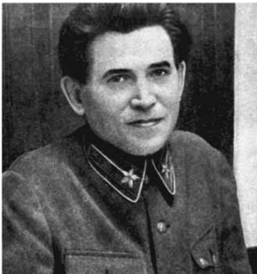
Николай Иванович Ежов (1895–1940). В 1936–1938 годах – народный комиссар внутренних дел

В ноябре 1937 года, после празднования двадцатилетия Октябрьской революции, я был вызван вместе со Слуцким к Ежову, тогдашнему наркому внутренних дел. Я встретился с ним впервые, и меня буквально поразила его неказистая внешность. Вопросы, которые он задавал, касались самых элементарных для любого разведчика вещей и звучали некомпетентно. Чувствовалось, что он не знает самих основ работы с источниками информации. Более того, похоже, что его вообще не интересовали раздоры внутри организации украинских эмигрантов. Между тем Ежов был и народным комиссаром внутренних дел, и секретарем Центрального комитета партии. Я искренне считал, что просто не в состоянии оценить те интеллектуальные качества, которые позволили этому человеку занять столь высокие посты. Хотя к этому времени я и был уже весьма опытным профессионалом в разведслужбе, но в том, что касалось карьеры в высших эшелонах власти, оставался наивным человеком: ведь те руководители, с которыми я сталкивался до сих пор, такие как Косиор и Петровский, возглавлявшие компартию Украины, были высокоинтеллектуальными людьми с широким кругозором.