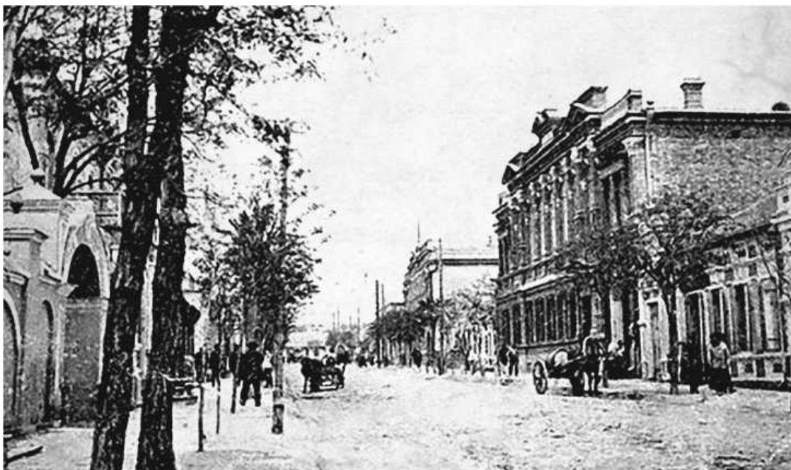
Мелитополь. Начало XX века

Я родился в 1907 году на Украине, в городе Мелитополе, расположенном в богатом фруктами регионе и в то время насчитывавшем около двадцати тысяч жителей. Мать у меня русская, а украинцем был мой отец – разнорабочий, пекарь, булочник, повар, официант. Как и всех детей – а нас в семье было пятеро, – меня крестили в русской православной церкви на день Петра и Павла. Мое начальное образование включало в себя изучение Нового и Ветхого Завета и основ русского языка, поскольку в царское время преподавание украинского в школах запрещалось. Пользовались им лишь в качестве разговорного. До десяти лет, пока не умер отец, у меня было самое обычное детство. После его смерти заботы о семье легли на плечи матери и старшей сестры. В год смерти отца произошла революция, власть взяли большевики.