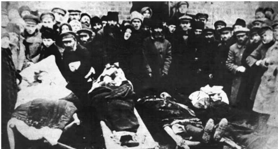
Жертвы петлюровского погрома 1919 года в Проскурове

Опыт, приобретенный при выполнении обязанностей телефониста, а затем шифровальщика, оказался полезным. Я печатал документы с грифом ««секретно», посылавшиеся командованию, и расшифровывал телеграммы, которые мы получали непосредственно от главы ВЧК Феликса Дзержинского из Москвы.