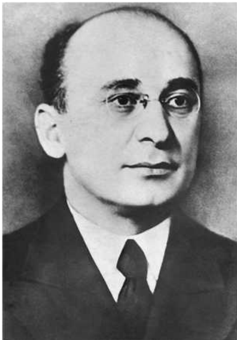
Лаврентий Павлович Берия (1899–1953) – в 1938–1945 годах – нарком внутренних дел СССР