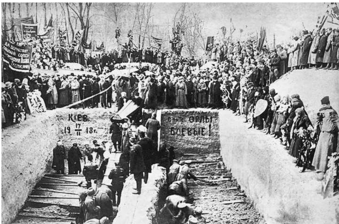
Похороны участников Январского восстания. Киев, 17 февраля 1918 года

Сталин попросил Петровского высказаться. Тот торжественно объявил, что на Украине Коновалец заочно приговорен к смертной казни за тяжчайшие преступления против украинского пролетариата: он отдал приказ и лично руководил казнью революционных рабочих киевского «Арсенала» в январе 1918 года.