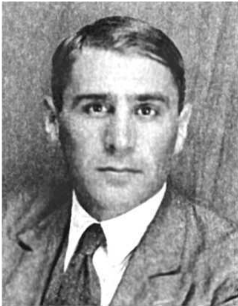
Павел Судоплатов. Фотография с загранпаспорта-при-