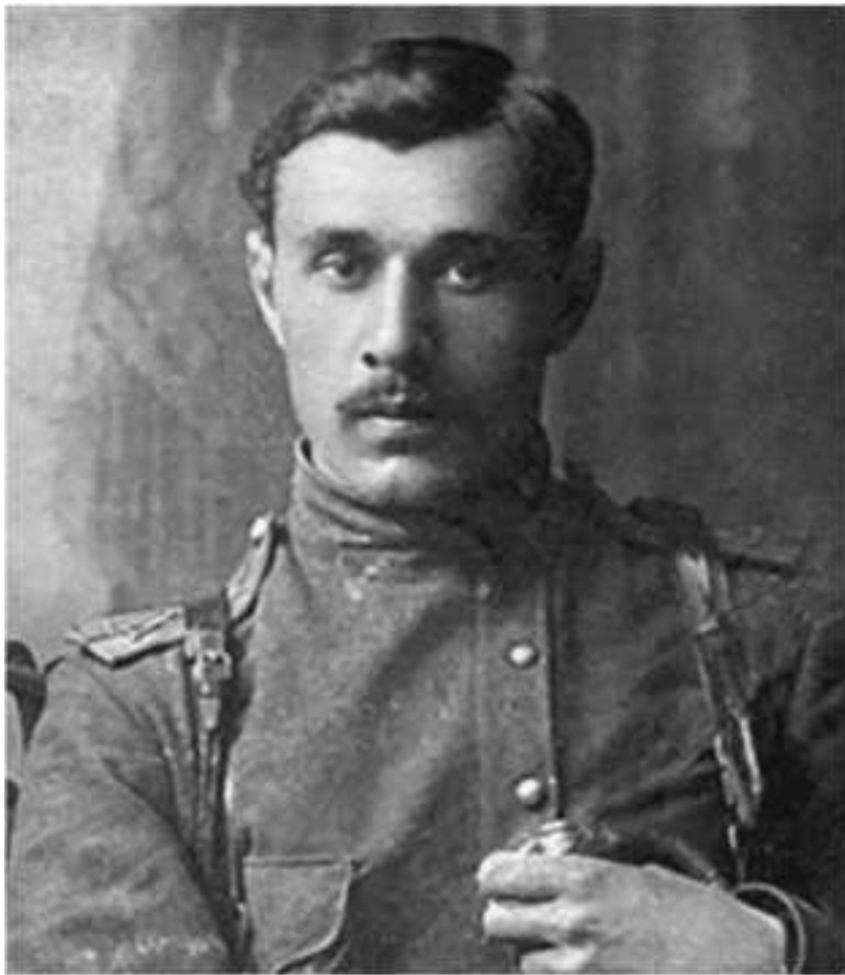
Николай Владимирович Скоблин (1893–1937) – штабс-капитан царской армии, деятель белого движения и агент НКВД