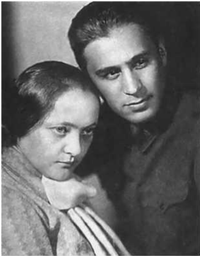
Павел Судоплатов с супругой