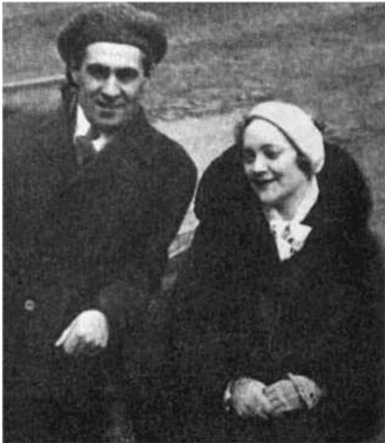
Павел Судоплатов с женой. 1935 год

Однако чем больше я думал об этом предложении, тем более заманчивым оно мне представлялось. И я согласил-