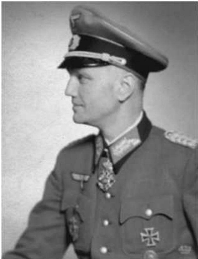
Эрвин фон Лахузен (1897–1955). В 1938 году – замести-