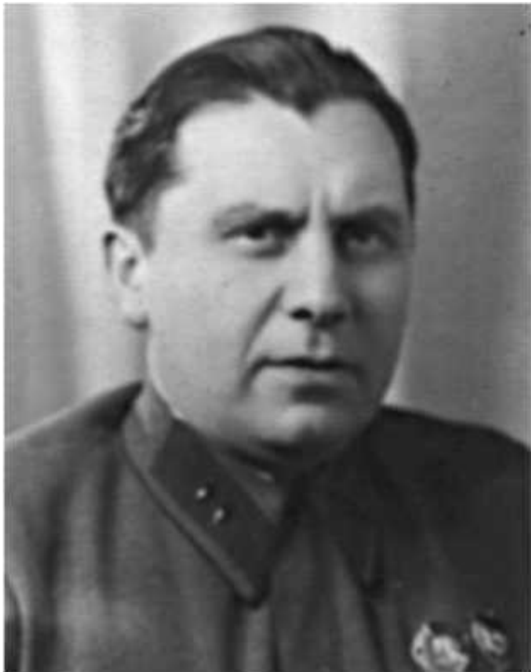
Наум Исаакович Эйтингон (1899–1981) – советский разведчик, генерал-майор государственной безопасности. Один