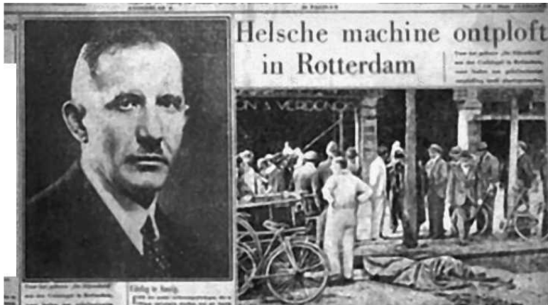
Публикация в немецкой газете посвященная гибели Коновальца