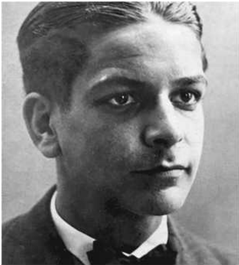
Рамон Меркадер (1913–1978) в юности

В течение 1936–1939 годов в Испании шли, в сущности, не одна, а две войны, обе не на жизнь, а на смерть. В одной войне схлестнулись националистические силы, руково-