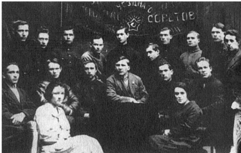
Сотрудники окружного отдела ГПУ города Мелитополя. В верхнем ряду – Павел Судоплатов. 1925 год