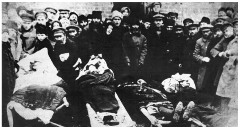
Жертвы петлюровского погрома 1919 года в Проскурове

ли очень дисциплинированы и дрались до последней капли крови. Борьба шла жестокая, и случалось, что целые деревни оказывались уничтоженными украинскими националистами и бандформированиями: всего в ходе гражданской войны на Украине погибло свыше миллиона человек. Мое поколение вскоре привыкло к жестокостям этой войны, потерям и лишениям. Мы считали все это вполне естественным. В состоянии войны страна находилась с 1914 года, и трагедия России заключалась в том, что до самого конца гражданской войны, то есть до 1922 года, создать стабильное общество, опирающееся на нормальные, гуманные ценности, не представлялось возможным.