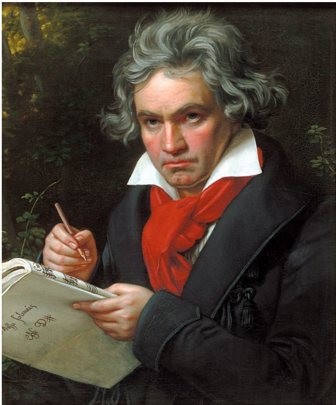
Людвиг ван Бетховен. Портрет работы Карла Штилера, 1820 год