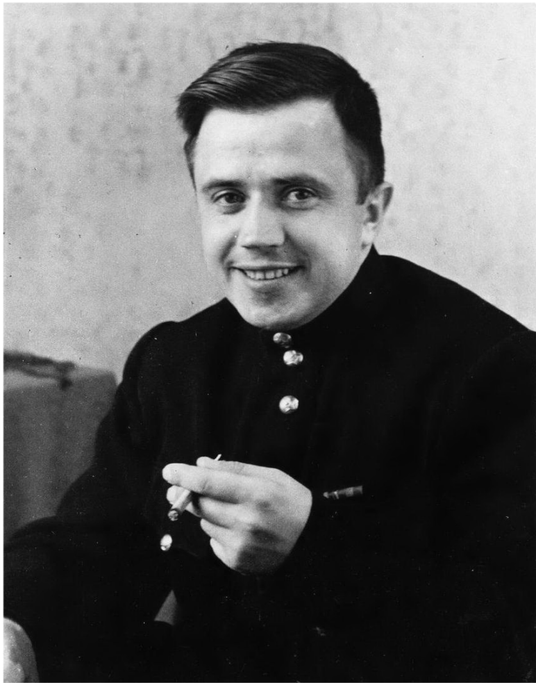
Журналист Геннадий Григорьев. Фото сделано летом 1959 года.