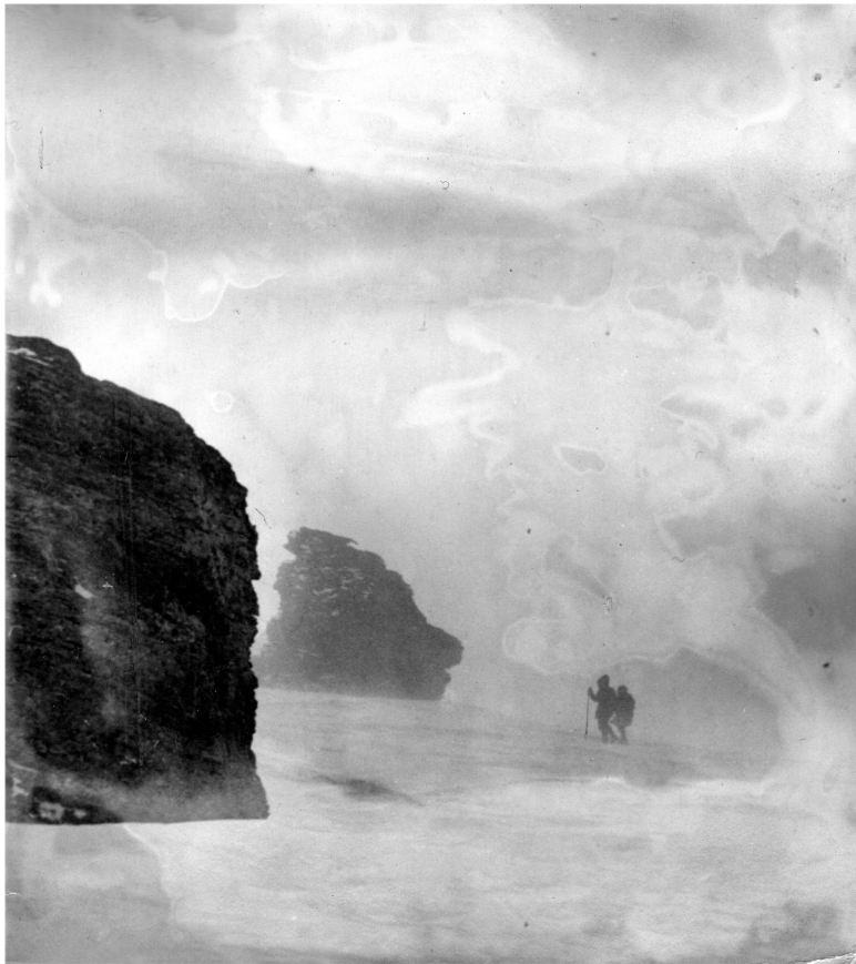
Останцы у горы Холатчахль.