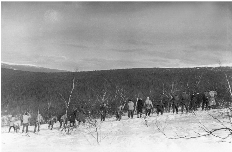
28 февраля 1959 года. Поиски группы Дятлова продолжаются. На склоне горы 1079.