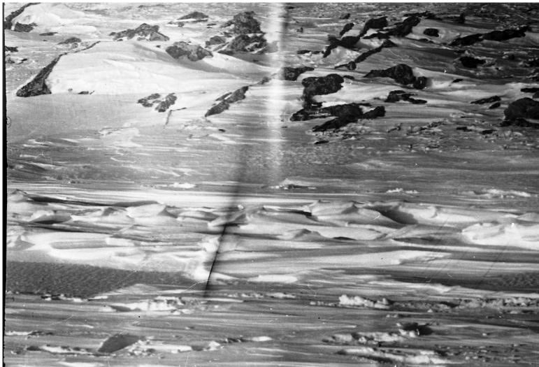
Каменные гряды (курумники) на горе Холатчахль.