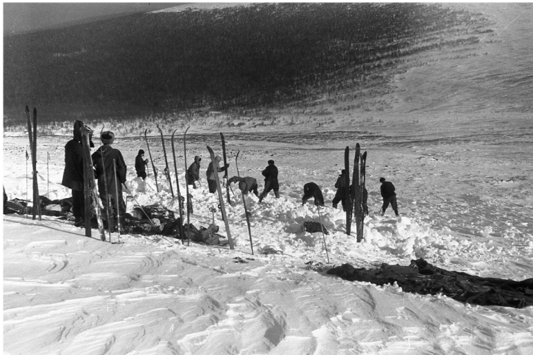
Разобранная палатка на склоне горы Холатчахль (1079 м).