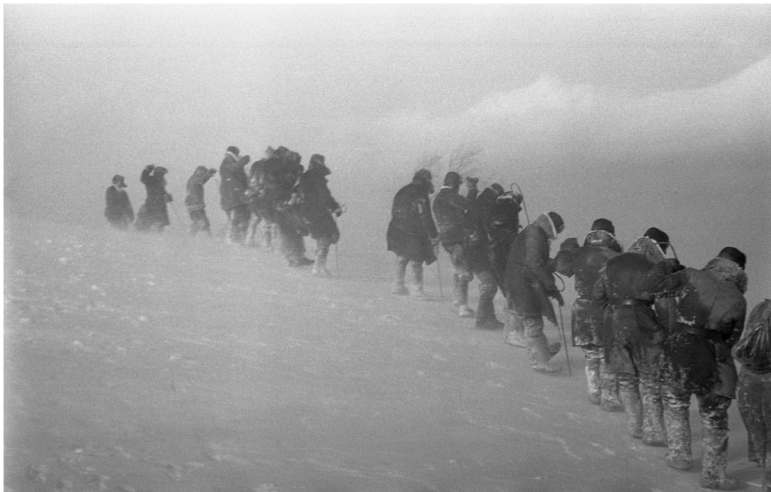
Поиски в метель. Солдаты прощупывают сугробы длинными, двухметровыми, щупами. Март 1959.