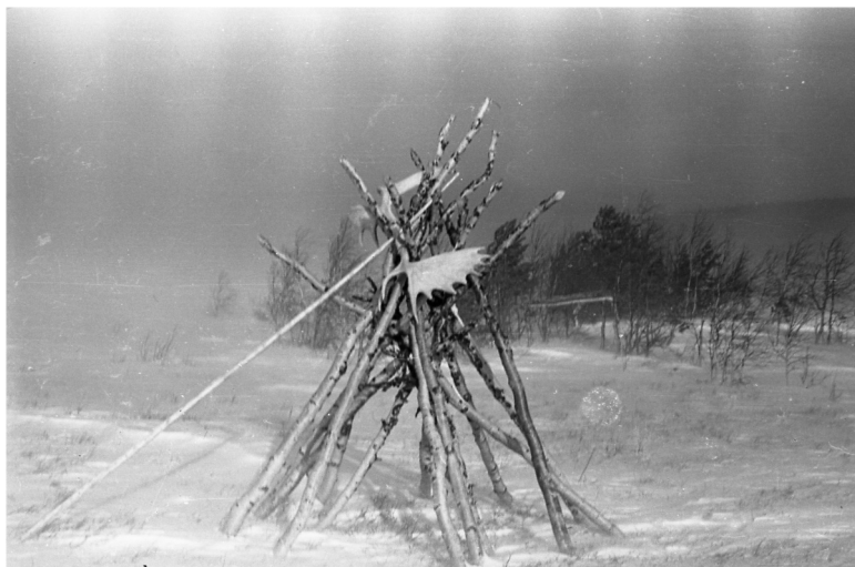
Мансийский летний чум на северной стороне горы Холатчахль.