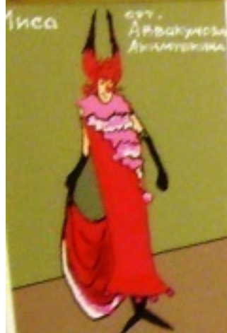
арт. Арвакунцова Анжелика