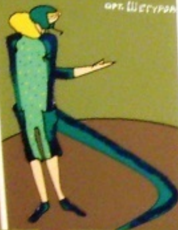
Уж арт. Шегуров