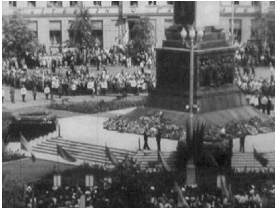
Сразу после открытия монумента Победы. Цветы уже со всех сторон обелиска. Кадр из документального фильма

Белорусская комсомольская газета «Чырвоная змена» 6 июля вместе с отчетом о митинге поместила и стихотворение Алеся Астапенко: