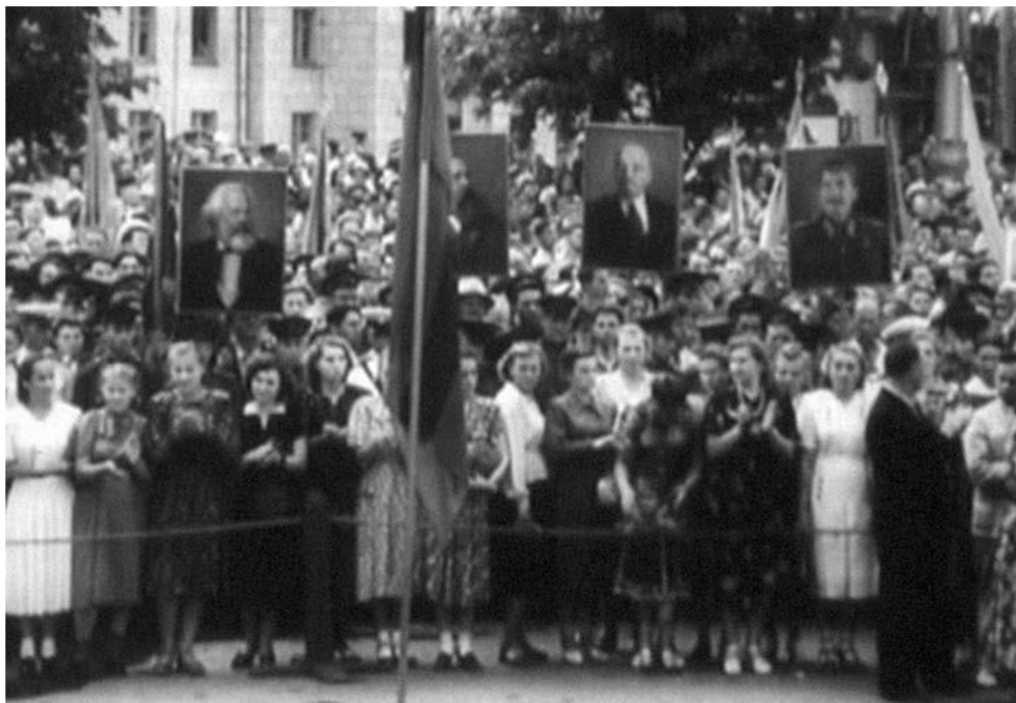
Минчане на митинге во время открытия обелиска Победы 4 июля 1954 г. Кадр из документального фильма