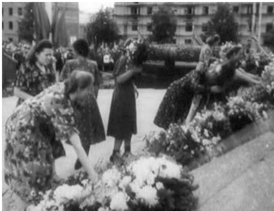
Возложение минчанами цветов к монументу Победы сразу после его открытия. Кадр из документального фильма

лович успешно руководил Гомельским партизанским соединением, за что был удостоен званий генерал-майора и Героя Советского Союза. От имени воинов минского гарнизона выступил генерал-лейтенант А. С. Бурдейный. В 1944 г. Алексей Семенович командовал прославленным 2-м гвардейским Тацинским корпусом, боевые машины которого и ворвались в Минск 3 июля. Один из танков его корпуса и теперь стоит на постаменте у столичного Дома офицеров. После этого митинг был объявлен закрытым, снова прозвучал гимн Советского Союза. Торжества переместились в соседний парк, на входе в который со стороны площади Победы теперь стоит прекрасная арка, похожая на триумфальную. Как и монумент Победы, она тоже создана по проекту Г. В. Заборского.