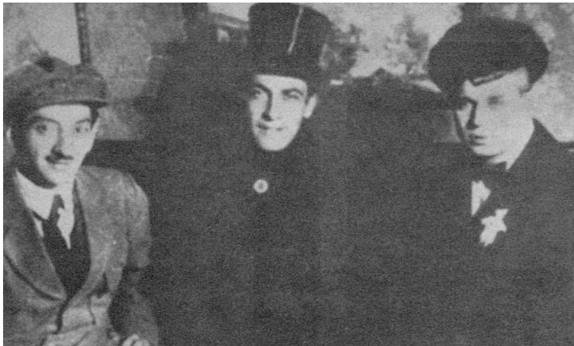
Г.Б. Якулов, А.Б. Мариенгоф, С.А. Есенин. Москва, 1919 г.

Перед судом Есенин вместе с Мариенгофом уехал в Харьков. И так он будет не раз скрываться от милиции и судебных органов. А те не очень и стремились привлекать его к ответственности, зная его популярность и строптивый характер.