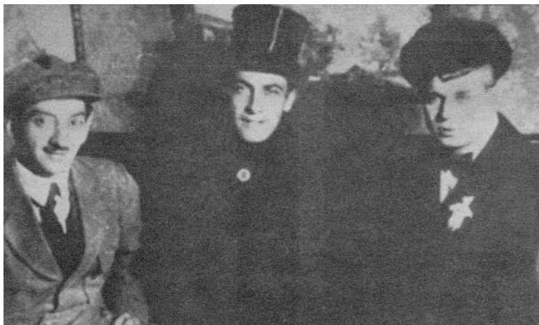
Г.Б. Якулов, А.Б. Мариенгоф, С.А. Есенин. Москва, 1919 г.