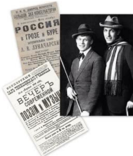
Сергей Есенин и Анатолий Мариенгоф. 1920 год. Москва.