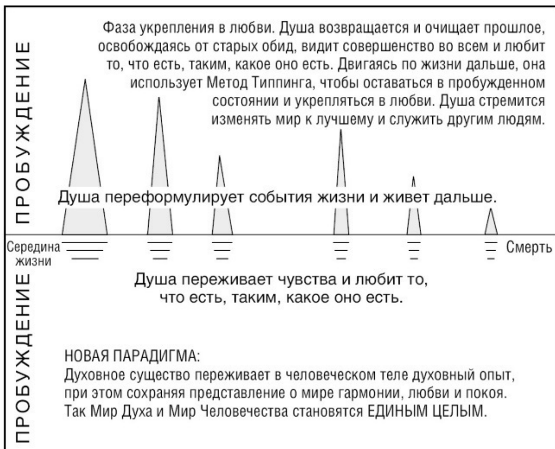
Рис. 2. Путешествие души (2)

И еще раз подчеркну: верить не обязательно. Как уже было сказано, процесс Радикального Прощения основан на принципе «притворяйся, пока это не станет правдой». Он работает независимо от вашего желания.