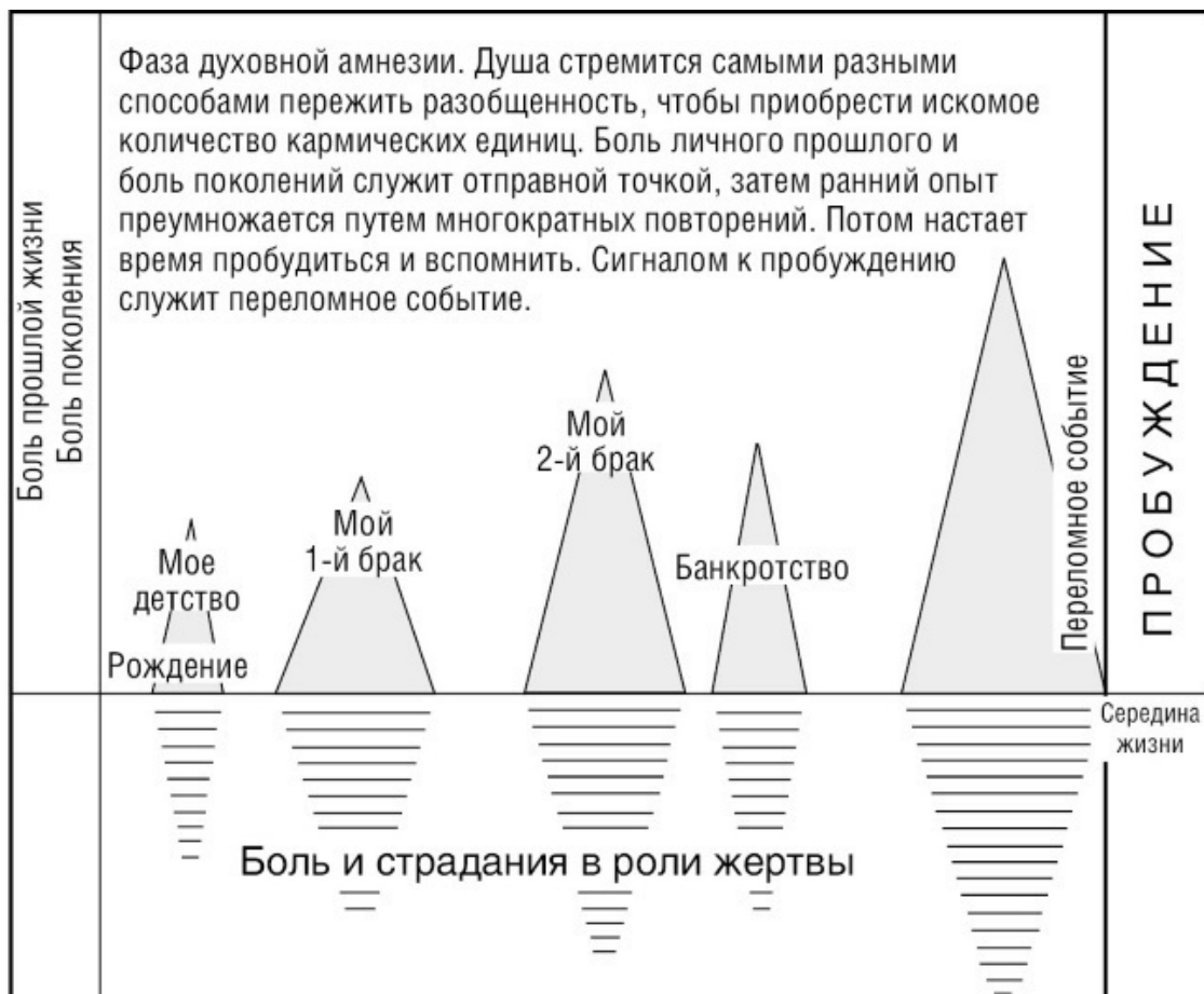
Рис. 1. Путешествие души (1)

Если вы задаетесь вопросом, на каком этапе путешествия находится ваша душа, то, по моему мнению, независимо от вашего возраста, вам не стоит читать эту книгу до того, как вы прошли точку пробуждения. В этом случае вам уже давно следовало ее отложить. Читателю нужно набрать еще много кармических единиц, прежде чем ему откроется смысл изложенной идеи.