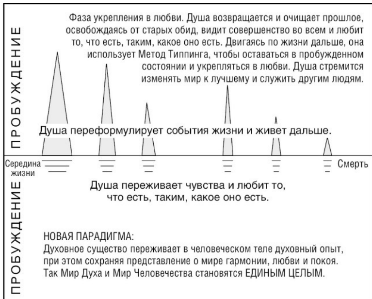
Рис. 2. Путешествие души (2)

И еще раз подчеркну: верить не обязательно. Как уже было сказано, процесс Радикального Прощения основан на принципе «притворяйся, пока это не станет правдой». Он работает независимо от вашего желания.