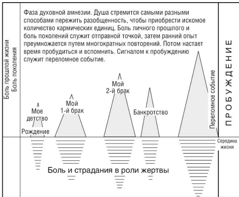
Рис. 1. Путешествие души (1)

Итак, допустим, вы пробудились и испытали состояние разделения в нужном объеме. Теперь вы можете начинать двигаться по линии времени вспять, очищая при помощи Радикального Прощения свою жизнь от обломков травм, старых убеждений, ошибок, несчастий – всего того, что уже выполнило свое предназначение на стадии духовной амнезии. Пришла пора просто освободиться от токсической энергии. Все это служит подготовкой ко второй фазе нашей жизни,