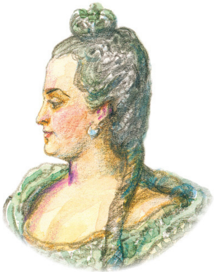
Художник Игорь Пчелко