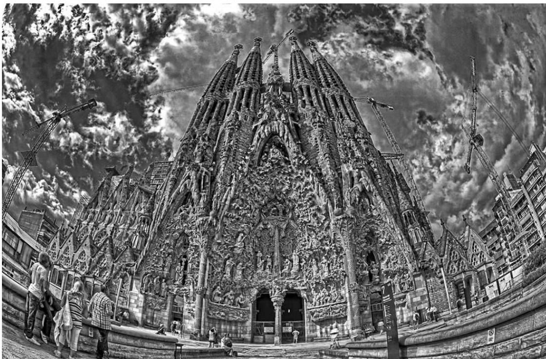
Рис. 2 Искупительный храм Святого Семейства, Барселона