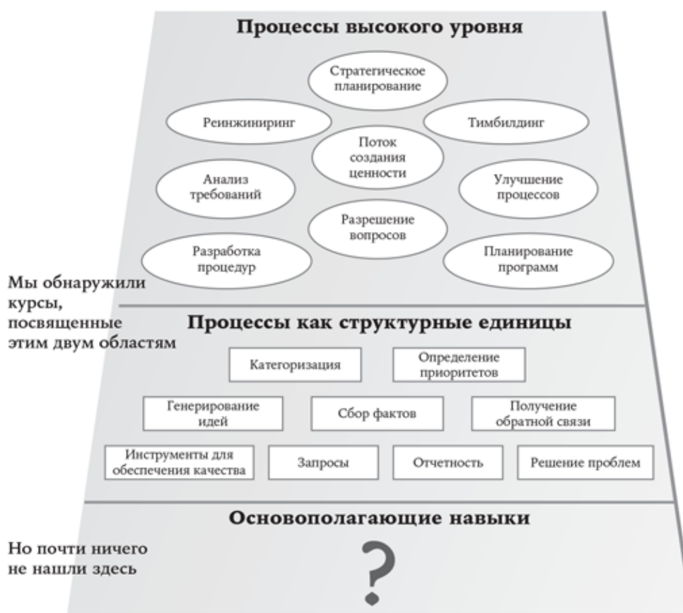
РИС. I.1. ЧЕМУ УЧИТ БОЛЬШАЯ ЧАСТЬ КУРСОВ ПО ФАСИЛИТАЦИИ

Вы считаетесь очень хорошим фасилитатором, но наверняка есть какие-то области, в которых вы хотели бы усовершенствовать свои навыки. В каких ситуациях вам может понадобиться улучшение техники? Вспомните ваши фасилитационные сессии, где что-то пошло не так хорошо, как вам хотелось. В каких областях дополнительные инструменты могли бы помочь вам стать более хорошим фасилитатором?