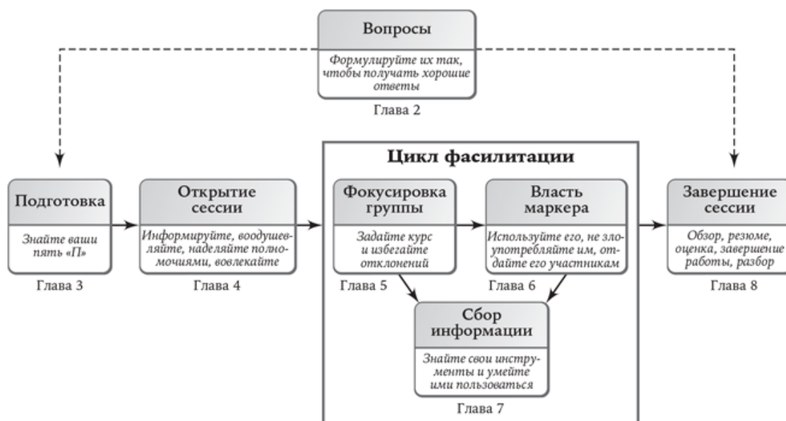
РИС. 1.4. ПРОЦЕСС ФАСИЛИТАЦИОННОЙ СЕССИИ