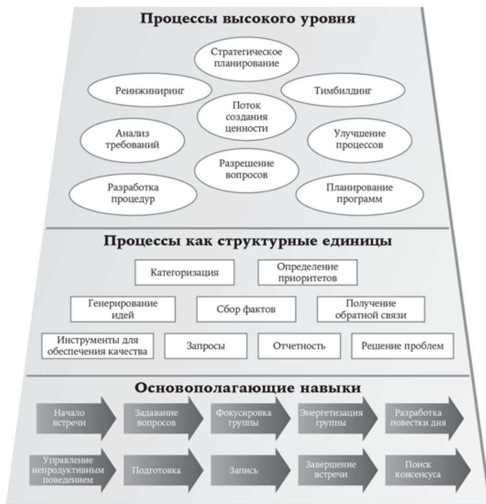
РИС. 1.2. ОБЛАСТИ ОСНОВНЫХ НАВЫКОВ ФАСИЛИТАТОРА