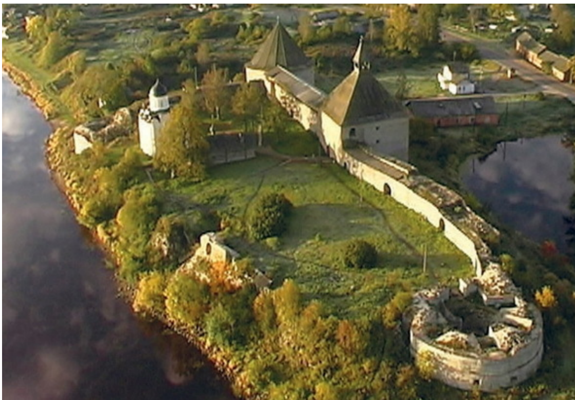
Общий вид Ладужской крепости. 2010-е гг.

Летописные известия о начале каменного строительства в Ладоге относятся к 1114 или, по другим источникам, 1116 г., когда, укрепляя рубежи своего княжества, новгородский князь Мстислав Владимирович, сын Владимира Мономаха, заложил каменную крепость у слияния реки Ладужки и Волхова.