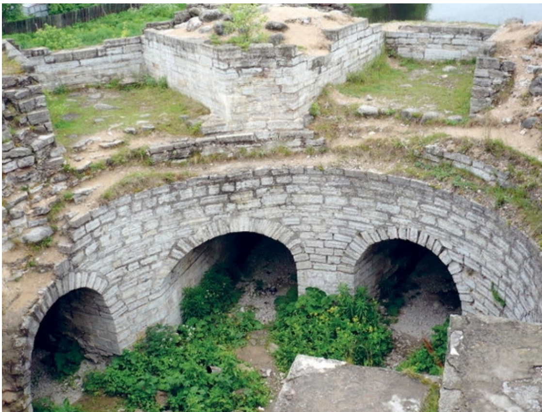
Ладожская крепость. Общий вид Стрелочной башни. Фото 2013 г.