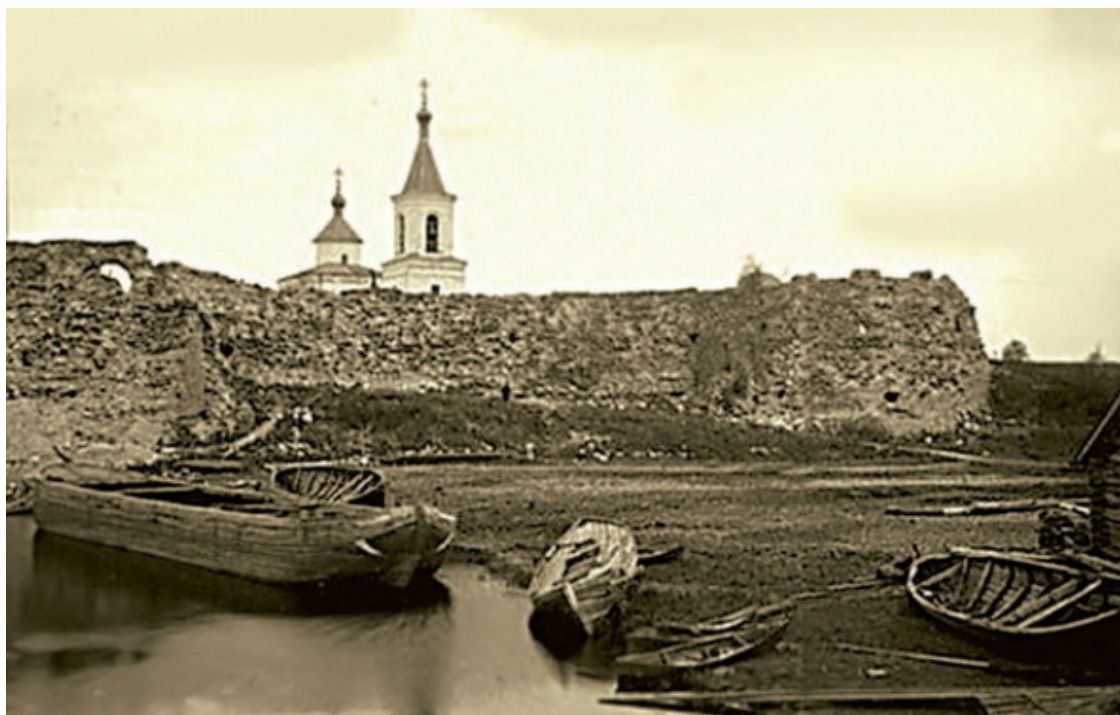
Общий вид Ладожской крепости. Фото второй половины XX в. (до 1970-х гг.)

В 862 г. на месте впадения реки Ладожка в Волхов Рюрик отстроил деревянную крепость, где разместился вместе со своей дружиной перед тем, как идти дальше на юг и поселиться в древней крепости в районе Великого Новгорода. Укрепление защищало лишь небольшую часть поселения, поскольку изначально было построено лишь для князя и его дружины. В годы правления Новгородского князя Олега, на рубеже IX–X вв., вместо деревянных укреплений была возведена каменная крепость, подобная западноевропейским оборонительным сооружениям того времени.