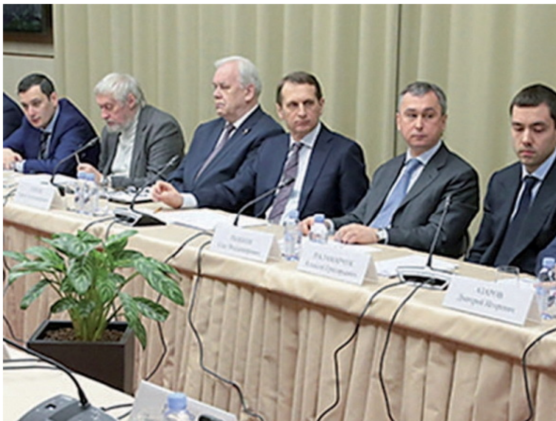
Заседание Общественного совета проекта «Историческая память»

шлым сегодня – явление массовое, это неизбежная жизненная ситуация каждого человека. И теснее всего связаны с современной жизнью общества памятники архитектуры. Архитектура – новая и старая – находится в постоянном контакте с самым широким потребителем. Поэтому и реставрация архитектурных памятников – дело не просто необходимое, но и вызывающее к себе живой и общий интерес. Повседневность и история сталкиваются здесь очевидным для каждого образом.