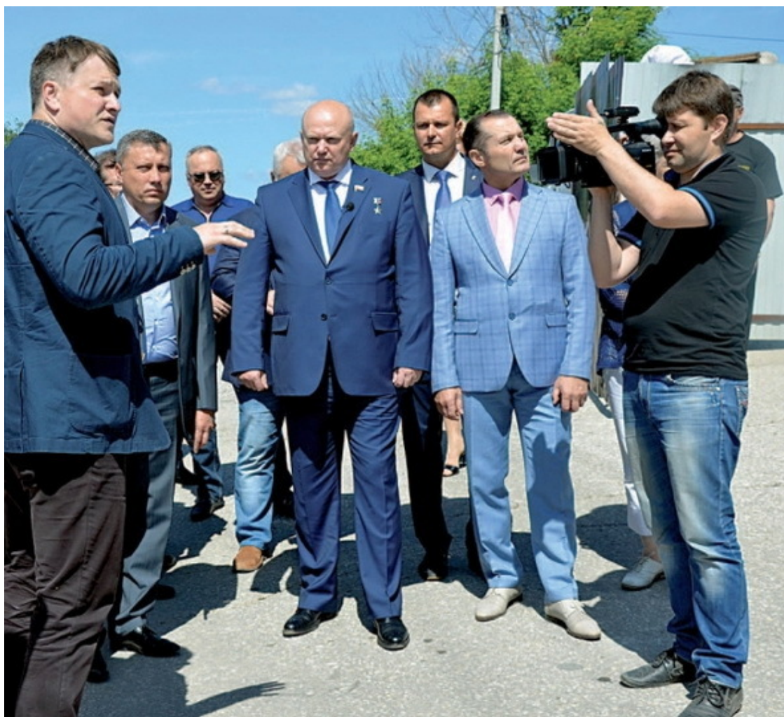
Выездное совещание Общественного совета проекта «Историческая память» в Касимове

Тема сохранения памятников культуры – это не только тема эстетического удовольствия. Как показывает опыт многих стран мира, особенно Италии, посещение туристами объектов культурного наследия при грамотном отношении к сохранности таких объектов может стать одним из весомых статей дохода бюджета. Недаром известный российский политик, один из лидеров «Единой России», глава Российского исторического общества Сергей Нарышкин обращает внимание исполнителей и идеологов «Исторической памяти»: проект имеет все шансы быть напрямую связанным со Стратегией развития малых городов России. Именно малые города – такие, например, как Торжок, Гороховец или древний Булгар, который внесен в список Всемирного наследия ЮНЕСКО – являются «ларцами», в которых ослепительно сияют жемчужины культурного наследия в виде древних и очень часто не имеющих мировых аналогов памятников.