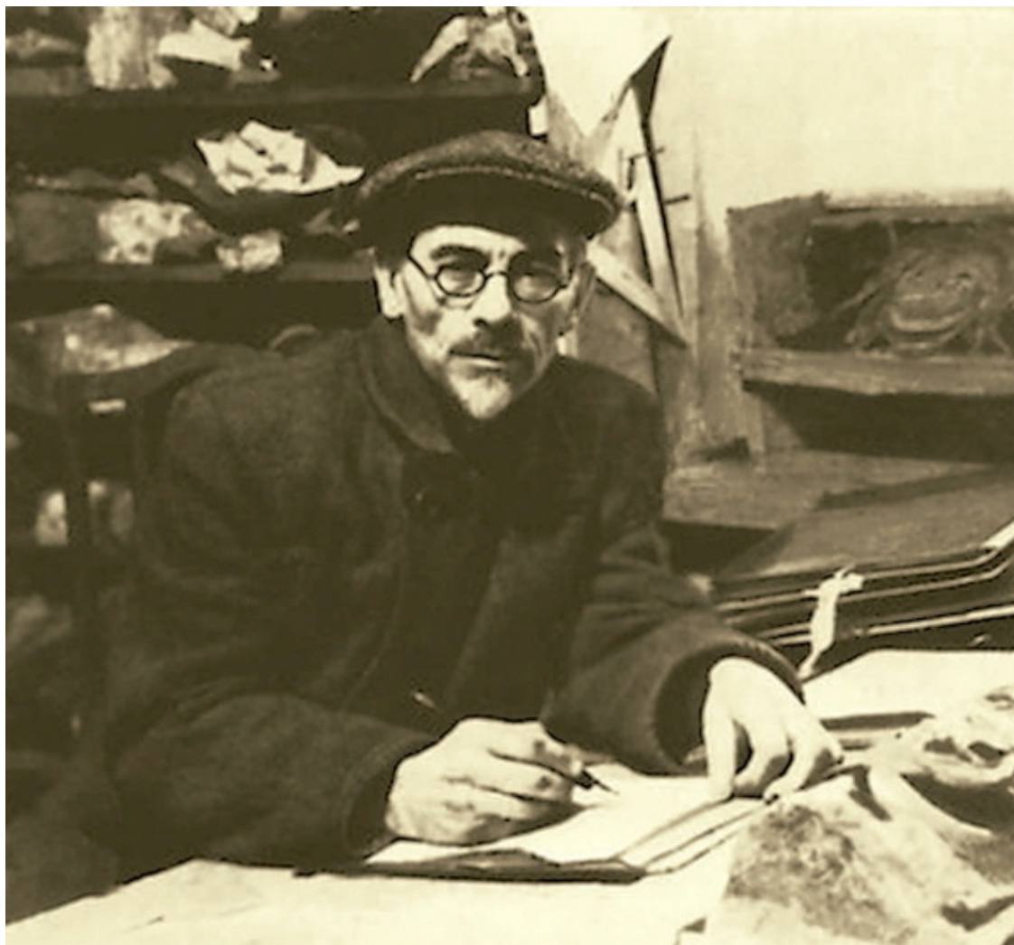
П. Д. Барановский

Аналогичные проблемы возникают практически на каждом объекте – партийцы-участники проекта «Историческая память» говорят, что это требует постоянного внимания и контроля. Безусловно, в такой работе нужен и профессионализм, и общественно-политический авторитет. Недаром среди участников проекта, согласившихся принимать участие в «Исторической памяти», немало известных и влиятельных российских парламентариев. Это и депутат Госдумы Александр Карелин, знаменитый русский борец-богатырь, который курирует памятники в Новосибирской области. Это и его коллега в Госдуме Валентина Терешкова – первая женщина, полетевшая в космос, согласилась участвовать только в том, случае, если за ней «закрепят» родную Ярославскую область. А упоминавшийся выше расцвет Ленинградской области невозможен был без активного участия Сергея Нарышкина. Владимир Ресин активно помогал восстанавливать знаковые объекты Москвы, памятниками Воронежской области предметно занялась Галина Карелова, комплексное сопровождение объектов культурного наследия в Смоленской области взял на себя Сергей Неверов, в Оренбургской области – генерал-полковник Виктор Заварзин, в Татарстане – Ильдар Гильмутдинов, во Владимирской области – Сергей Рыбаков. В целом же, ядро проекта «Историческая память» партии «Единая Россия» составляют 35 политиков высшего федерального уровня, которые входят в Общественный совет во главе с Сергеем Нарышкиным.