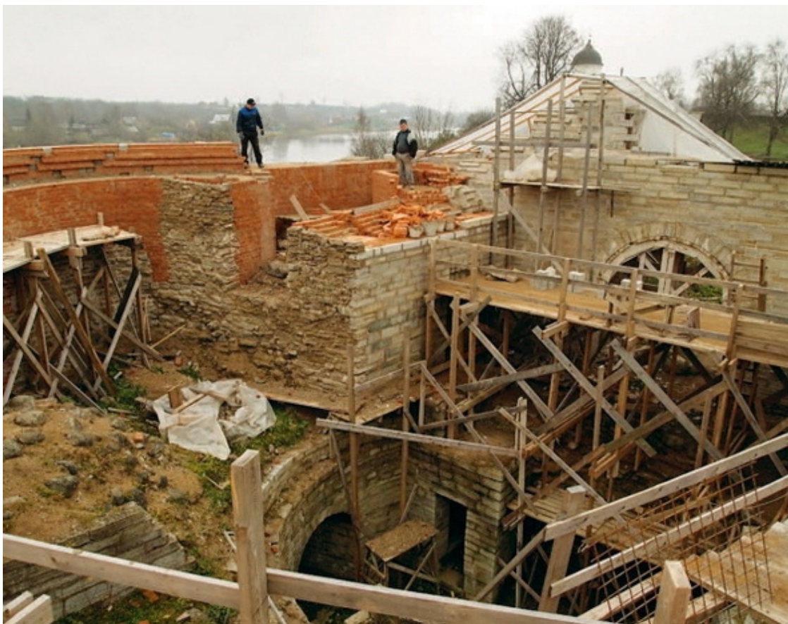
Ладожская крепость. Реставрационные работы на Стрелочной башне. Фото 2011 г.

Прясла между Раскатной и Климентовской башнями представляло собой земляной вал протяженностью 41,6 м с каменной стеной 1114 г. Ее ширина составляла 3 м, а высота – 3,6–3,8 м. Стена имела около 9 настенных бойниц и соединялась с обеими башнями. Перед валом с напольной стороны проходил ров с водой глубиной более 4 м, соединявший Ладожку и Волхов.