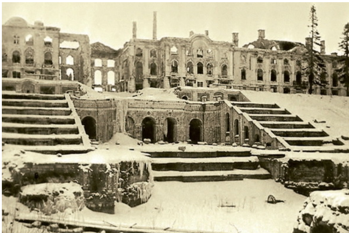
Петергоф. Разрушения во время Великой Отечественной войны

Императорское Русское историческое общество, целью которого было «всесторонне содействовать развитию русского национального исторического просвещения».