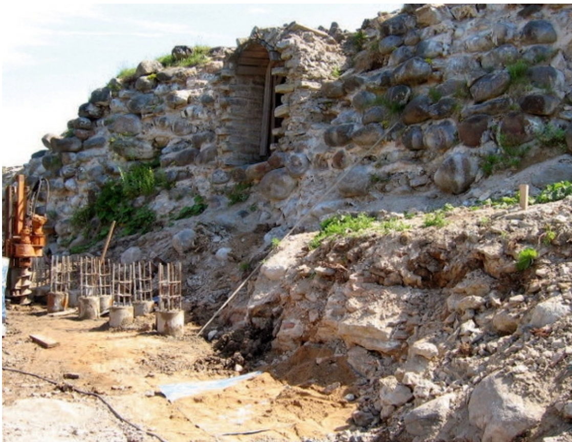
Ладожская крепость. Реставрационные работы. Устройство ростверка

В конце XV в. была предпринята масштабная реконструкция, в ходе которой стены крепости были укреплены валунами и облицованы плитами. Таким образом, их высота увеличилась до 7,2—12 м, а ширина у основания – до 7 м, что чуть ли не в два раза превосходило стены старой крепости. Протяженность стен (без башен) – 256,8 м. В них были устроены 13 бойниц подошвенного боя и около 45 настенных. Изгиб северо-восточного прясла образовывал «мертвое», непростреливаемое пространство.