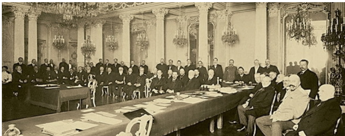
Заседание Императорского русского исторического общества. 1908 г.

Такая работа, связанная с крайне непростым процессом согласований, переговоров с региональными властями, с представителями профессионального реставрационно-архитектурного сообщества – часть трудной и необходимой работы, которую берут на себя единомыслители, участвующие в проекте «Историческая память». Именно отсутствие должного взаимодействия в работе над восстановлением конкретного памятника между реставраторами и чиновниками, между представителями разных уровней власти является зачастую той причиной, которая обездвиживает подобные проекты. Участие представителей партии «Единая Россия», которые в рамках «Исторической памяти» работают исключительно на добровольных и общественных началах, помогает сдвигать дело с мёртвой точки. Заметим, что речь идёт не только о том, чтобы «пробить» финансирование или найти его источники в бюджетных строках. Даже наличие средств, как признаются участники «Исторической памяти», не является гарантией спасения того или иного памятника – нужен контроль над ходом работ, причём контроль не по «верхам», а тот, который можно осуществить только находясь на «земле». Таким образом, представители «Единой России» осуществляют комплексное сопровождение подобных проектов.