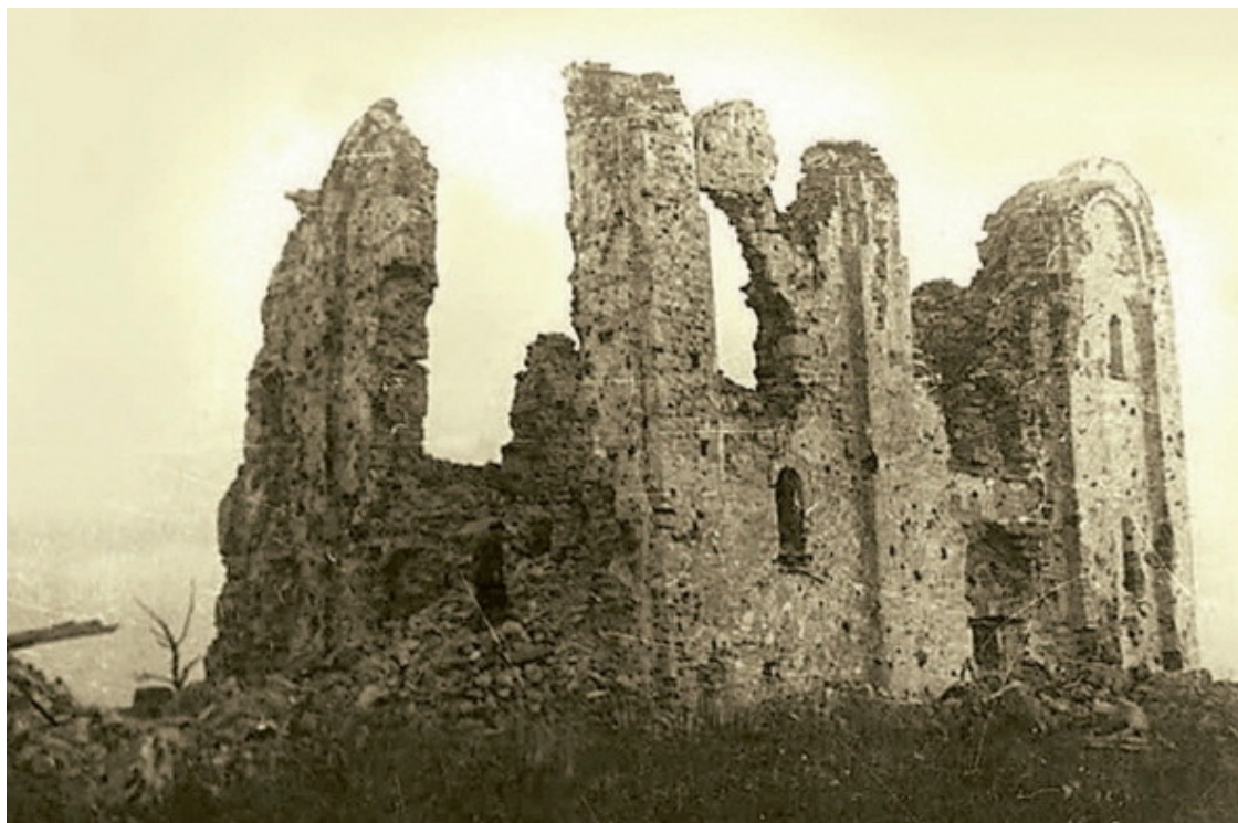
Церковь Спаса на Нередице после Великой Отечественной войны

Проблема отношения к наследию, преемственности всегда была одной из важнейших в жизни любой нации. Она пронизывает национальную философию, политику, этику, искусство. Сохранение наследия является неотъемлемым условием выживания духовных и культурных ориентиров народа, его самосознания и идентитета. Именно такие ориентиры во все времена определяли развитие стран и государств. Та держава, которая хранит память о своей истории – и словом, и делом – не утрачивает своего величия даже в самые сложные для себя времена.