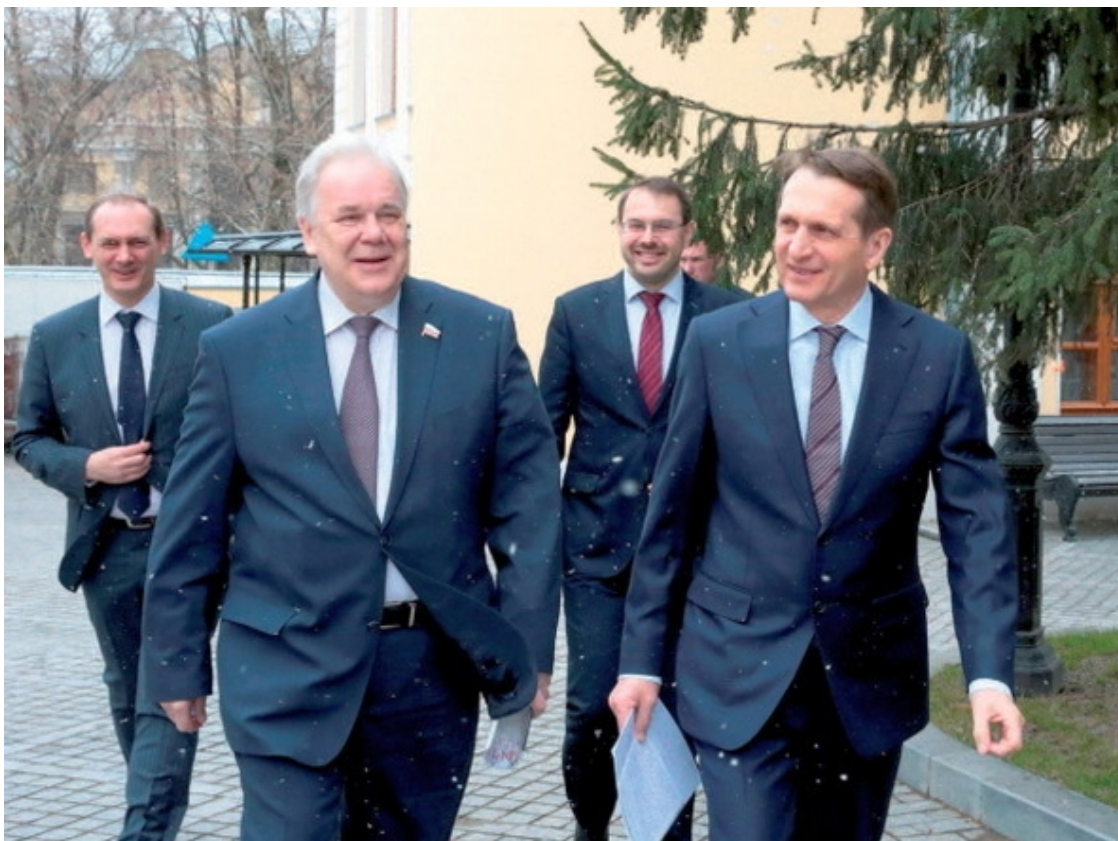
Члены Общественного совета проекта «Историческая память»

В то время реставрация во многих случаях имела идеологическую и даже «историософскую» подоплеку. Решался вопрос о степени самобытности национальной культуры, об истоках ее архитектуры: западно- или восточноевропейских. Об этом должны были свидетельствовать открывавшиеся во время реставраций детали (романские или византийские). Особенно это касалось самых государственно значимых сооружений – соборов Московского Кремля, Владимира, Новгорода и т. п. Художественная общественность живо реагировала, одобряя или остро критикуя проводившиеся реставрационные работы – то, к примеру, за «возвращение мертвой буквы Византии» (К. Рерих о церкви Спаса Нередицы в Новгороде), то за утрату «наивной самодельщины» (И. Грабарь о ней же). И в этих дискуссиях вольно или невольно продолжалось все то же осмысление вектора культурного развития страны.