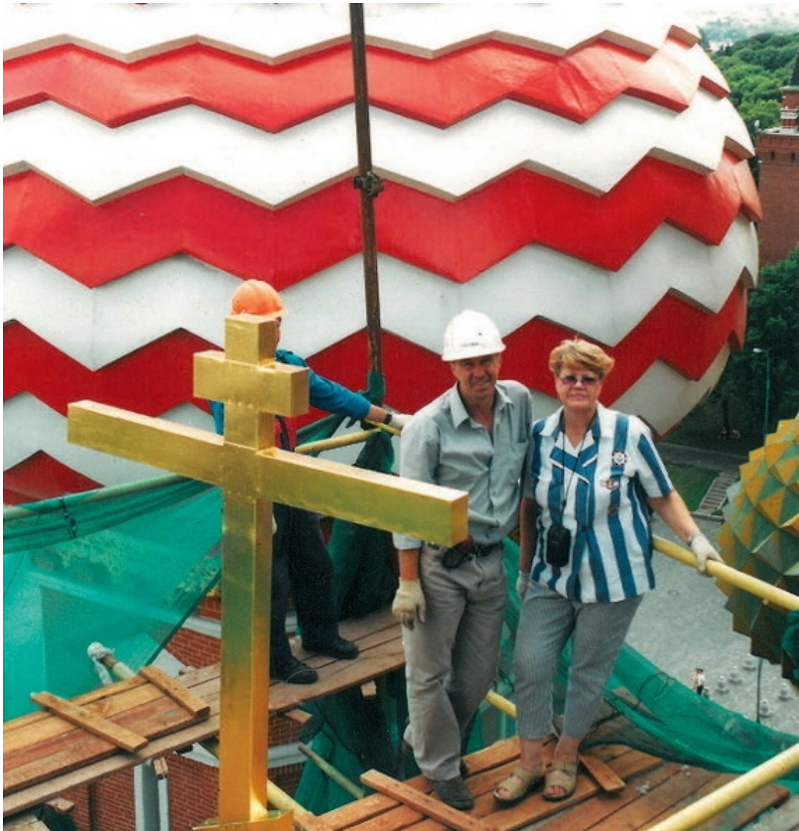
Реставрация Покровского собора на Красной площади

Проект «Историческая память» – это актуальная часть не только общероссийского, но и мирового тренда в отношении к историческому наследию. И дело не только в том, что в круг его реставрационных забот попадает немало объектов Всемирного наследия из Списка ЮНЕСКО. И даже не в том, что российское наследие – само по себе часть мирового. Важнее главные идеологические и методические установки проекта. Особенно в контексте сегодняшних мировых вызовов, брошенных самому понятию историко-культурного наследия – его ценности, «нужности» как таковой. Самые серьезные из них исходят от идеологии глобализации, деструктивизма и им подобных направлений, демонтирующих традиционные ценности. Масштабные миграционные и интеграционные процессы в современном мире и как следствие – культурный плюрализм, преобладание «рыночных» приоритетов, а также информационный взрыв приводят к смешению реальных объектов с симулякрами, «интерпретаций» – с действительно существующим (или существовавшим). Все это стало представлять реальную угрозу «выживанию» культурного наследия, в том числе архитектурного. В реставрации это отзывается болезненными утратами в самих ее основах – прежде всего, в научных подходах, в чувствительности к подлинности и достоверности. Открывается дорога самым «смелым» и «творческим» реставрациям в диапазоне от «археологического кладбища» до Диснейленда.