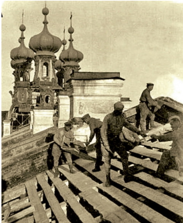
Послевоенное восстановление Екатерининского дворца