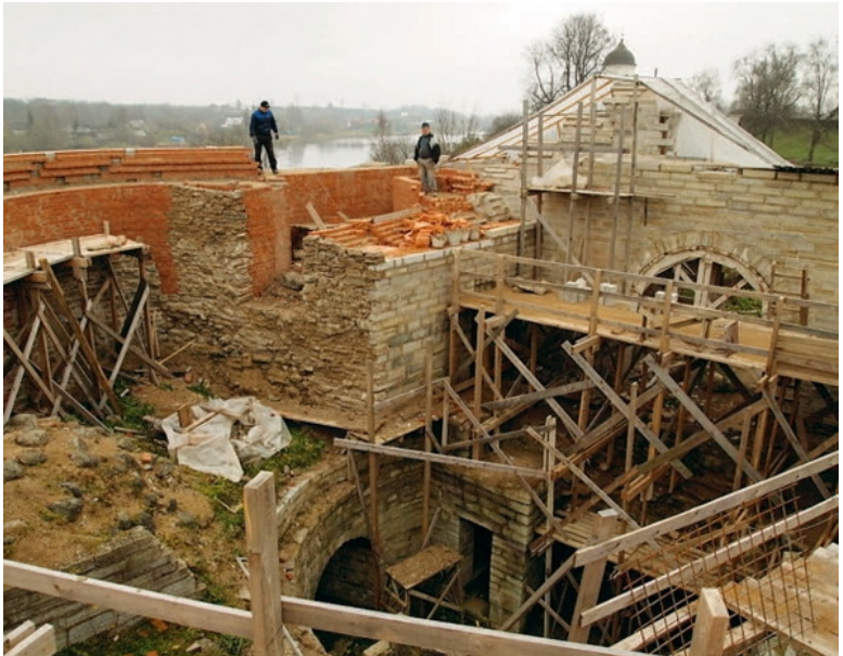
Ладожская крепость. Реставрационные работы на Стрелочной башне. Фото 2011 г.

Главными узлами обороны обновленной крепости стали 5 выстроенных заново трехъярусных пушечных башен. Они располагались по периметру и придавали Ладоге неприступный вид. Новая крепость времен Ивана III представляла собой мощное фортификационное сооружение.