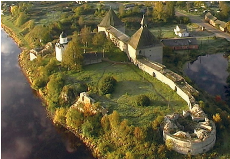
Общий вид Ладожской крепости. 2010-е гг.

Летописные известия о начале каменного строительства в Ладоге относятся к 1114 или, по другим источникам, 1116 г., когда, укрепляя рубежи своего княжества, новгородский князь Мстислав Владимирович, сын Владимира Мономаха, заложил каменную крепость у слияния реки Ладожки и Волхова.