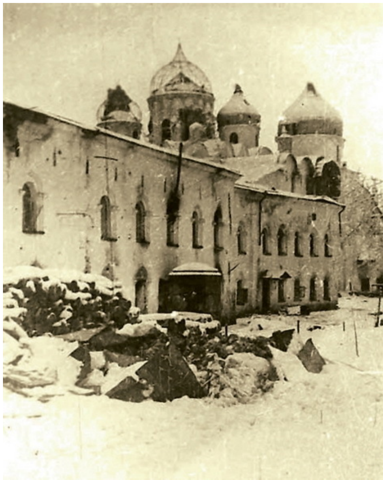
Кремль Великого Новгорода во время Великой Отечественной войны