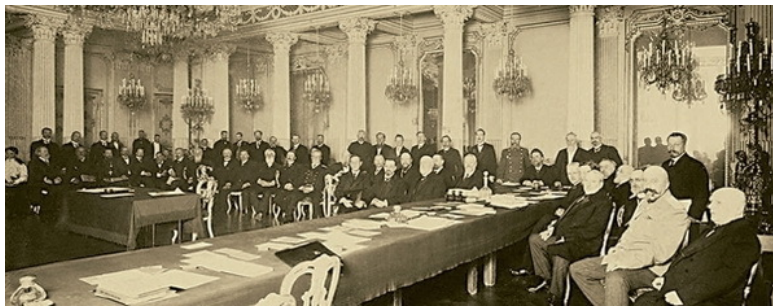
Заседание Императорского русского исторического общества. 1908 г.